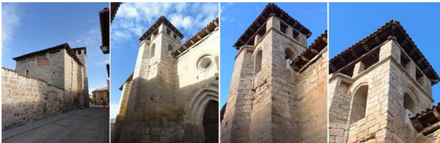
❶ La Calle San Miguel con una construcción adosada a la torre. ❷ La torre románica de tres cuerpos posee adosada a ella su escalera. ❸ Dispone de cuatro ventanas de medio punto con guardapolvo. ❹ Detalle del campanario con una parte superior posiblemente recrecida.

El 12 de marzo de 1053 el monarca castellano-leonés Fernando I dona al monasterio de San Pedro de Cardeña, entre otros, este monasterio benedictino de San Miguel.