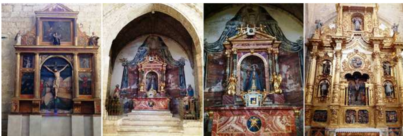
❶ Retablo de tres calles del Cristo de las Batallas, con un Cristo gótico de finales del S. XII o mediados del XIV. Esta imagen estaba en la capilla del antiguo hospital y cuando desapareció este se bajo a esta iglesia. ❷ Capilla con el retablo de la Virgen del rosario elevada con un estrado con escaleras. ❸ Retablo con columnas laterales y un frontis triangular tras el mismo la pared decorada imitando cortinajes y dos ángeles dorados sobre el altar. ❹ Retablo dorado del Calvario de Cristo o Miserere del S. XVI y cuatro santos jesuitas. En la cabecera del brazo derecho del crucero.

En la cabecera del brazo del crucero derecho donde tenía entrada la antigua sacristía esta el retablo del Santo Cristo de fines del S. XVIII.