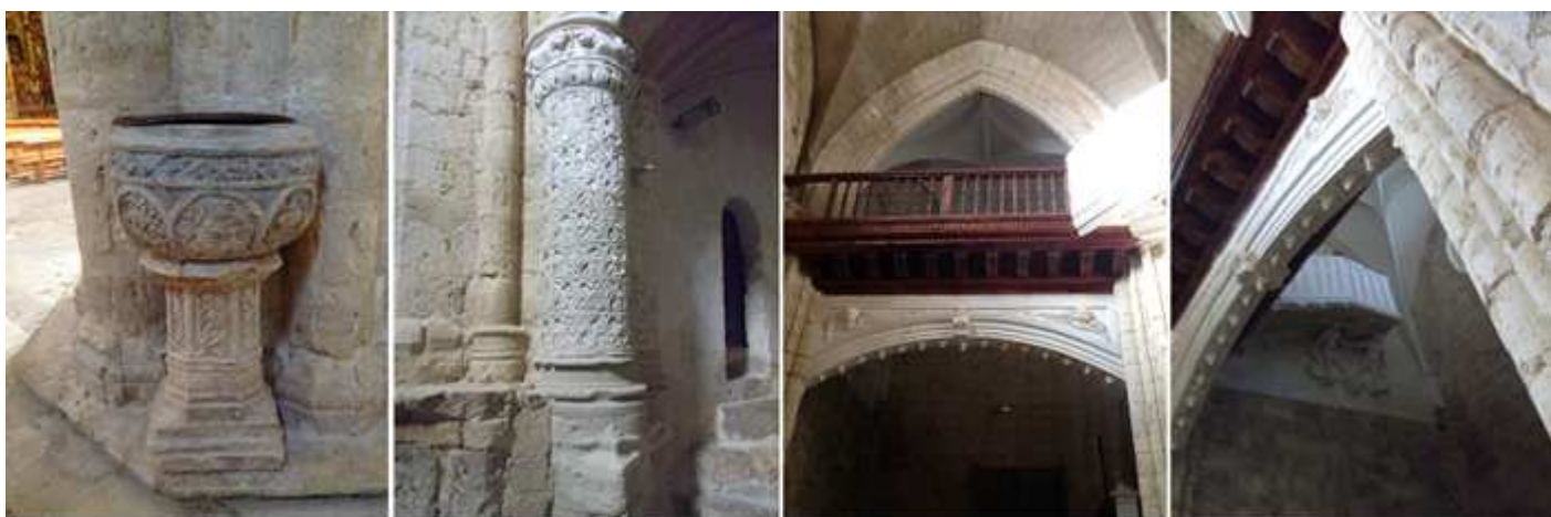
1 Pila de agua bendita en piedra con taza semiesférica con una banda de hojas entrelazadas y de bajo unos gallones grandes de perfil rellenos de motivos vegetales con un fuste octogonal que sus caras presentan tallos hojas y sarmientos de parra con una basa cuadrada a la derecha de la puerta del Evangelio. 2 Columnas en el ángulo inferior del coro con hojas de cuatro pétalos que forman un relieve de rombos sobre las mismas. 3 Galería sobre la puerta del lateral de la Epístola. 4 En este ángulo tuvo una transformación para hacer el paso a la casa del músico (Esta pasarela).

En el primer tramo de la nave de la Epístola, a la izquierda se encuentra la capilla bautismal, cerrada con una reja del S. XIV, y que alberga una grandiosa pila de mármol atribuida a Simón de Colonia y que en su exterior tiene ocho escenas cristológicas entre sus arcos conopiales.