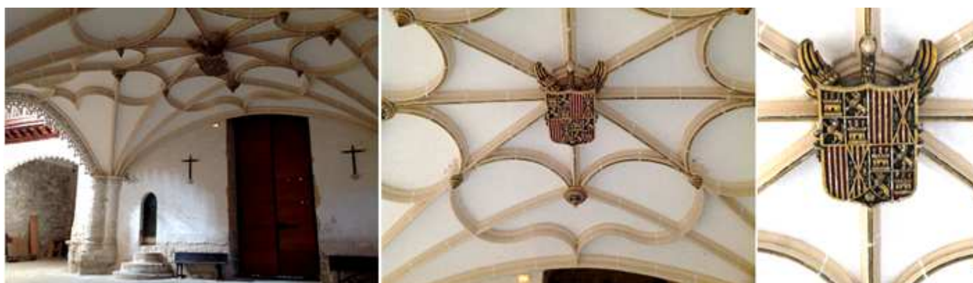
1 Bóveda del coro estrellada. 2 Que del centro de su clave ostenta este gran escudo. 3 Escudo de los Reyes Católicos policromado con alas.

Este coro es la joya de estilo gótico flamígero del S. XV. Es atribuido a Simón de Colonia, pero algún investigador hace constar una inscripción de: "Esta obra la hizo Alonso de Santiago". Tras recorrer esta parte nos acercamos a la nave de la Epístola.