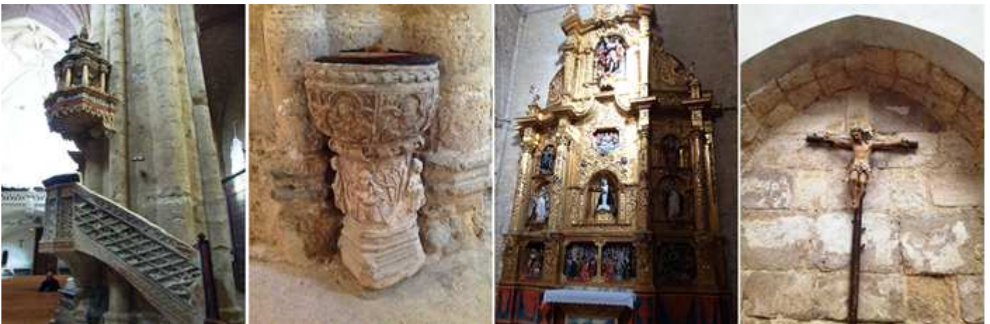
1 Detalle de la barandilla del coro y su tornavoz renacentista. 2 Pila de piedra semicircular con un borde con una espiral dentro de un cordón debajo espacios trilobulados con personas algunas tocadas de corona con un fuste también decorado en relieve con cuatro figuras sobre una basa cuadrada de aristas biseladas. Frente a la entrada por la puerta lateral del Evangelio. Y otra en el lado opuesto. 3 Retablo de Nuestra Señora de la Soledad. Con banco y tres calles y una Virgen de vestir, sobre ella un espacio con un relieve de La Piedad, y las esculturas Santo Tomás de Aquino, San Vicente Ferrer, Santa Bárbara... 4 Un Santo Cristo en este arcosolio apuntado.

A continuación en esta nave del Evangelio antes de su puerta norte, en el transepto está el retablo de la Virgen de La Soledad.