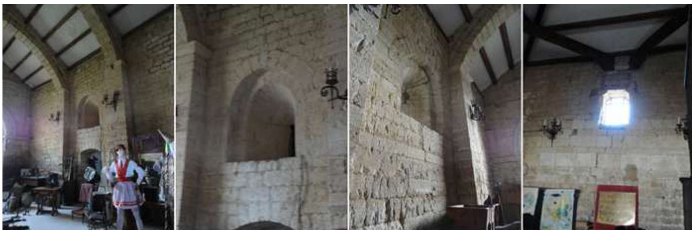
❶ Su interior con un "popurrí" de objetos. ❷ Sobre la puerta a otras dependencias, una venta con gran abocinamiento. ❸ Los dos últimos tramos de la nave donde hay otra ventana. ❹ Y el testero de la iglesia con otra adintelada.

Bajo su espadaña se encuentra su segunda, puerta que esta la mitad cegada al exterior y en su interior posee una arquivolta baquetonada y un guardapolvo con tallos vegetales. Dispone de dos puertas, una al norte y la otra al sur.