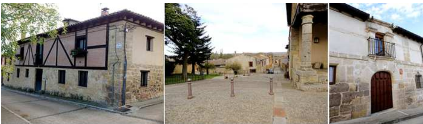
❶ Calle de la Salud, en el lateral del templo de San Hipólito. ❷ Calle Cantarranas, que desciende desde la plaza de San Hipólito para ver la iglesia de San Miguel. ❸ Casa de la calle San Roque, nº 1.