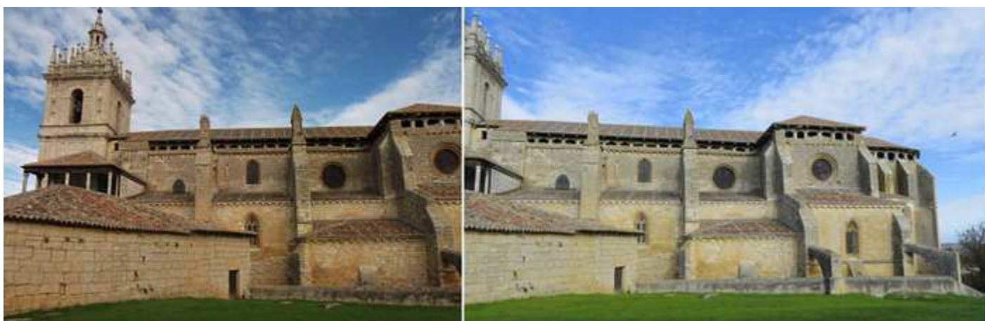
❶ Panorámica con los cuatro primeros tramos del templo desde la campa de las bodegas. ❷ Y parte con su cabecera, en la parte superior una galería abierta con zapatas de madera.

Y tras recorrer tofo su exterior entramos en el templo que está rodeada su fachada con una balaustrada maciza reservando la autoridad eclesiástica en la parte de los pies. Contando con una puerta para cada nave de arco apuntado.