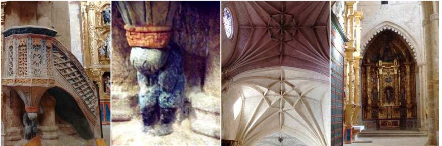
1 Detalles de las yeserías del púlpito. 2 Sustentado sobre una persona de piedra que esta agachada. 3 Bóveda de crucería de la nave central. Las vidrieras son modernas. 4 Retablo de San Juan Evangelista, dorado de tres calles de Bernabé López de 1757 y dorado por José Benito Bravo en 1762.

Y ahora nos pasamos a la nave del Evangelio con el retablo de San Juan Bautista en su cabecera bajo el arco ojival.