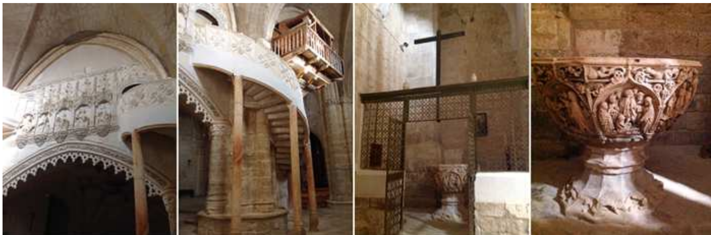
❶ Lateral del coro alto con las cinco figuras de los apóstoles. ❷ Parte posterior a esta nave de la escalera que sube al coro con pequeñas columnas que la sustentan. ❸ Capilla bautismal con una bonita reja de forja del S. XIV, situada a la izquierda de del primer tramos de la nave epistolar. ❹ Pila de mármol del gótico final de gran tamaño (1,5m.) profusamente decorada con arquillos conopiales donde se representan escenas cristológicas: Transfiguración, Entrada en Jerusalén, Expulsión del Templo, Última Cena, Oración del Huerto, Bautismo, Tentaciones y Resurrección de Lázaro, en la capilla del baptisterio a los pies de la nave de la Epístola, es de de Simón de Colonia.