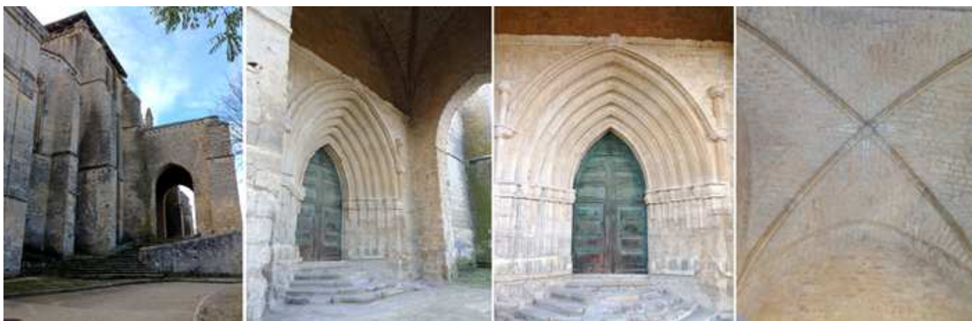
❶ La calle con respecto al templo tiene un importante desnivel. ❷ Bajo el pórtico la puerta norte. ❸ Con una puerta apuntada que cuenta con cinco arquivoltas que descansan sobre impostas corridas y finas columnillas. ❹ Detalle de la crucería simple del pórtico.