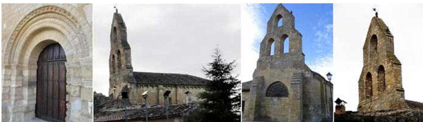
❶ Con una preciosa puerta de tres arquivoltas sobre impostas corridas lisas la arquivolta exterior moldurada con unas roseta o clavos y otra taqueada, en la interior una baquetonada con rosetas y bolas siendo de arista viva la interior, sobre jambas sin columnas. ❷ Parte interior del templo. ❸ A los pies se alza su alta espadaña de dos pisos con tres vanos para sus campanas inexistentes.

En su exterior dispone de una puerta de medio punto ligeramente adelantada entre los contrafuertes del lado epistolar, construida con piedra sillar irregular.