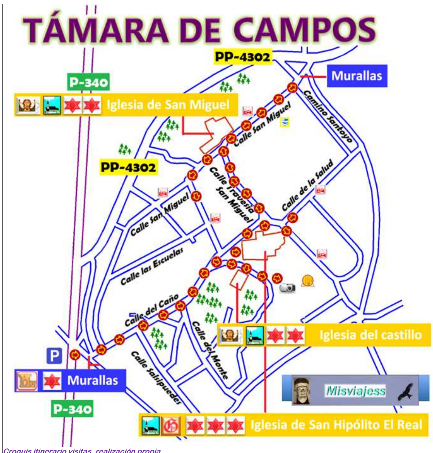
Croquis itinerario visitas, realización propia.

Esta pequeña localidad palentina que dista de la capital a treinta y pocos km. Y que fue en la Edad Media tierra de reconquista, con un pasado de esplendor en tiempos del rey Fernando I. Apenas tiene 100 habitantes que muestran la cordialidad desde su alcaldesa enseñando sus monumentos. http://misviajess.wordpress.com/