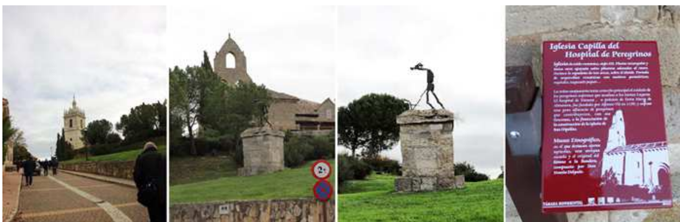
1 Calle del Caño con la torre de San Hipólito. 2 El monumento a la Memoria de los Mayores y al fondo la iglesia del hospital y el ayuntamiento. 3 Este monumento esquemático con un Labrador con su arado. 4 Panel informativo de la Capilla del Hospital.

En este espacio ajardinado se encuentra el monumento a La Memoria de los Mayores y la espadaña de la iglesia del hospital de Peregrinos.