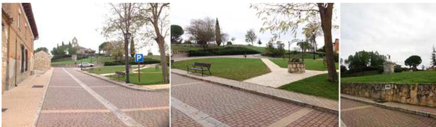
1 Toda esta parte del pueblo esta recientemente urbanizada. 2 Es una zona amplia con jardines que rodea esta loma. 3 En esta loma existía el castillo del que solo ha quedado como testigo la capilla del mismo.

En este espacio ajardinado se encuentra el monumento a La Memoria de los Mayores y la espadaña de la iglesia del hospital de Peregrinos.