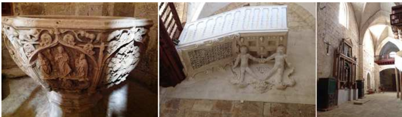
❶ La escena de la Transfiguración y a la derecha la Entrada en Jerusalén. ❷ Galería que comunica con la casa del músico y que en su parte inferior hace constar el hecho del hundimiento de la torre y el derribo de seis capillas en 1563. "GOBERNANDO LA SILLA APOSTOLICA PIO V DE BUENA MEMORIA I REINANDO EN ESPAÑA DON PHILIPPE 2 EN EL ANNO DE 1568 VLTIMO DIA DEL DICHO ANNO I PRICIPIO DE 69 SE VUNDIO LA TORRE DESTA IGLESIA LA QVUAL DERIBO SEIS CAPILLAS" ❸ La nave de la Epístola hacia los pies.