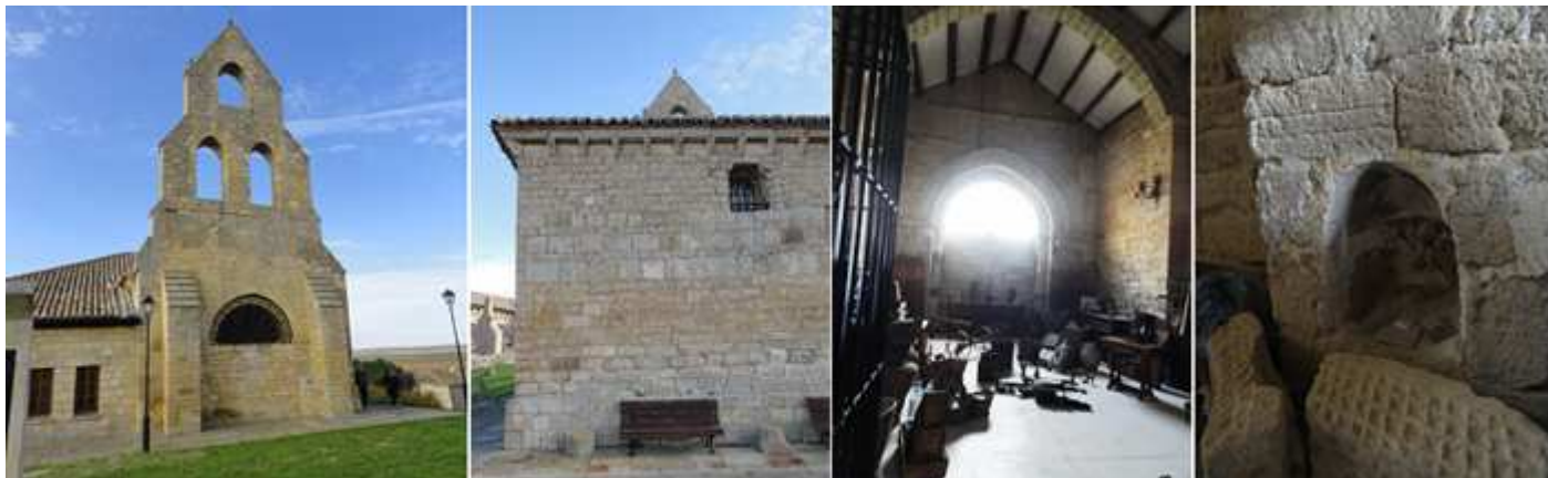
❶ Hastial del templo donde su puerta se encuentra parcialmente cegada. ❷ Y su cabecera recta. ❸ Interior. ❹ Hornacina.

De su exterior llama poderosamente su atención la alta espadaña que le sobresale de su cubierta con tres vanos desprovistos de campanas, todo su alero está sustentado por canecillos de nacela o proa de barco.