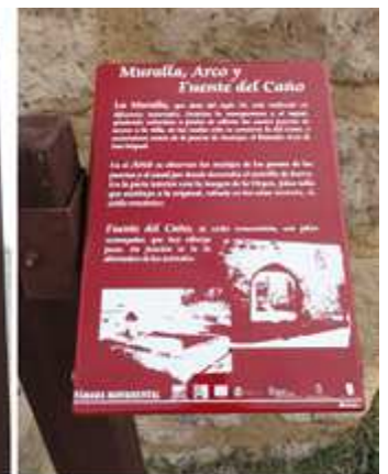
1 Desvío de entrada a Támara de Campos junto a la P-430. 2 Panel con las siluetas de los monumentos a visitar. 3 Información de las murallas y la fuente.