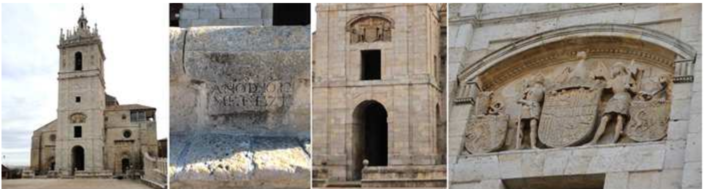
❶ El templo con torre herreriana. Atribuida al maestro Santiago de Sigüenza. ❷ Sobre el pretil que rodea su fachada la inscripción "ANO DE 1682 ME FECIZT". ❸ Con una puerta por debajo de su torre. ❹ En el segundo cuerpo de la torre ostenta unos escudos.

Es una obra con los estilos gótico de transición con restauraciones barrocas y renacentistas en los S. XV y XVIII, que solo por este templo justifica la propia visita a Támara.