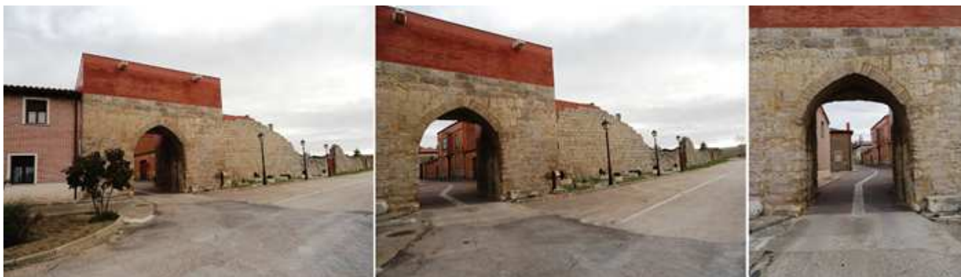
❶ Arco y Murallas con su puerta de arco ojival y que ha sido restaurada y recreada a su estado original con ladrillos. ❷ De las cuatro puertas que disponía la muralla solo conserva esta de la calle del Caño. ❸ Por cuya puerta entramos en el pueblo. S. XIV

Estas son del S. XI. Están realizadas en diferentes materiales aunque domina el tapial y la mampostería. Existían cuatro puertas aunque solo se conserva la del Caño. En la parte interior está la imagen de la Virgen de estilo románico sobre el frontal del arco rebajado.