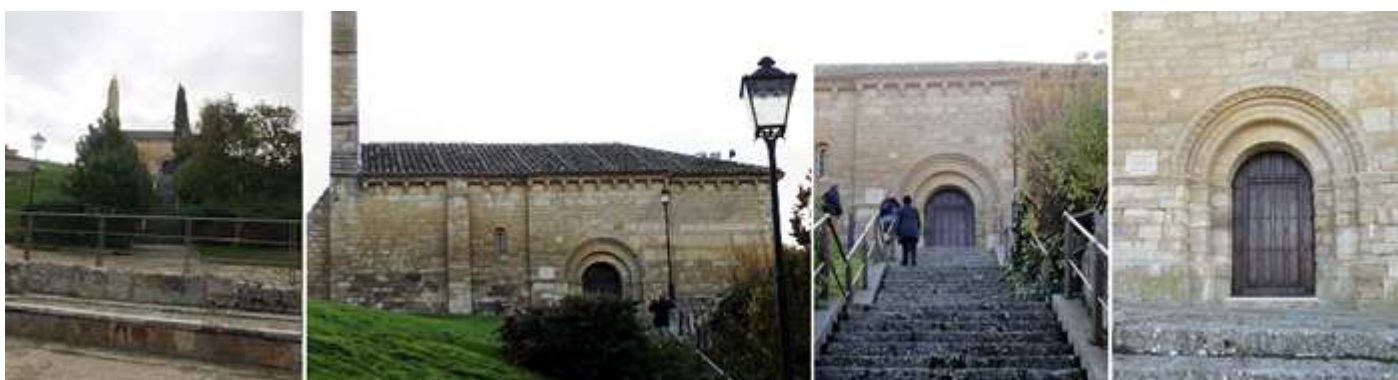
❶ Arriba en la loma se encuentra este templo románico ❷ Lateral epistolar del templo. ❸ Con una larga escalera de varios tramos para subir. ❹ Y con su puerta de medio punto.

Iglesia románica del S. XII con planta rectangular y única nave de cinco tramos con cubierta a dos aguas con arcos fajones apoyados sobre pilastras que tiene adosadas al muro. Llamada así aunque nunca hubo fortaleza ni castillo.