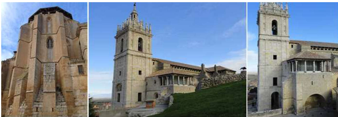
❶ Su ábside central con gruesos contrafuertes. ❷ Vista de su preciosa torre herreriana. ❸ En este ángulo junto a los pies esta la vivienda del músico S. XVII sobre la capilla bautismal, con una galería mirador.