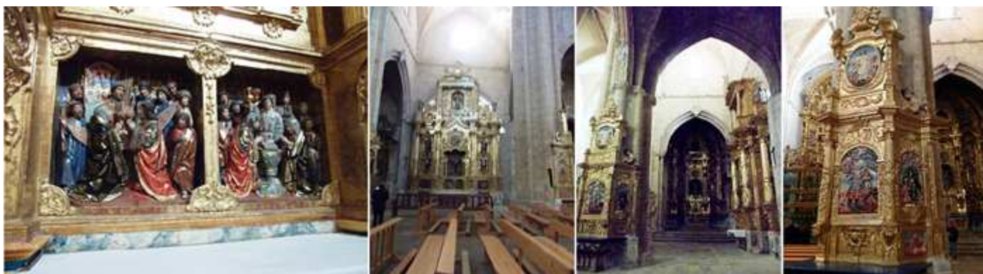
❶ Con escenas de la Pasión en la predela. Este retablo barroco lo realizó Tomás Prieto y lo doró Francisco Zorrilla. ❷ Vista desde la parte opuesta del crucero. ❸ Vista de la cabecera de esta nave. ❹ En el pilar central se encuentra este retablo barroco con la Virgen del Carmen.

Los pilares son cilíndricos, y cuentan con columnillas adosadas que soportan los arcos y los nervios de sus bóvedas de crucería sencilla y los tramos más tardíos estrellada tardo gótica. En las laterales son de crucería cuadripartita y en los tramos de los pies son estrelladas.