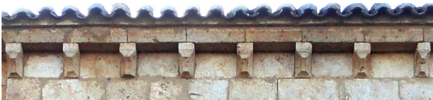
1 Línea de canecillos en su fachada epistolar.