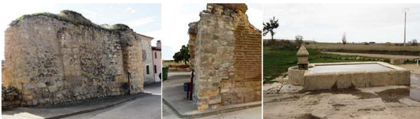
❶ Lienzo con contrafuertes en la calle San Miguel. ❷ Esquina con el Camino Santoyo. Y los restos lateral de la puerta de San Miguel. ❸ Lateral que se conserva del arco de entrada, y que en este caso no sobresalía de las murallas al estar retranqueada. Esta la Fuente del Caño, de estilo renacentista con un pilón rectangular que alberga peces, cuando su función era la de abrevadero.

Otro tramo de la muralla se encuentra al final de la calle San Miguel con el Camino de Santoyo. Las puertas que poseía eran: la de San Miguel, San Roque, del Caño y del Monte.