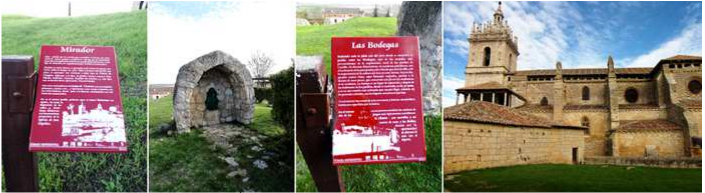
❶ Características del mirador. ❷ La campa posee esta fuente. ❸ Información de las bodegas soterradas. ❹ Y una magnífica vista.

Donde poder observar el campo de Támara con su extensión sobre la llanura, palomares, casetas, eras, etc.