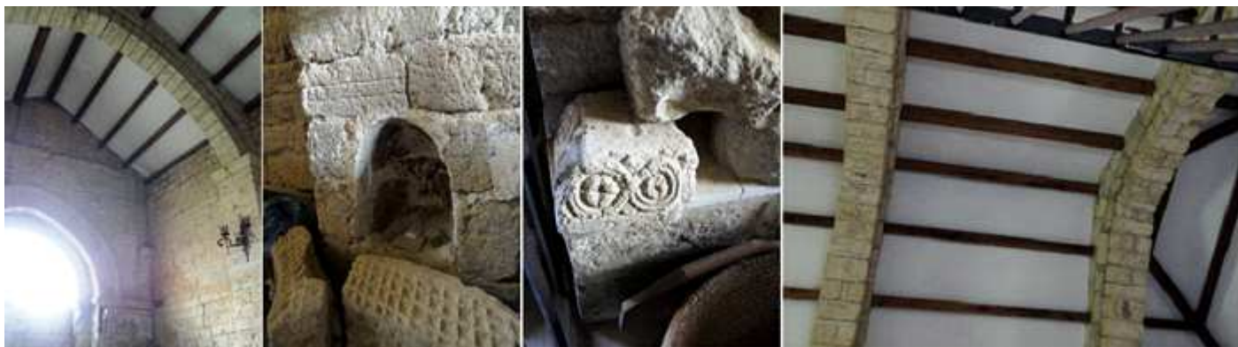
1 Parte inferior. 2 Hornacina a la izquierda de la puerta epistolar. 3 Restos arquitectónicos. 4 Cubierta a dos aguas con arcos fajones.

Estuvo vinculada al Camino de Santiago y contó con hospital para los peregrinos, lugar en el que se hospedó Sancho IV de Castilla en 1286 durante su peregrinación a Santiago.