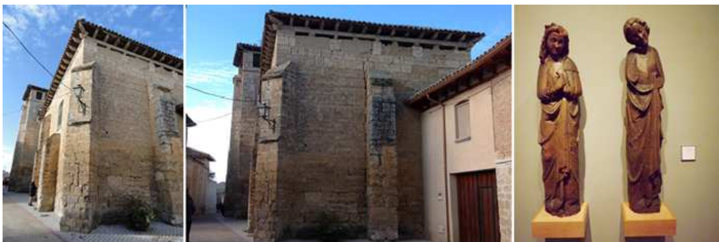
❶ Posee en sus exterior gruesos contrafuertes. ❷ Y su cabecera que es recta. ❸ De su interior son la Virgen y San Juan, tallas de madera de inicios del S. XIV. Se encuentran en la Sala nº VI del Museo F. Mares de Barcelona. Procedentes de este templo.