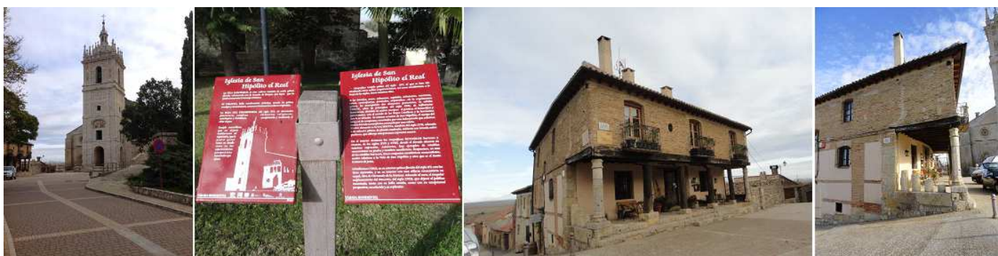
1 Con la iglesia de San Hipólito al fondo. 2 La información de este majestuoso templo gótico. 3 La casa porticada con pilares de madera salvo las esquinas, que hoy es un hotel rural. 4 Esquina del mismo a la calle Cantarranas.

Tiene forma trapezoidal esta plaza llamada también de San Hipólito a nuestra izquierda una casa con su porche porticado, en frente el templo de San Hipólito y a la derecha las escaleras que suben a la iglesia del castillo y al Ayuntamiento que está en la parte posterior.