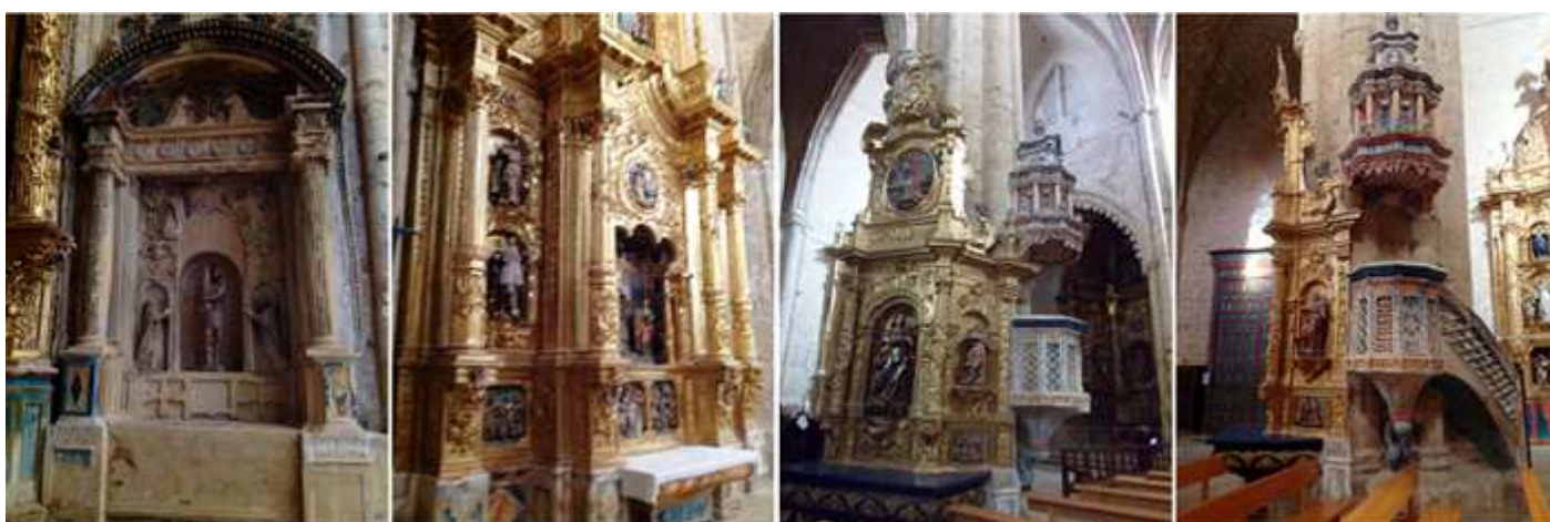
❶ Retablo de Cristo atado a la Columna en el lateral derecho de este ábside, de piedra con dos columnas estriadas sobre su entablamento un Calvario, y en la parte central una hornacina con Jesús atado a la columna y a sus lados dos estatuas orantes. Parte del fondo estucado y policromado se ha perdido. ❷ El retablo de la cabecera. ❸ El retablo barroco de la Inmaculada en el otro pilar central junto al púlpito. ❹ Púlpito, obra de yesería mudéjar tardío de finales del S. XV y su tornavoz de principios del S. XVI.

La capilla de la Virgen del Pópulo en el lateral derecho dispone de otro retablo, Con Jesucristo atado a la columna.