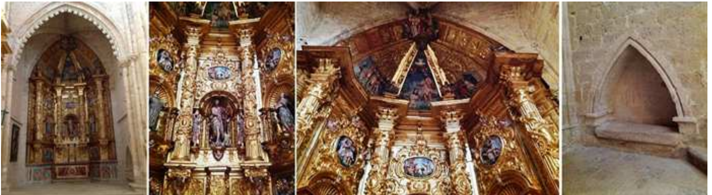
1 Retablo con decoración barroca en sus fustes y con capiteles corintios. 2 En el centro la hornacina con el titular y rodeada de cariátides. 3 En cada calle hay medallones con escenas de la vida de San Juan. 4 Arcosolio apuntado con un posible sepulcro.

A continuación en esta nave del Evangelio antes de su puerta norte, en el transepto está el retablo de la Virgen de La Soledad.