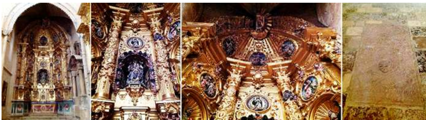
❶ Retablo de tres calles que se adapta a este ábside poligonal con tres calles. ❷ Donde se venera en su hornacina centra a la Virgen del Pópulo. Talla sedente con el Niño. ❸ En sus relieves están representadas: La inmaculada, la Natividad, la Circuncisión, La Visitación, la Ascensión, etc. ❹ Lada sepulcral con un epitafio y una calavera con tibias cruzadas.

Y llegamos a la capilla absidal de la Epístola con un retablo como el de la cabecera del Evangelio.