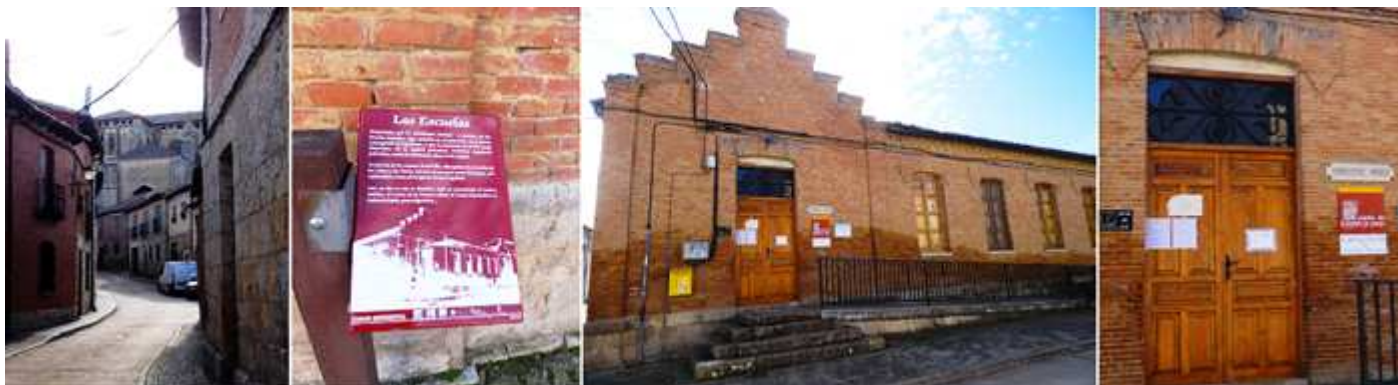
❶ Calle perpendicular de la travesía de San Miguel, con la iglesia de San Hipólito al fondo. ❷ Panel informativo de las Escuelas. ❸ Construcción muy sencilla. ❹ Hoy día esta parte es el Consultorio médico, y hogar de día.

En esta misma calle si avanzamos nos encontramos con la edificación de las escuelas edificio modernista muy sencillo construido en ladrillo, en esta parte baja del la localidad.