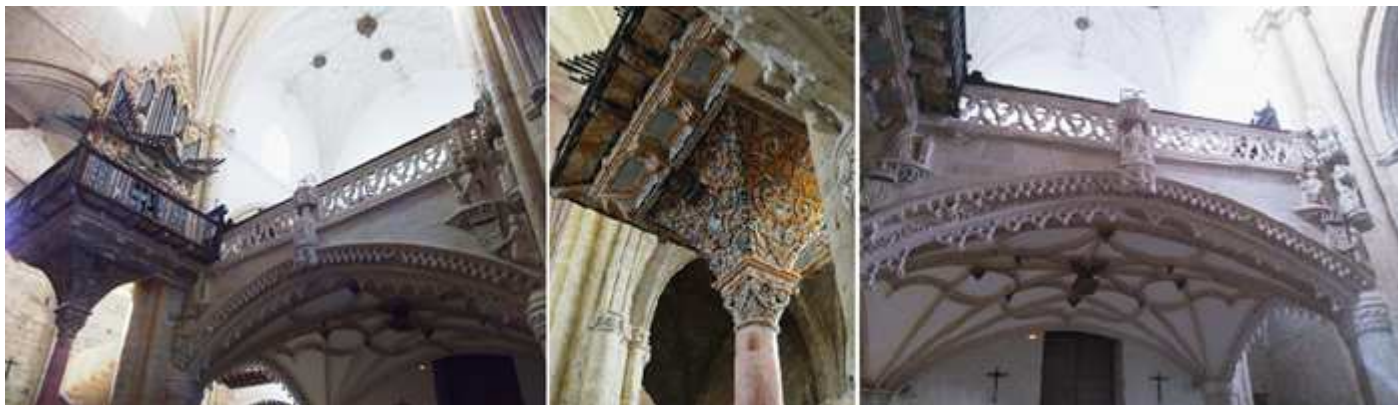
1 El órgano. 2 Con la base que sustenta su galería. 3 Frontal del coro con su balaustrada, en el centro la escultura del Padre Eterno y bajo el símbolo de la Anunciación y en los lados la escultura del arcángel San Gabriel y la Virgen María.