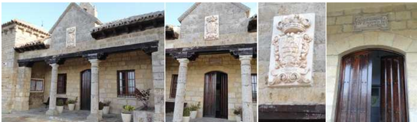
1 Pórtico con dos columnas centrales toscanas redondas 2 Sobre la parte central un frontis triangular. 3 Que dispone del escudo en relieve de la localidad. 4 Y su puerta de arco rebajado.

En la construcción adosada a la iglesia están la casa Consistorial. De sus instalaciones destaca su pórtico con columnas de piedra.