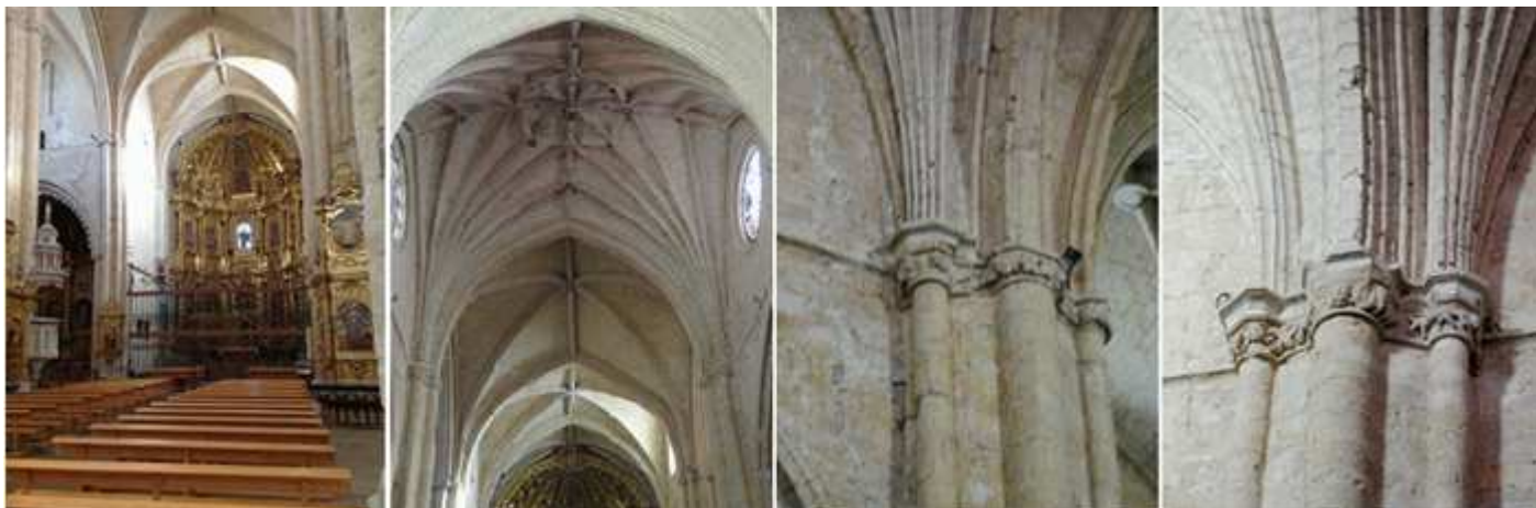
❶ Vista de la nave central. ❷ Con las bóvedas de la misma donde se aprecian el cambio de la construcción de crucería sencilla y los tramos posteriores en estrellada tardo gótica. ❸ Una fina imposte recorre la nave central a la altura de los capiteles de sus columnas. ❹ Y sobre los mismos arrancan los arcos y nervios de sus bóvedas.

En el S.XVII se construyó una sacristía en el lado izquierdo de la cabecera de influencia herreriana, que no llegamos a poder verla, donde dispone de una cajonería de nogal, y en ella se custodian las piezas litúrgicas y vestuario religioso. En sus ángulos sendas esculturas barrocas de Isaías, Jeremías, Moisés, y el rey David.