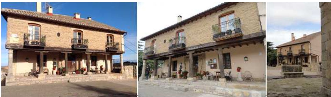
❶ Casa con la planta primera de ladrillo y orientada al medio día. ❷ Casa de estilo castellano. ❸ Vista desde debajo del pórtico de la iglesia. Esta plaza estuvo totalmente porticada y esta casa es el único testigo de aquella época.

Esta villa en la época medieval formaba parte del conjunto de las Nueve Villas de Campos y fue villa de Realengo.