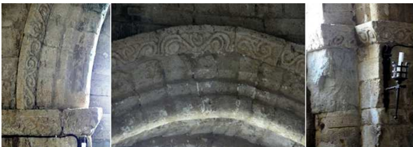
❶ Lateral izquierdo de la puerta de los pies ❷ Tramo central de su arco. ❸ Y el lado derecho con un capitel erosionado sobre su columna de fuste redondo y una imposta con motivos vegetales y roleos.

La villa de Támara fue regida como señor territorial por la Orden de San Juan de Jerusalén y como hospitalarios antiguamente desempeñó el papel de Hospital de peregrinos, hoy en su interior es un Museo Etnográfico con las artes populares, que han recogido sus vecinos.