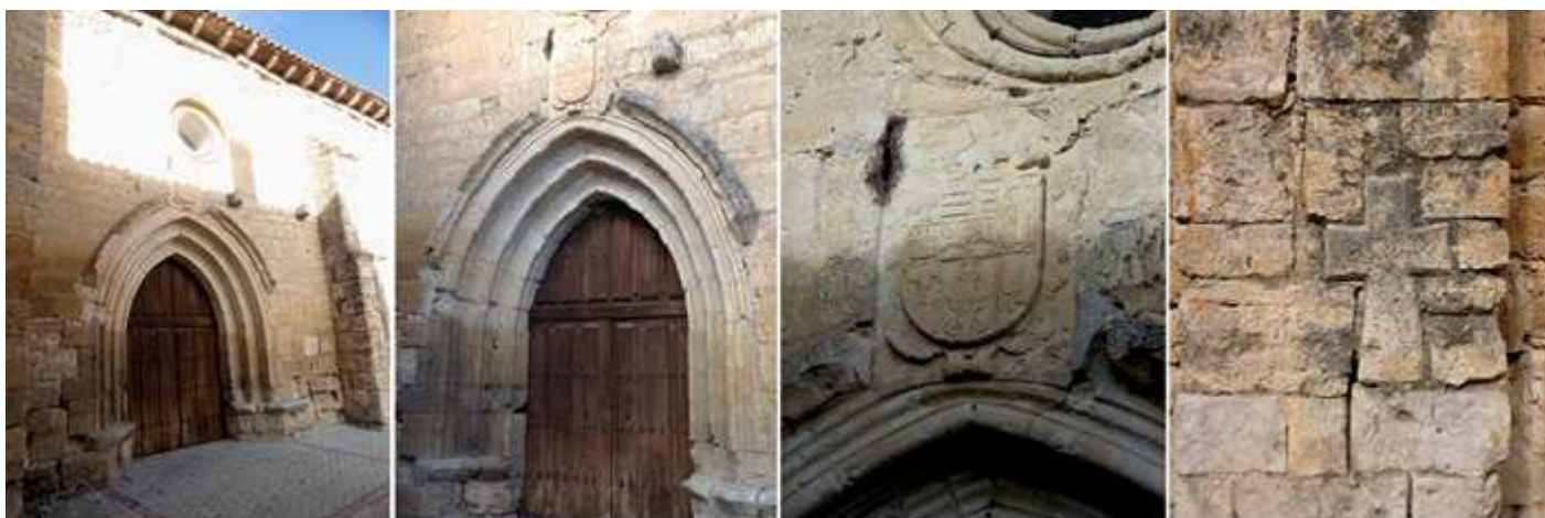
❶ Su puerta de arco apuntado entre los contrafuertes y sobre la misma posee un óculo. ❷ Con tres arquivoltas vaquetonas que llegan a un pequeño pódium pues no posee ni columnas ni capiteles, y un grueso guardapolvo. ❸ Sobre la misma un notable escudo que no he conseguido localizar a quien pertenece. ❹ En el ángulo derecho de su fachada esta cruz entre sus sillares.

La fachada de la iglesia se encuentra en la confluencia con la Travesía de San Miguel casi perpendicular a su puerta. En su interior dotada de nave única con bóvedas de crucería que conservan restos de policromía, y posee en el altar Mayor un retablo barroco y un púlpito gótico con yeserías. Esta cerrada al público. Se emplea como lugar de exposiciones.