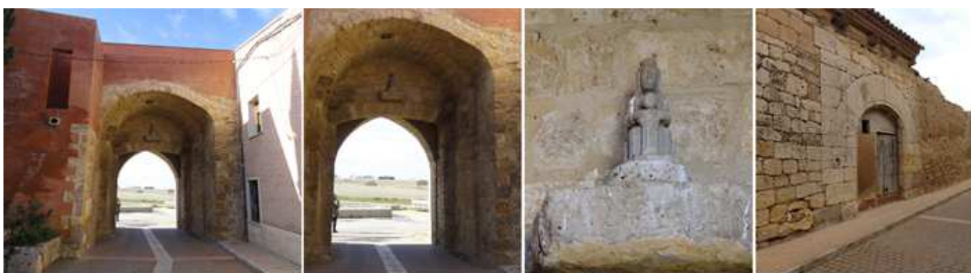
❶ La parte posterior de esta portada. ❷ En su parte interior aún se aprecian los goznes de sus puertas, y el canal por donde descendía el rastrillo. Y el espacio de la Virgen románica que existía y que fue robada en los años 90. ❸ Talla de piedra de la Virgen sustituyendo la original. ❹ Un poco más adelante esta portada rebajada de grandes dovelas que fue abierta en los lienzos de la muralla.

Otro tramo de la muralla se encuentra al final de la calle San Miguel con el Camino de Santoyo. Las puertas que poseía eran: la de San Miguel, San Roque, del Caño y del Monte.