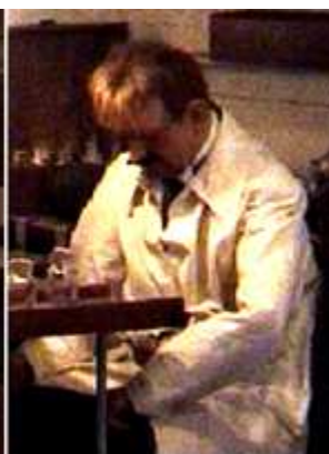
❸ Y uno de sus colaboradores.