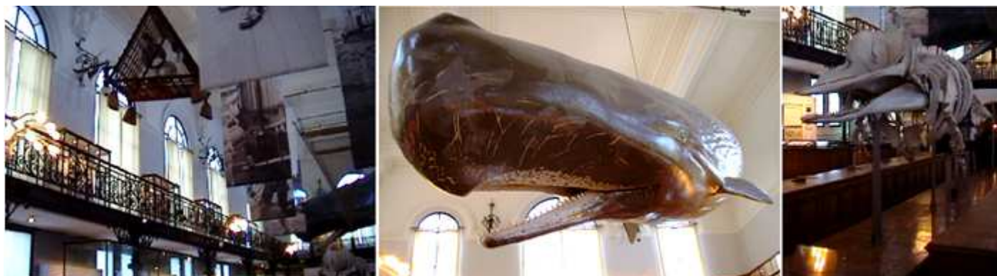
❶ Sala de las Ballenas. ❷ Ballena reproducida casi a tamaño natural. ❸ Un esqueleto de estos mamíferos. ❹ Y un esqueleto de ballena.

Y en el nivel 1º nos encontramos la sala de la Ballena, con todo lo relaciona con esta familia de cetáceos. Donde podemos apreciar a este cetáceo con una reproducción gigantesca como también con diferentes esqueletos de esta familia que suspendidos del techo nos muestras las diferentes partes de las mismas.