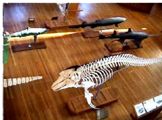
❶ Otros cetáceos más pequeños.