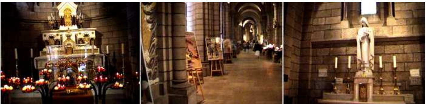
❶ Altar de la Capilla Mayor. ❷ Vista de la nave lateral de la Epístola. ❸ Capilla con la imagen de la Virgen de Lourdes ¿?.

En las pilastras de sus arcos disponed de columnas redondas adosadas, con sus capiteles donde descansan los arcos fajones de sus bóvedas de cañón.