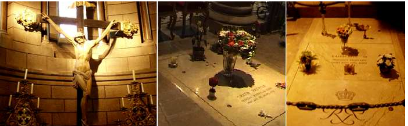
❶ Capilla del Santo Cristo. ❷ Sepulcro de Gracia Patricia. Que pereció en 1982 a los 52 años ❸ Sepultura del príncipe Raniero III

En templo de planta de cruz latina con tres naves siendo mucho mas ancha la central y separadas con arcos de medio punto, y con unas galerías abiertas con arcos de pedio punto con columnillas y capiteles.