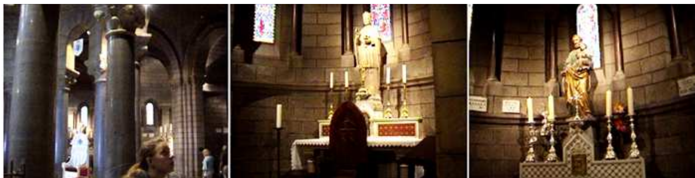
❶ Lateral del deambulatorio desde el lado epistolar. ❷ Capilla con San Nicolás. ❸ Capilla de San José con el Niño.

Recorremos el deambulatorio donde se alojan las capillas radiales que posee esta cabecera todas ellas semicirculares.