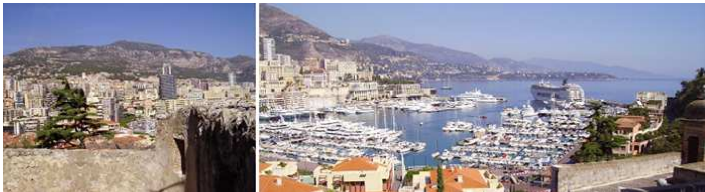
❶ Desde las laderas la construcción llega hasta el mar. ❷ Vista del puerto de Hercules

Ya en la estación de Mónaco nos dirigimos a la salida, pues hay una que va a Mónaco y otra a Montecarlo. La estación de Mónaco es enorme. Por lo tanto, una vez llegado a la estación, bajas del tren y vuelves andando hacia atrás hasta la salida Mónaco-Ville. Al final de la estación sigues por unos pasos subterráneos con cintas transportadoras (tipo aeropuertos) Es un túnel de considerables dimensiones. y cuando sales a la superficie te encuentras a menos de 8 minutos andando del Palacio del Príncipe y a 10 del Oceanográfico.