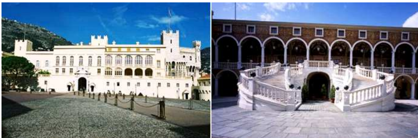
❶ Fachada del palacio ante la gran plaza que dispone. ❷ Plaza de Armas y el lateral derecho del palacio con una doble escalera (en forma de herradura), realizada en mármol de Carrara, ante las galerías de Hércules con sus dos plantas. En esta plaza en verano actúa la Filarmónica de Montecarlo.

Pasamos a la parte opuesta del palacio y accedemos a una gran galería que da a un patio, por esta galería se accede a las estancias, que la mayoría de ellas dan entrada o salida por la misma, es importante la pared que hay enfrente de esta galería, profusamente decorada y en el interior del palacio hay un pequeño recorrido para visitar diversas salas y estancias.