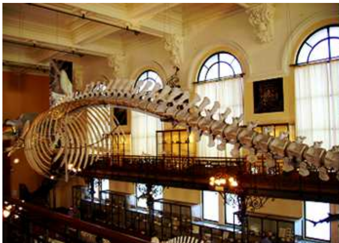
❶ Un esqueleto que casi ocupa media sala.