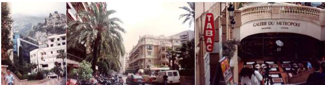
① Hay zonas de Mónaco que su orografía son constantes subidas y bajadas. ② Avenida junto al hotel Metrópole. ③ La galería comercial en el sub suelo del hotel Metrópole.