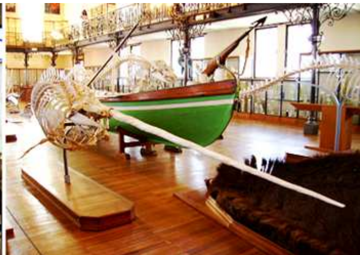
❷ Esqueleto con un largo unicornio.

Volvemos a subir al nivel calle, donde está el Salón de Honor y la exposición Ingenieros de la Mar de la Sociedad Cousteau.