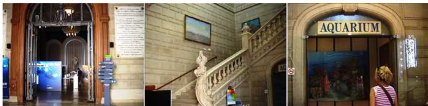
❶ Hall de entrada. ❷ Escalera de mármol de acceso a la planta primera. ❸ Entrada del Acuario.