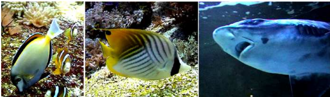
❶ Las formas y colores abarca una infinidad de tipos con colores atractivos. ❷ Otro pez con unas rayas características. ❸ Y el astro rey de los acuarios, el tiburón de los que hay varias especies.

Y en el nivel 1º nos encontramos la sala de la Ballena, con todo lo relaciona con esta familia de cetáceos. Donde podemos apreciar a este cetáceo con una reproducción gigantesca como también con diferentes esqueletos de esta familia que suspendidos del techo nos muestras las diferentes partes de las mismas.