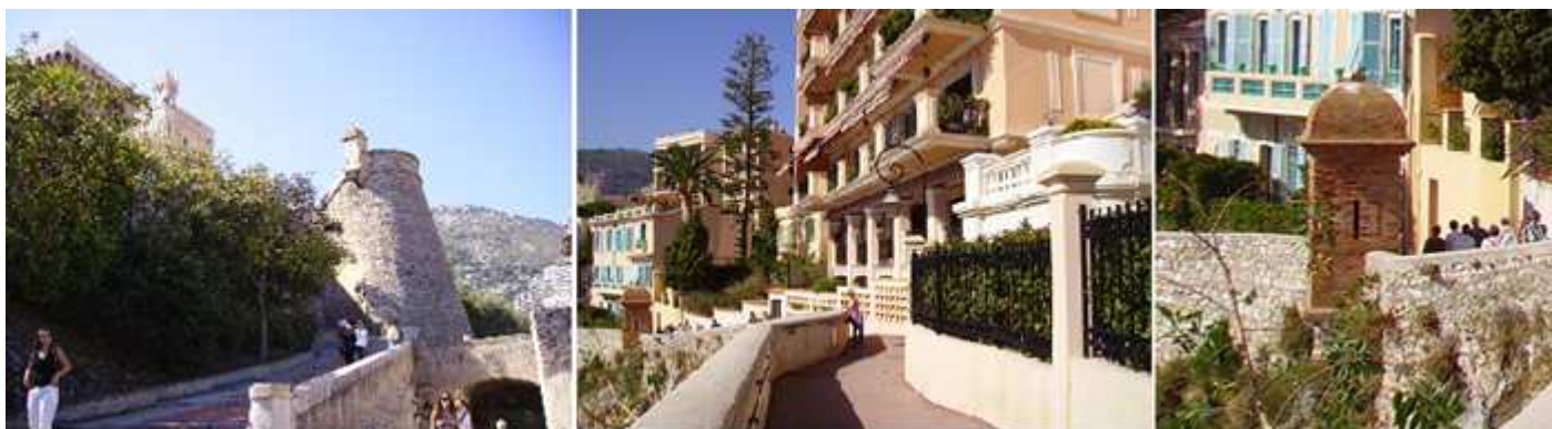
❶ Subiendo hacia el palacio del Principado. ❷ Vistas hacia el puerto de Fontvieille. ❸ Con restos de muralla y una garita.

Al final de la cuesta, accedes a la explanada del Palacio, no sin antes tomar algunas fotos de estas vistas maravillosas.