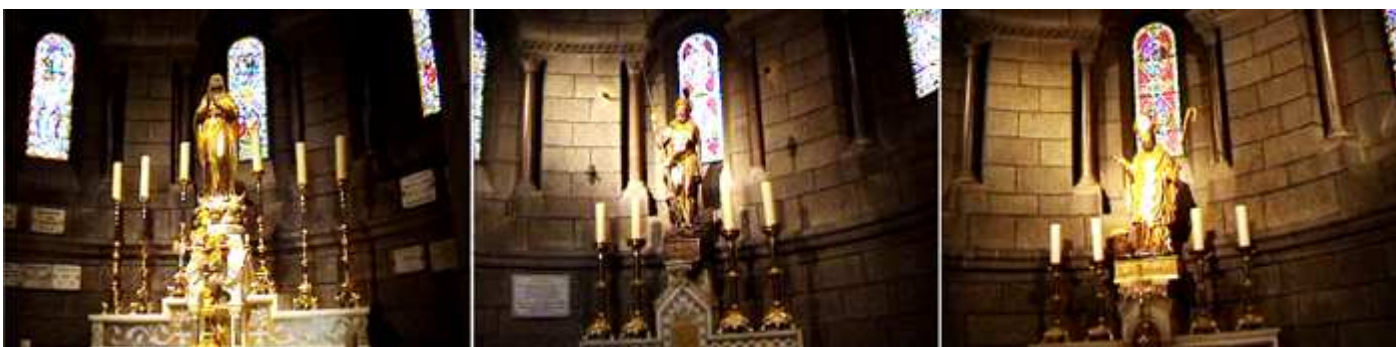
❶ Capilla de la Purísima Concepción. ❷ Capilla de San Jorge ❸ Capilla de San ¿?

Capillas como la de La Purísima Concepción, San Nicolás, San Jorge, San José con el Niño, etc.