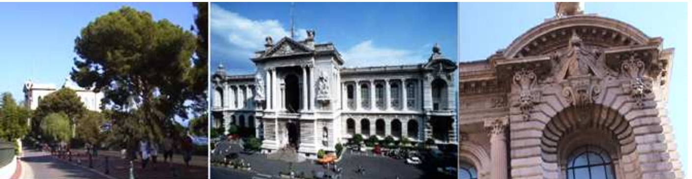
❶ Y nos acercamos al museo. ❷ Con una formidable fachada clásica. ❸ Uno de los ángulos laterales con profusa decoración.

Su fachada es imponente por los grupos esculpidos alegóricos a los temas marítimos. En el distrito de Mónaco, lindero al hermoso boulevard costero Alberto I, se encuentra el Museo Oceanográfico fundado por el príncipe Alberto I en 1906 e inaugurado en 1910. Dispone de más de 6.500 m2 con en un edificio de planta rectangular y estilo clásico que posee dos interesantes fachadas a la avenida de San Martín y la posterior que da al acantilado y al mar ( la parte más alta a 87m).