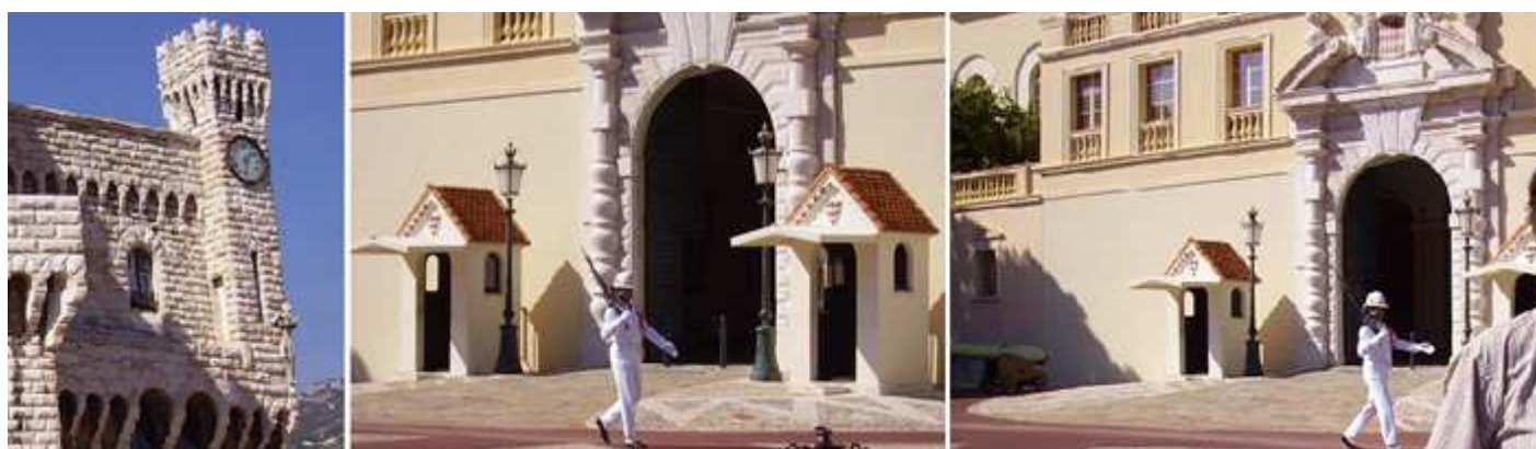
1 La torre del reloj. 2 Ante la puerta del palacio la guardia desfilando ante el mismo. 3 Puerta con un frontis abierto y sendas garitas para la guardia a sus lados.

La familia genovesa de los Gibelinos pone la primera piedra de la fortaleza.