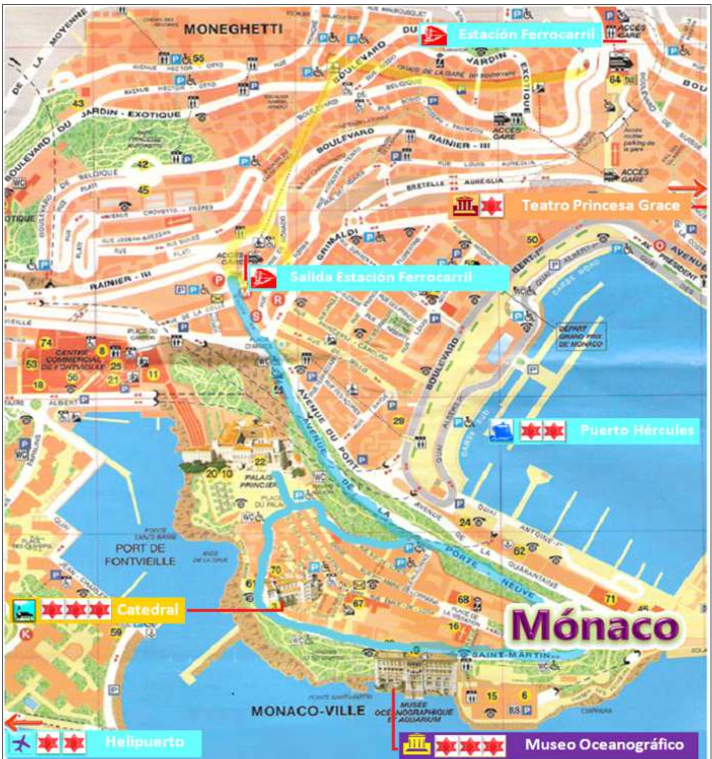
Croquis itinerario visitas, plano empleado de un folleto de Turismo. En el plano he señalado en amarillo el recorrido subterráneo y en azul el de superficie.

MÓNACO Palacio del Príncipe, Museo Oceanográfico y Acuario, Catedral de San Nicolás, Puerto, Teatro Princesa Grâce, Museo de los Recuerdos Napoleónicos y Colección de Archivos Históricos del Palacio, Helipuerto y Carreras.