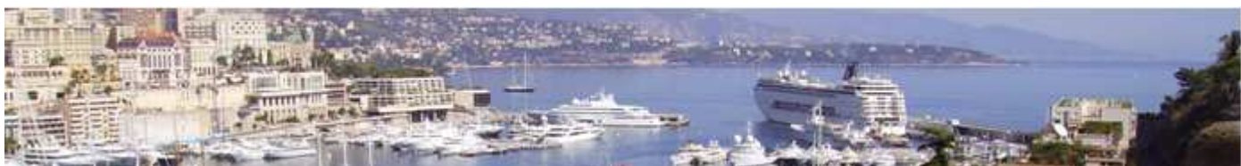
❶ Panorámica de su puerto repleto de lujosos yates.

Príncipe, por unas escaleras (ver el plano a la derecha del Palacio marcado junto a los WC como "Rampe Major") Es un poco cuesta arriba pero con unas vistas preciosas del Puerto de Mónaco (en el plano "Port Hercule").