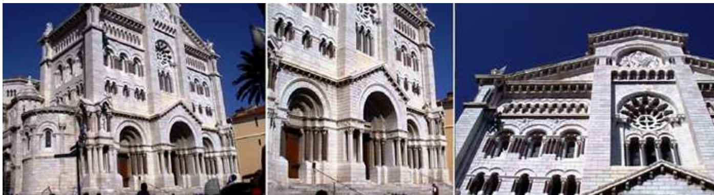
❶ Fachada con una de sus capillas laterales semicircular. ❷ Su fachada de dos cuerpos y con un friso triangular. ❸ En la parte superior posee un Pantocrátor, encima del su rosetón calado.

El 6 de enero de 1875, el Príncipe Carlos III puso la primera piedra. La Catedral cuenta también con los patrones de los santos Nicolás y Benito.