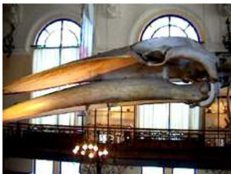
❶ Parte del esqueleto de la cabeza de una ballena.