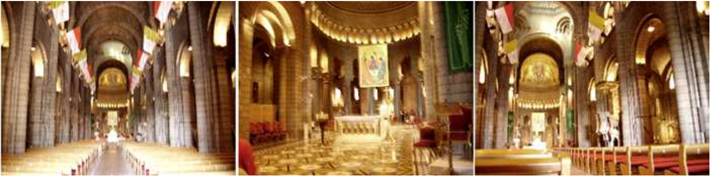
❶ Su nave central con una considerable altura de sus bóvedas. ❷ Parte de la cabecera. ❸ Y este lado de la Epístola.