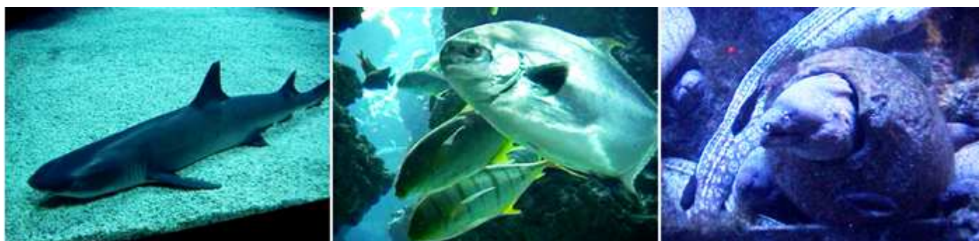
❶ Muestra de un tiburón. ❷ La variedad de peces es muy numerosa. ❸ Una morena metida en un ánfora.

Y nos adentramos en él, con la previsión que estaremos unas 2 horas, que se prolongaron con creces. Iniciamos por el Acuario para recorrer, luego el resto de plantas, por lo que bajamos al nivel -1 donde nos encontramos... La laguna, a los tiburones en el paso el arrecife a tamaño natural, una multitud de peces coloreados bordea a lo largo de los corales ascendidos al acuario.