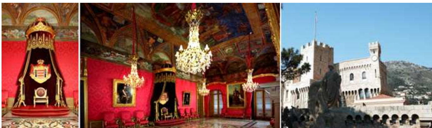
❶ Trono del Príncipe. ❷ Salón del trono con sus techos decorados y varias lámparas de cristal. ❸ Vista del palacio, esta parte se asemeja más a un castillo.

Desde finales del siglo XIII, es el hogar de la Familia Grimaldi. Hoy es la residencia de Alberto II. Además de un símbolo de lujo y glamur para Mónaco.