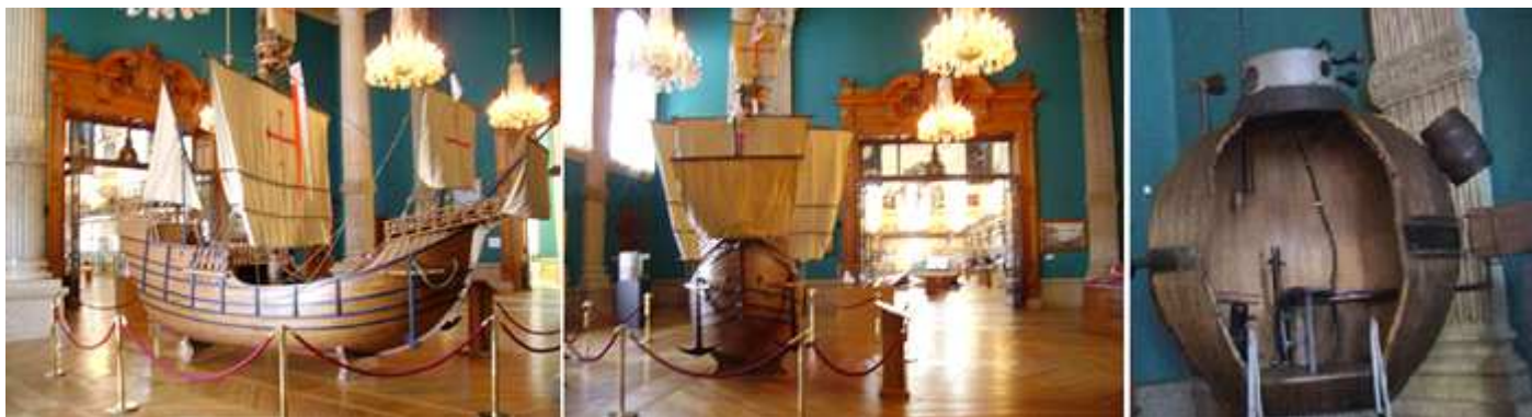
1 Maqueta de la nao Santa María. 2 Proa de la misma a la salida de la sala. 3 En un rincón de esta sala podemos observar un peque batiscafo ideado por el conocido Jacques Cousteau.