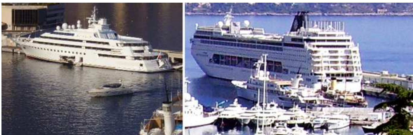
① Diversos tipos de cruceros hacen escala en Mónaco desde los pequeños. ② Hasta los más grandes con la última tecnología y capacidad de pasaje.