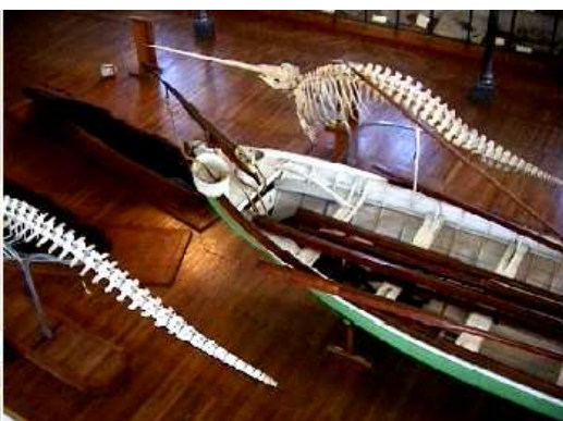
❷ Barca con arpones para cazar las ballenas.