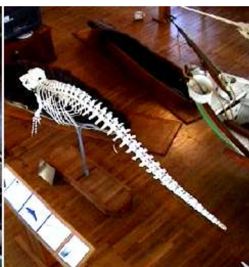
❸ Otro esqueleto de la familia de los cetáceos.