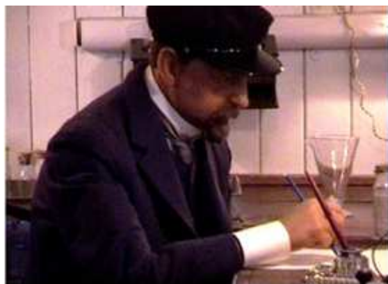
❶ Caracterización del investigador Cousteau.

Volvemos a subir al nivel calle, donde está el Salón de Honor y la exposición Ingenieros de la Mar de la Sociedad Cousteau.