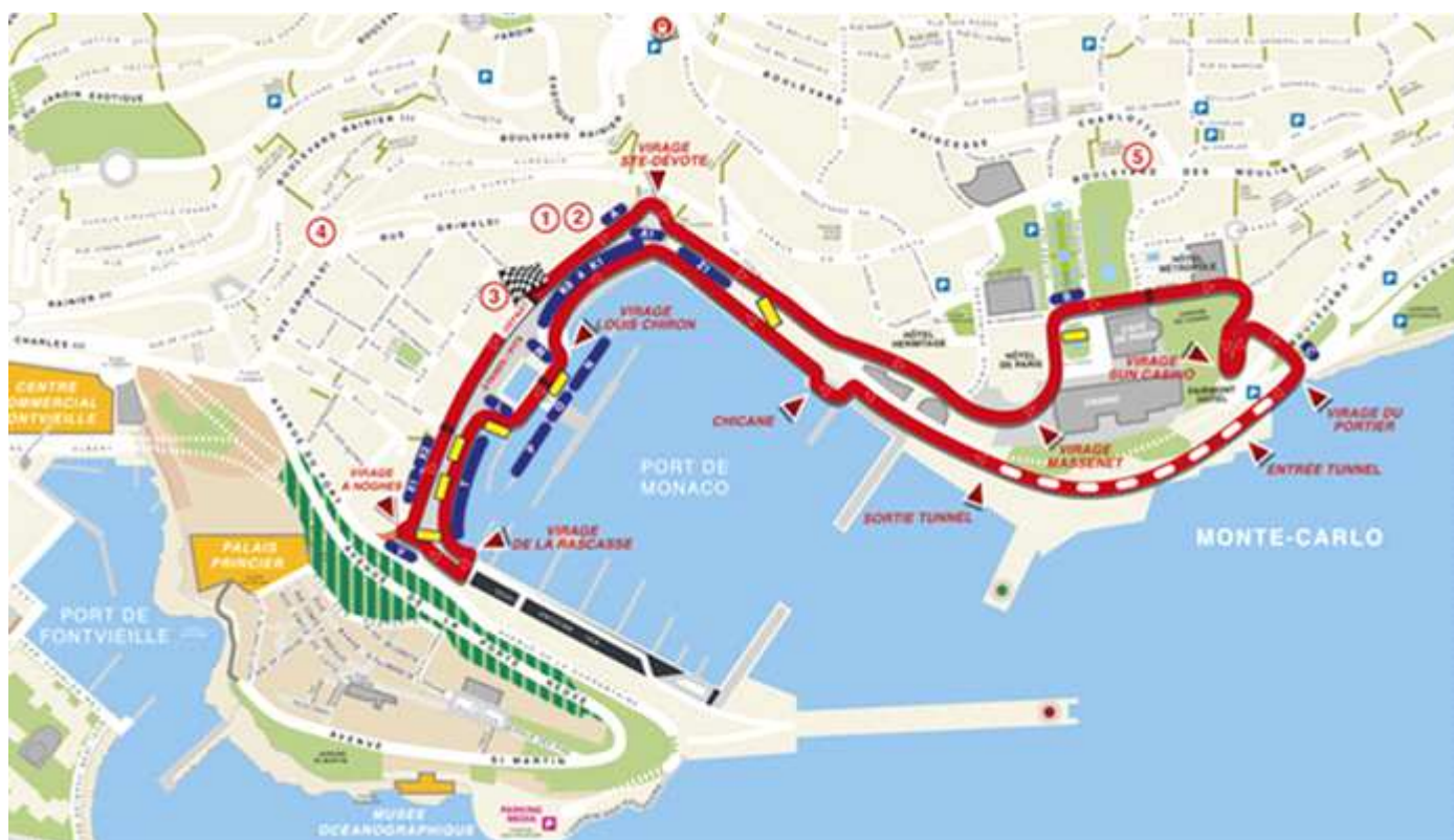
① Croquis Circuito de las Carreras. De http://www.monacomania.net/gp-formula1.php .

Y considerándose unos de los atractivos de Mónaco, pero durante el Circuito de Formula I Montecarlo permanece cerrado debido a las carreras.