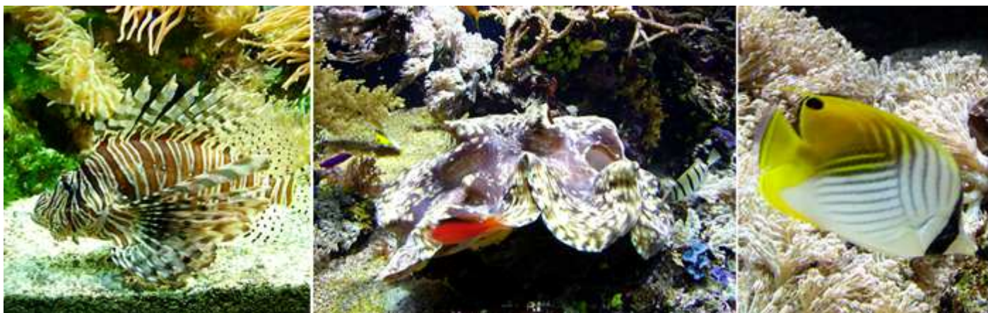
❶ Las formas de algunos son dispares. ❷ Y otros con formas raras. ❸ Algunos muestran colores y rayas caprichosas.

En el 2º nivel nos encontramos con los Mares Tropicales y el Mediterráneo, y se completa con una reconstrucción de los biotopos mediterráneos.