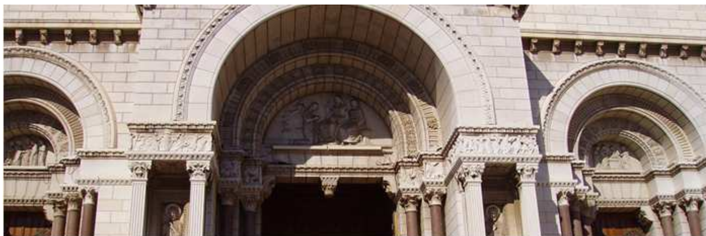
❶ En su parte inferior la fachada posee una puerta central algo adelantada, y otras dos más pequeñas a los lados con sendas arquivoltas decoradas y con sus respectivos tímpanos.

Dejamos de contemplar sus exteriores y entramos en el templo.