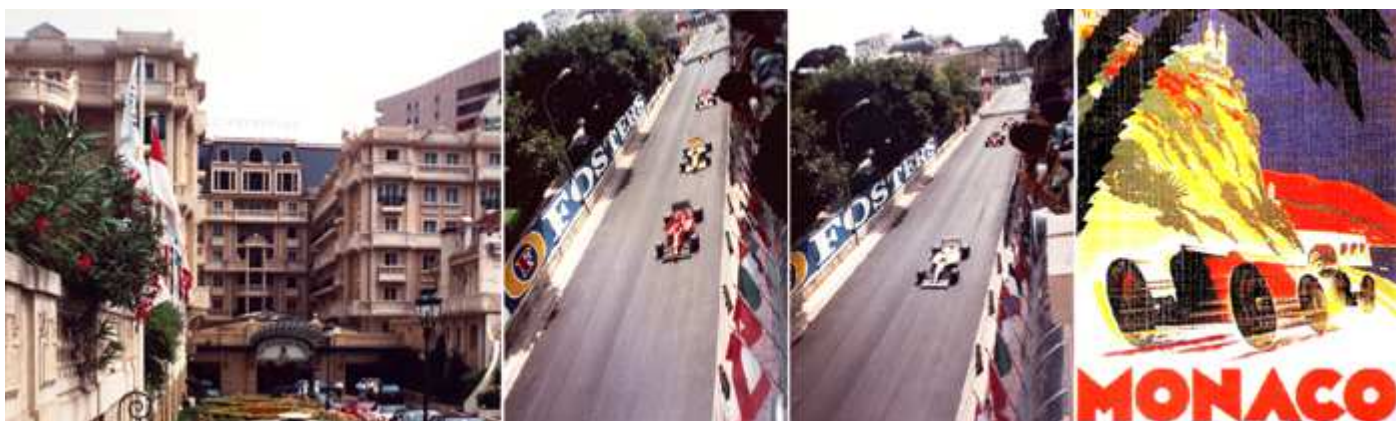
1 El hotel Metropol. 2 Desde las terrazas del hotel. 3 Presenciar la carrera de coches. 4 Cartel retrospectivo de estas carreras.

El complejo del casino es un sistema de juegos de azar que incluye también el Gran Teatro de Montecarlo, una ópera y en marzo se celebra la Baile de la Rosa donde la familia Grimaldi y los acaudalados participan para conseguir fondos para la Fundación Kelly.