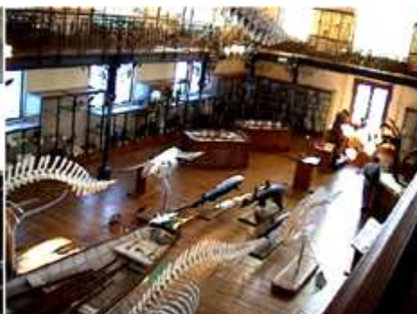
❸ Desde esta galería se observa perfectamente lo expuesto en la parte baja de la misma.