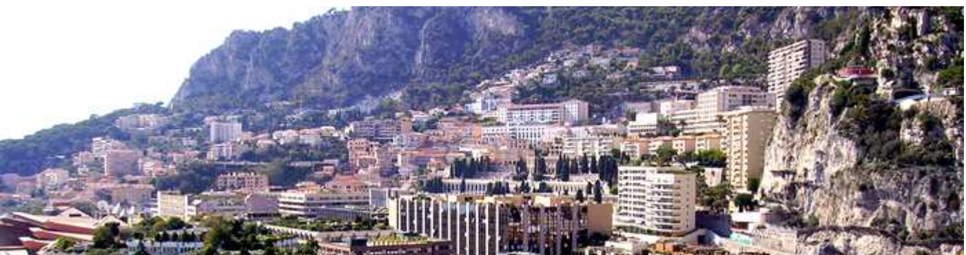
1 Panorámica de la ladera donde se asientan las nuevas construcciones, y donde radican numerosas empresas sus sedes sociales. En el año 1860 toda esta ladera estaba desierta.

El príncipe Raniero desde que rompió con Onasis y le compro las acciones que poseia en la Sociedad de Les Bains, efectuó una constante renovación y transformación del país ya mediante sus negocios, como con la aportación de constructoras produciendo un cambio y modernización del minúsculo estado. El Principado se encuentra entre el mar Mediterráneo y las bajas estribaciones de los Alpes, enclavado en la Riviera francesa.