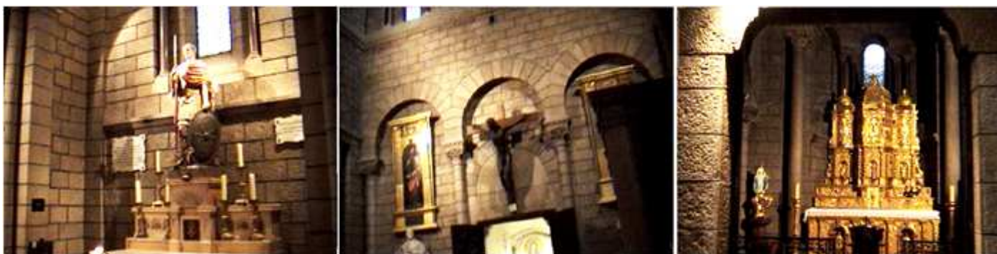
❶ Capilla de San Roman. ❷ Lateral del brazo de crucero derecho y la puerta que dispone en este lado. ❸ Capilla del Santísimo Sacramento, que se abre en este brazo y colateralmente a la Capilla Mayor.

Su ábside semicircular compuesto por un deambulatorio donde se abren sus capillas radiales