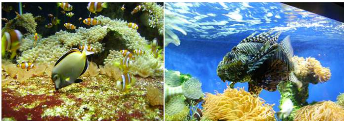
❶ El atractivo de los peces te lleva dispara la cámara. ❷ Pues a cada uno de estos exóticos y en el hábitat que se mueven.

Merece la pena traer un trípode o bastón de apoyo para hacer las fotos, dado los ejemplares rarísimos que posee este museo.