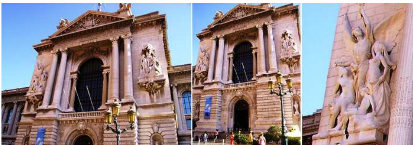
❶ Bloque de la parte central donde se encuentra su entrada principal. ❷ Sobre el cuerpo superior de su fachada sendos pares de columnas sostienen un frontis triangular ❸ Y dos esculturas a los lados.