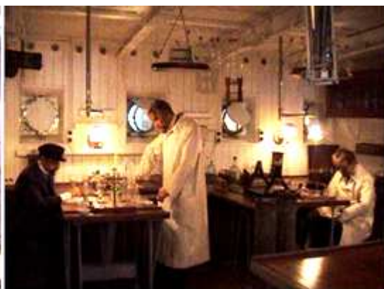
❷ El laboratorio de investigación.