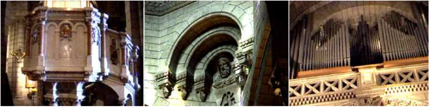
❶ Púlpito en el lado de la Epístola sustentado con una columna central y cuatro pequeñas. ❷ Trompa del cimborrio octogonal de crucero. ❸ Órgano de la década de los 70 del siglo pasado

Una vez vista la catedral y las tumbas de los Príncipes, nos trasladamos al museo Oceanográfico, las distancias, no son grandes sobre todo si has planificado, subir, para luego ir bajando... En la Avenida de Saint Martín