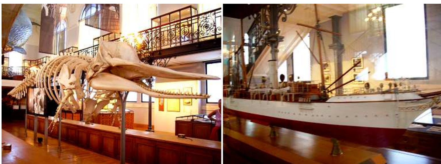
❶ Esqueleto de un cetáceo.

Y también con la información, objetos y embarcaciones para la pesca y la explotación de las ballenas.