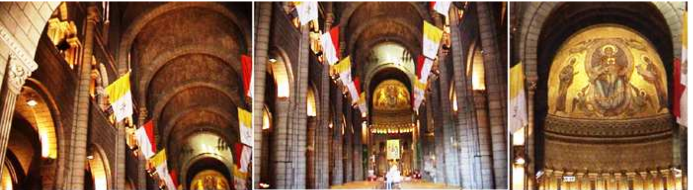
❶ Sobre las naves laterales dispone de unas galerías. ❷ Sus bóvedas sobre arcos fajones. ❸ Cascarón de la capilla Mayor con la Virgen con el Niño rodeadas de ángeles y a los lados san Pedro y el profeta Isaías.

En templo de planta de cruz latina con tres naves siendo mucho mas ancha la central y separadas con arcos de medio punto, y con unas galerías abiertas con arcos de pedio punto con columnillas y capiteles.