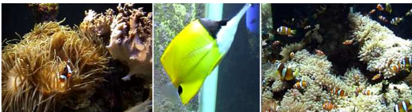
❶ Plantas donde en su interior se protegen otros peces más pequeños. ❷ Otro pez con unas formas casi rectangulares y su boca en forma de pico. ❸ Si observas el lecho de los acuarios, te ofrece la vida que poseen tanto en plantas como otros especímenes, francamente diminutos.

Además de poder ver evolucionar los peces en diversos hábitats en los mares del Mediterráneo y de los Tropicales, es interesante la cantidad de plantas y corales que los habitan.