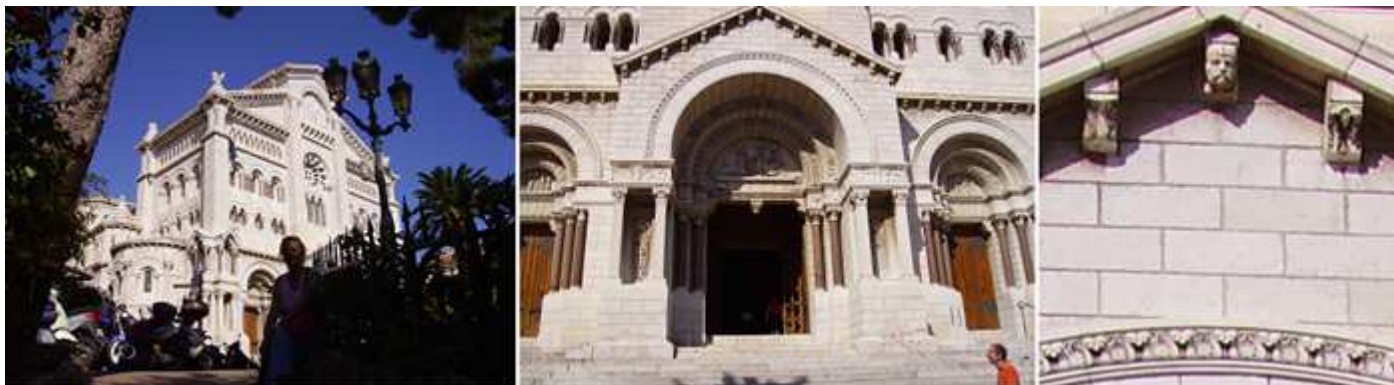
❶ La catedral frente a los jardines que tiene ante ella. ❷ La puerta principal adelantada a su fachada. ❸ Canecillos del alero de su portada.

Es un templo católico consagrado en 1875. Está edificada en el lugar donde se ubicaba la Iglesia de San Nicolás (construida en 1252 y fue destruida en 1874), primera iglesia del Principado, por lo que también se la conoce como Catedral de San Nicolás. Un año después se puso su primera piedra, fue consagrada en 1875 y se concluyó en 1903. Su fachada de estilo neo-románico bizantino y construida con piedra blanca de La Turbe.