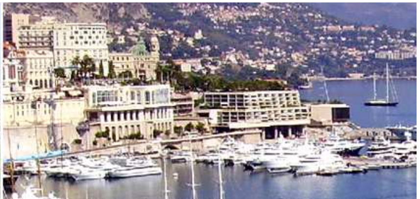
1 Vista de la dársena del Puerto de Hercules. 2 En los muelles de este puerto siempre hay una colección de lujosos yates atracados en el mismo.