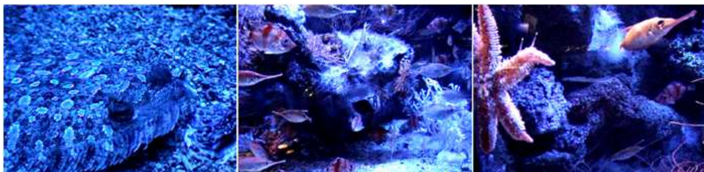
❶ Curioso pez y el mimetismo con el suelo. ❷ Varios especímenes marinos. ❸ Una estrella de mar nadando (no siempre las vemos).

Y nos adentramos en él, con la previsión que estaremos unas 2 horas, que se prolongaron con creces. Iniciamos por el Acuario para recorrer, luego el resto de plantas, por lo que bajamos al nivel -1 donde nos encontramos... La laguna, a los tiburones en el paso el arrecife a tamaño natural, una multitud de peces coloreados bordea a lo largo de los corales ascendidos al acuario.