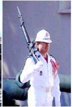
1 Atraques en el puerto de Fontvieille. 2 Otro rincón de este puerto desde la terraza del Palacio. 3 Uno de los integrantes de la guardia del Palacio.