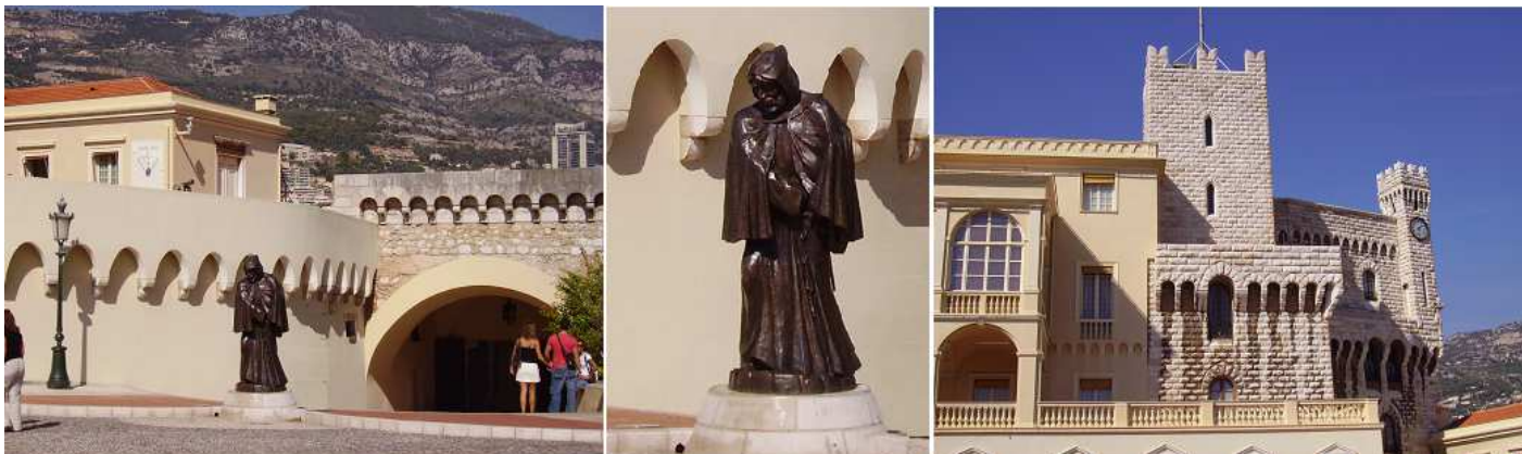
1 Entrada a la explanada del palacio. 2 m. 3 Parte derecha del palacio con la torre Santa María, reconstruida por Carlos III y la del reloj, esta parte se asemeja a una fortaleza medieval.

Una vez en la explanada que no es de unas dimensiones muy grandes, eso sí estaba con grandes grupos de turistas por las tiendas, observamos el cambio de guardia, pero llegamos justo a tiempo cuando se retiraban.