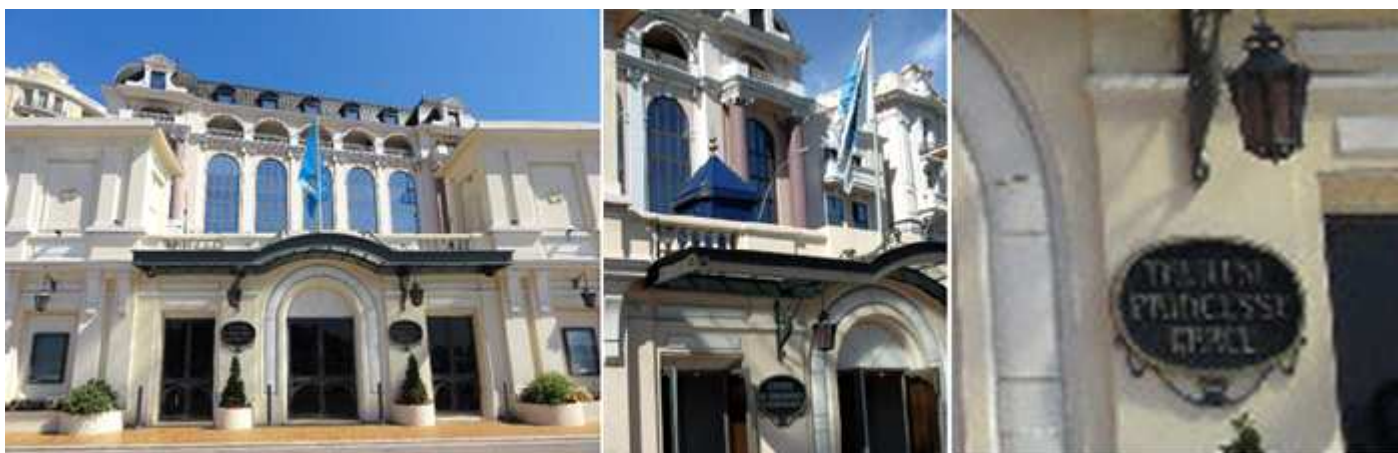
1 Fachada modernista del Teatro. 2 Este nuevo teatro lo inauguro el príncipe Raniero III en 1981. 3 Princesa Grace de Mónaco estaba profundamente comprometido a ayudar a los jóvenes aspirantes a artistas.

La construcción del teatro se inició bajo los auspicios de la Société des Bains de Mer en 1930 para construir un teatro y un cine en el Principado de Mónaco. La obra fue encargada al arquitecto François-Joseph Bosio.