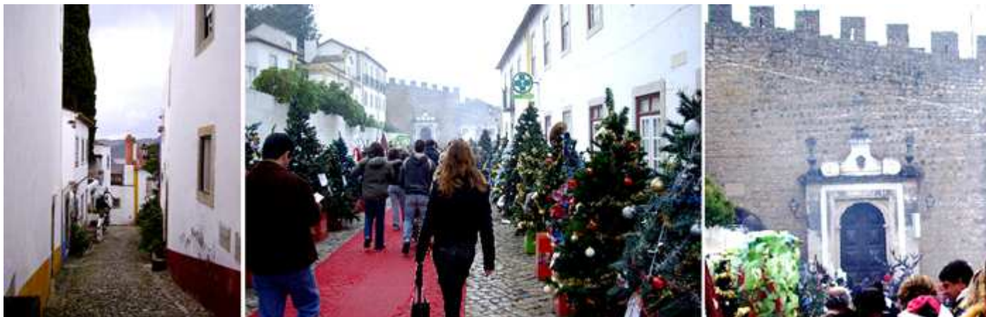
❶ La mayoría son calles estrechas. ❷ Bella estampa de las calles engalanadas con los pinos de Navidad. ❸ Una de las puertas de la muralla.

La villa medieval de Óbidos tiene innumerables puntos de interés por lo que requiere una visita prolongada.