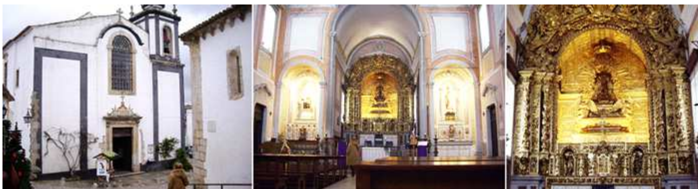
❶ Sencilla fachada con puerta adintelada. ❷ Cabecera con dos altares laterales. ❸ Altar mayor de la iglesia de San Pedro

La Igreja de São Pedro se encuentra situada en el Largo de São Pedro. Sus orígenes datan de la Edad Media pero fue completamente destruida a consecuencia del terremoto sufrido en el año 1755, conservándose sólo del primitivo edificio el altar mayor en talla dorada y la torre principal