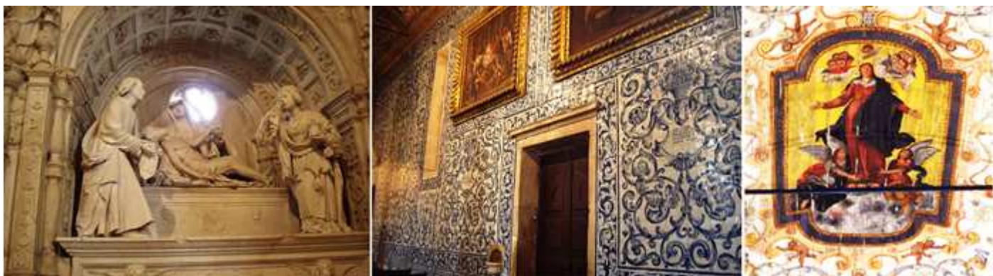
❸ A la izquierda del altar mayor sepulcro renacentista de D. João de Noronha, que fue alcalde mayor de Óbidos en el siglo XVI muerto en el año 1525, acompañado por su esposa, Isabel de Sousa. Sobre la autoría de la Piedad que adorna el conjunto, existen diversas versiones, pues unos lo atribuyen al taller de Jean de Rouen, artista de la escuela de Coimbra, y, otros, afirman que se debe al cincel de Nicolás de Chanterène, ejecutado entre los años 1526 y 1528. ❹ Murales de azulejos y diversos cuadros entre los que se encuentran de pintores Baltasar Gómez Figueira, y las obras de la Josefa de Óbidos. ❺ Pintura de la Virgen en la parte central de la bóveda de la nave central.

De ésta última, una de las pocas féminas cuya obra ha sido reconocida por los especialistas en historia del arte, es el retablo de la capilla lateral sita enfrente del enterramiento realizado por Chanterène. La artista empezó haciendo grabados y miniaturas, adquiriendo un notable dominio del detalle que plasmó, después, en sus obras religiosas de tamaño natural. Por su parte, los ocho lienzos del retablo son obra de Joao da Costa, del siglo XVII, que representan diversas escenas de la vida de María.