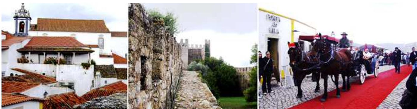
1 Un mirador y detrás la Iglesia de San Pedro. 2 m. 3 Puerta de la Villa y Puesto de Información y Turismo. A lo largo del año en Óbidos se suceden algunas actuaciones que animan sus calles.