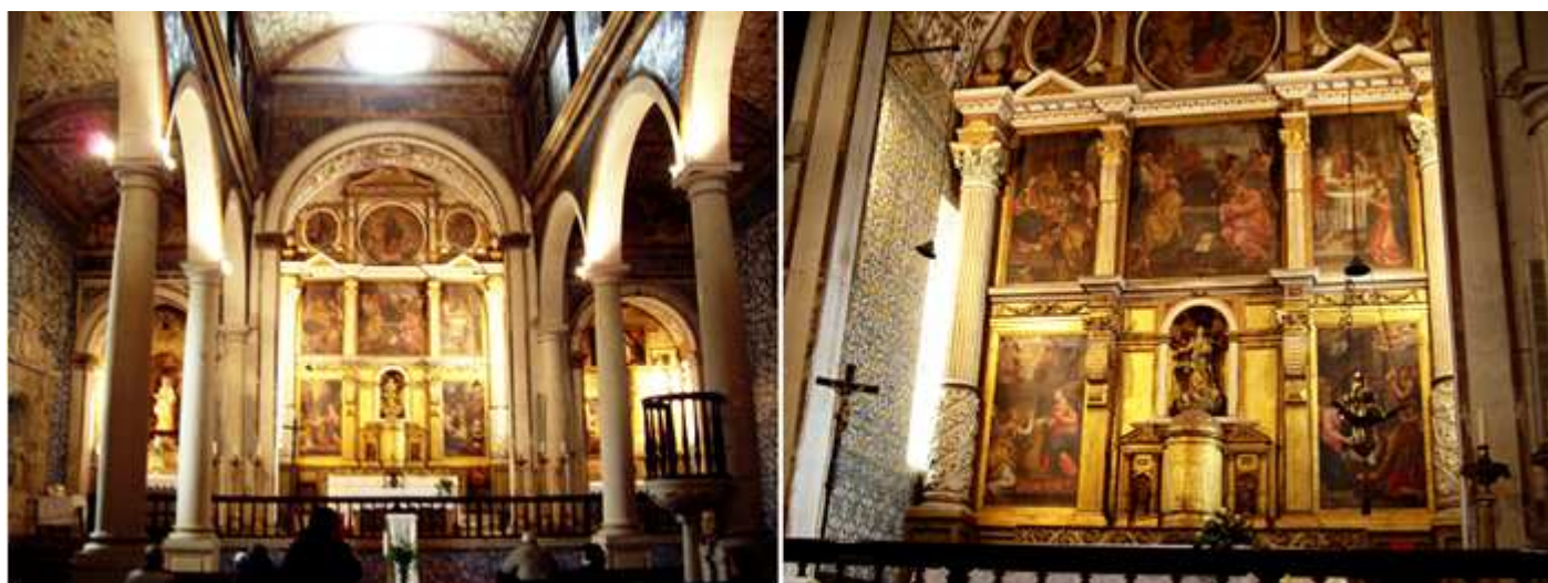
❶ Interior del templo con tres naves separadas por arcos de medio punto con columnas dóricas. ❷ Posee su altar Mayor un retablo de tres calles y tres pisos con ocho lienzos del S, XVII atribuidos a João da Costa.

Se trata de un edificio que, en sus inicios, fue templo visigótico; luego, mezquita árabe y, después de la reconquista, fue consagrada a la fe cristiana. Sus muros contemplaron la boda de Alfonso V con su prima Isabel, celebrada en 1444 a las tiernas edades de diez y doce años, respectivamente.