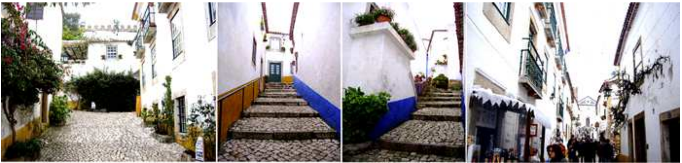
❶ Rincones con vegetación, ❷ - ❸ Diferentes calles empedradas y con escalones. ❹ Las principales calles están muy animadas.

Esta calle empedrada (como todas) nos llevará hasta la plaza de Santa María.