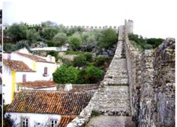
❶ Justo de bajo de esta foto se encuentra... la Puerta de Santa María. ❷ Vista del perímetro de las murallas, que puede recorrerse por su paseo de ronda.