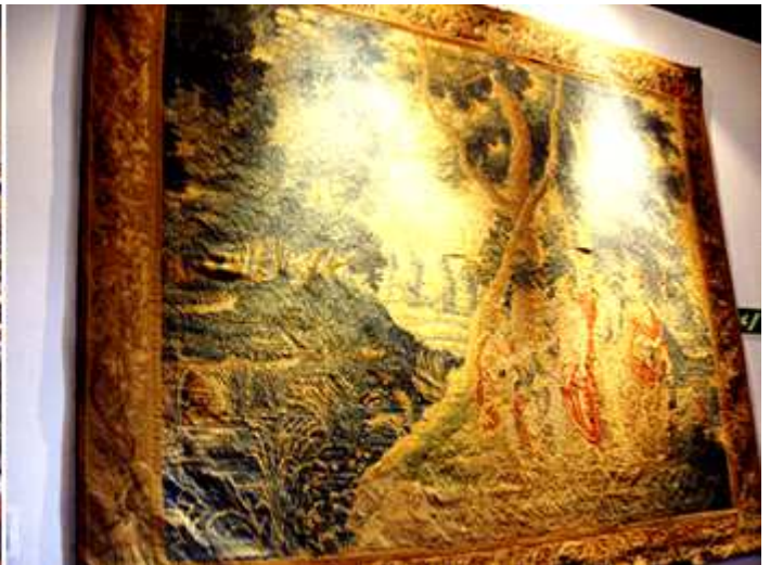
❷ Tapiz colgado en uno de los muros de una estancia.