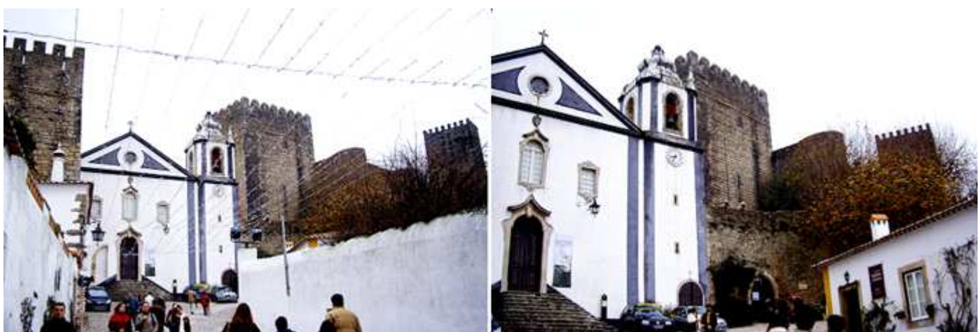
1 Tras la última rampa llegamos a la iglesia de Santiago. 2 Rodeada por las murallas y parte del castillo.

La Igreja de Santiago fue construida por D. Sancho I en el año 1186 y se encuentra situada en el Largo de Santiago, anexa al castillo. Es un templo de tres naves que se comunica con el interior del castillo, en sus orígenes fue utilizada por sus habitantes. En el año 1755 fue destruida completamente por el terremoto y años más tarde reconstruida.