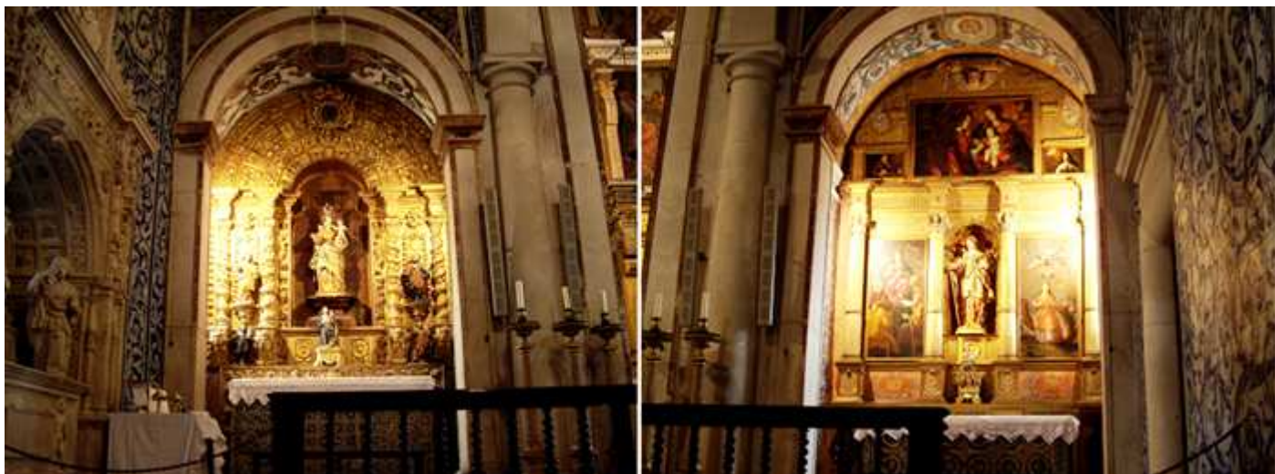
❶ Retablo en el ábside de la nave del Evangelio, capilla dedicada a San Blas. ❷ Y el que posee en la cabecera opuesta de la Epístola.

(1634-1684), más conocida como Josefa de Óvidos, pues pasó casi toda su vida residiendo en un convento de esta localidad.