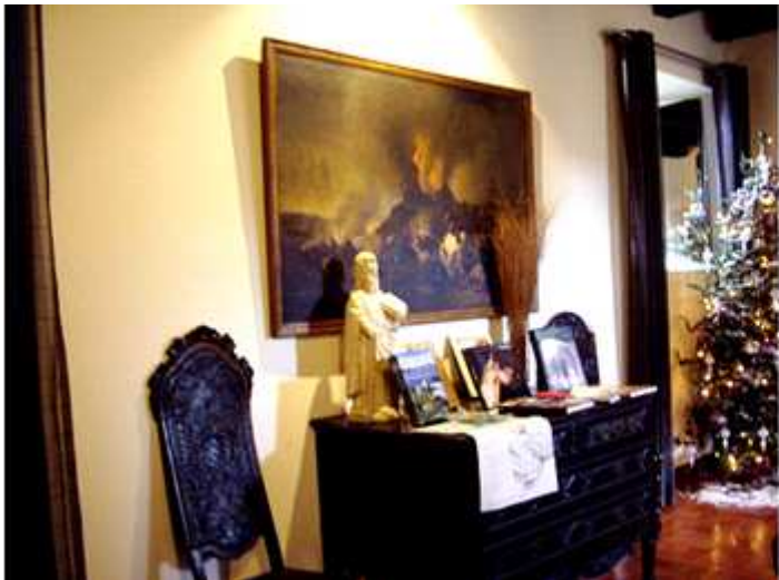
❶ A parador con distintos objetos.