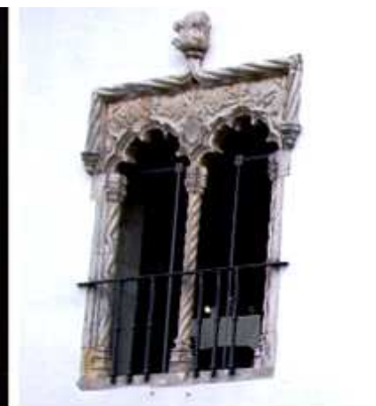
❸ Sala junto a la cafetería. ❹ Una de sus ventanas con una mesa de servicio. ❺ Y el detalle decorativo de sus ventanas ajimezadas.

Por lo que accedemos a recorrer la muralla, una vez que nos hemos asesorado de que hay una salida junto a la puerta de la villa.