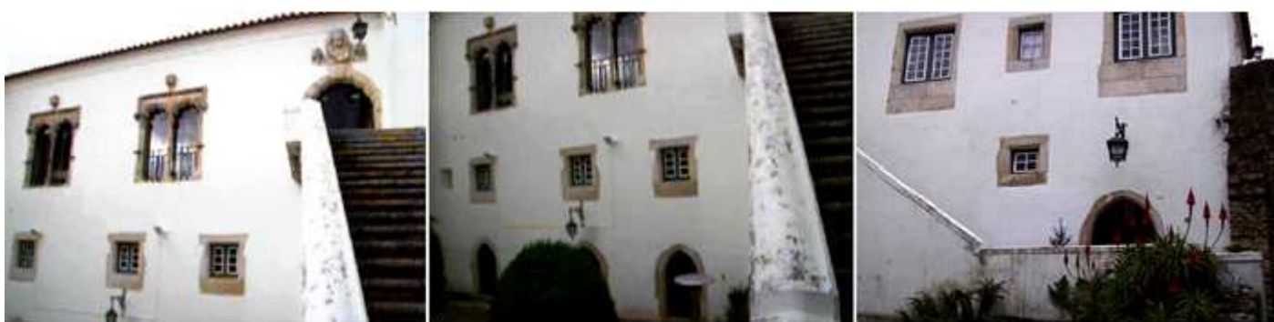
❶ Es un pequeño parador con seis habitaciones y dos suites. ❷ Posee tres plantas. ❸ Tiene acceso por este lado y por el tramo de escaleras.

Durante el reinado de D. Manuel I fue construido en el interior de las murallas del castillo un pazo que sufrió fuertes daños con el terremoto del año 1755, siendo en el siglo XX reconvertido en posada, considerada la primera del Estado albergada en un edificio histórico. Todo el conjunto está clasificado como Monumento Nacional.