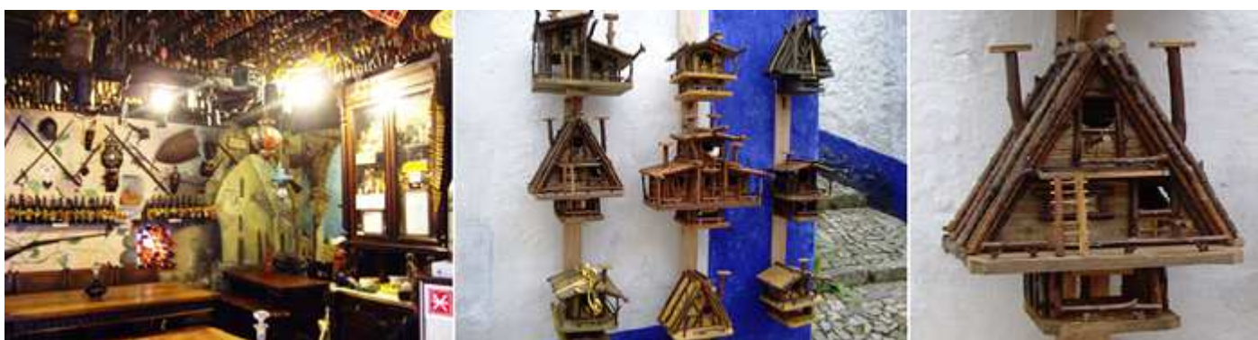
1 Y con todos los objetos imaginables, 2 Artística colección de jaulas para pájaros. 3 Realizadas con troncos de madera.