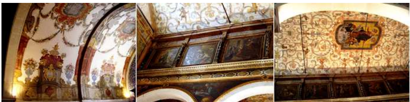
❻ Pinturas de las bóvedas. ❼ Y sobre los arcos de la nave central. ❽ Vista de techo de la nave central.

En la parte posterior de la iglesia, donde antes se alojaba el viejo ayuntamiento, está ubicado el Museo Municipal, hoy rehabilitado por la Fundación Gulbenkian. Dentro, se