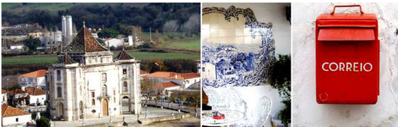
1 Original palacete a extramuros 2 Con estas últimas instantáneas, mientras esperamos el autobús para iniciar la vuelta a Lisboa... 3 Curioso buzón del s. XIX que iba en un carro de tracción animal... "Recibe cartas en cuanto está parado".....

La vuelta a Lisboa, el bus toma en seguida la autopista y de forma más rápida que la ida nos encontramos de nuevo en Campo Grande, para tomar el Metro y recorrer el casco antiguo.