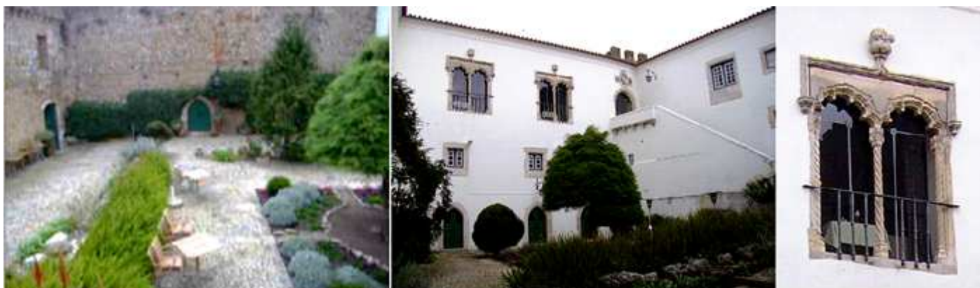
❶ Los jardines dentro del castillo. ❷ Laterales de la Pousada. ❸ Con sus ventanas geminadas de estilo manuelino.

Durante el reinado de D. Manuel I fue construido en el interior de las murallas del castillo un pazo que sufrió fuertes daños con el terremoto del año 1755, siendo en el siglo XX reconvertido en posada, considerada la primera del Estado albergada en un edificio histórico. Todo el conjunto está clasificado como Monumento Nacional.