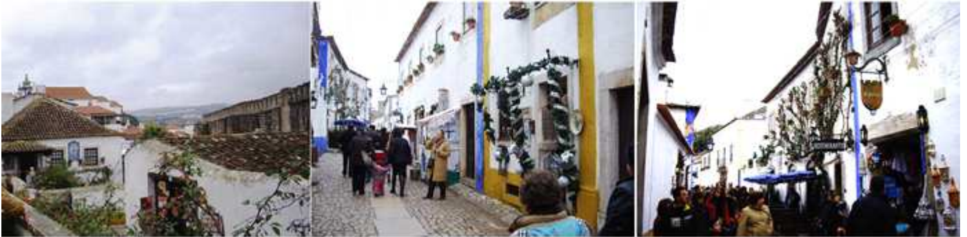
❶ Los edificios de una o dos plantas. ❷ La principal con los comercios. ❸ Y con turistas foráneos y de pueblos próximos.