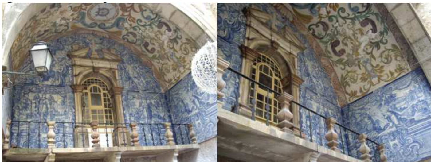
❶ Esta puerta fue mandada colocar por el rey D. João IV en agradecimiento a su protección. ❷ Considerada la entrada principal al recinto amurallado en que se encuentra toda la población de Óbidos, fue construida en el siglo XVII. Destacan los azulejos del siglo XVIII situados en la puerta y la capilla oratorio dedicada a Nuestra Señora de Piedad, patrona de la villa. Situada sobre la puerta se encuentra una inscripción que dice ' A Virgem Nossa Senhora foi concebida sem pecado original ',

Considerada la entrada principal al recinto amurallado en que se encuentra toda la población de Óbidos, fue construida en el S. XVII. Destacan los azulejos del S. XVIII situados en la puerta y la capilla oratorio dedicada a Nossa Senhora da Piedade, patrona de la villa. Situada sobre la puerta se encuentra una inscripción que dice ' A Virgem Nossa Senhora foi concebida sem pecado original ', mandada colocar por el Rey D. João IV en agradecimiento a su protección.