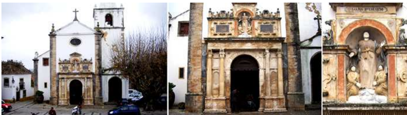
❶ Fachada con la torre adosada en el lado epistolar. ❷ Su portada con dobles columnas y sobre el entablamento un frontis con hornacina . ❸ Hornacina con la Virgen y a sus pies dos ángeles. En la parte superior tiene una inscripción: Santa María Rda. em 1890.

Matriz La Iglesia de Santa Maria, Matriz de Óbidos, es el templo principal de la población. Se encuentra situada en la Praça de Santa Maria. No se sabe con exactitud la fecha de su construcción, pero se cree que fue fundada en el período visigótico. Posteriormente fue transformada en mezquita en la ocupación árabe y dedicada al culto cristiano al ser reconquistada. Posee un bello portal manierista en el que destaca la imagen de Nossa Senhora da Assunção. Está clasificado como Monumento de Interés Público.