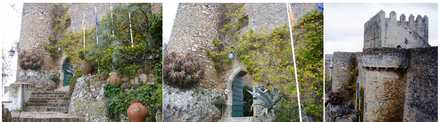
❶ Escalera de acceso al castillo ❷ Entrada entre dos cubos redondos ❸ Parte superior de espacio de su entrada. Dispone de un aljibe a los pies de la torre del homenaje.

La historia y los monumentos de esta fortaleza medieval la han convertido en un lugar de gran interés turístico. Hoy en día su principal recurso económico es el turismo seguido de la agricultura.