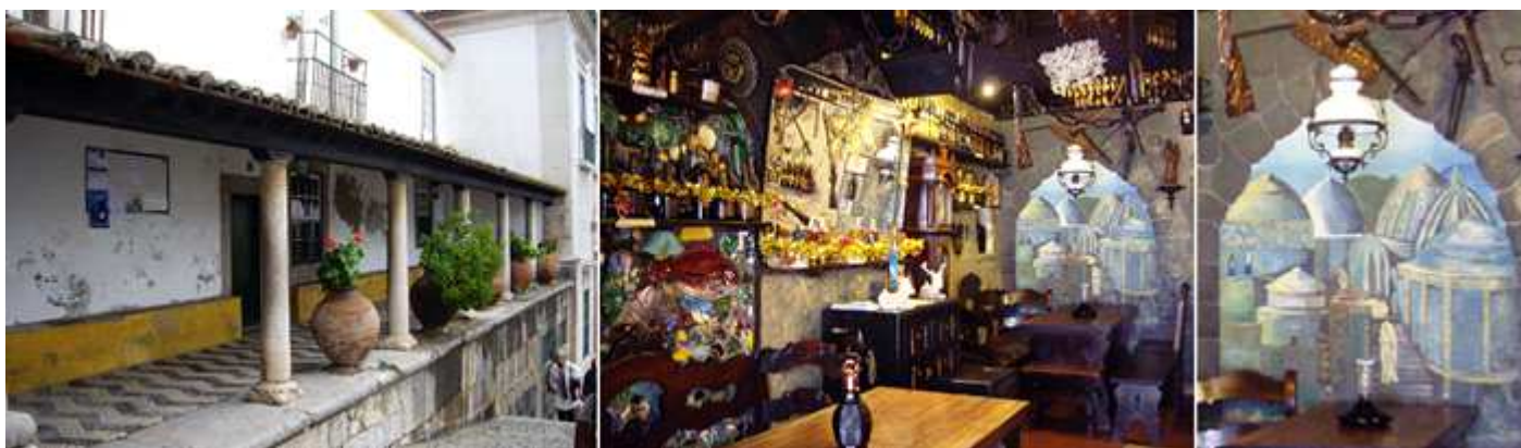
1 Continúamos en dirección de la iglesia de Santiago. 2 Taberna – tienda de antigüedades. 3 Muy bien ambientada.

encuentran restos romanos, árabes y medievales hallados en el término municipal, recuerdos de las batallas sostenidas contra las tropas de ocupación napoleónicas y abundantes obras de arte, entre ellas una buena muestra de las pinturas de Josefa de Óvidos.