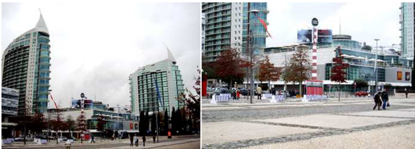
1 Torres de San Gabriel y Rafael. Y un centro comercial entre ellas. 2 Centro Comercial Vasco de Gama, con varias plantas y con un techo de cristal.

Tras acceder por la puerta del Sol una avenida recorre longitudinalmente el parque es la Alameda de los Océanos. Con la puerta del Mar al sur y en el lado opuesto la puerta del Norte.