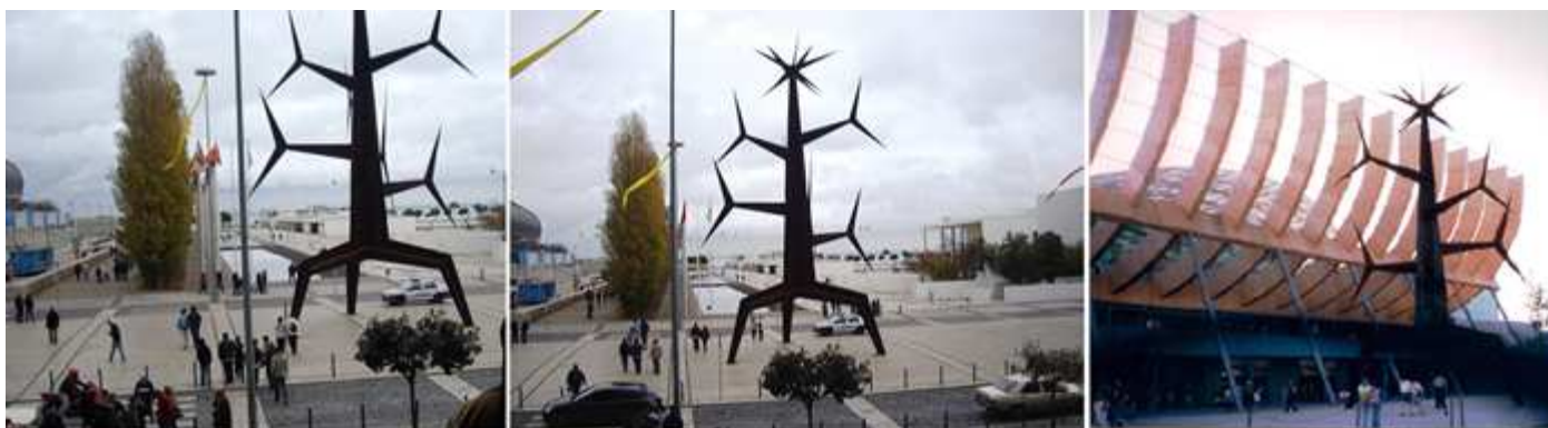
1 La salida del centro. 2 Con esta original escultura de un árbol esquemático. 3 A la izquierda se llega al Altice Arena y a la derecha al Pabellón de Portugal.

Hay que reconocer, que me costó identificar lo que hace años había de pabellones de la Expo, y como están “los mismos” ahora reutilizados.