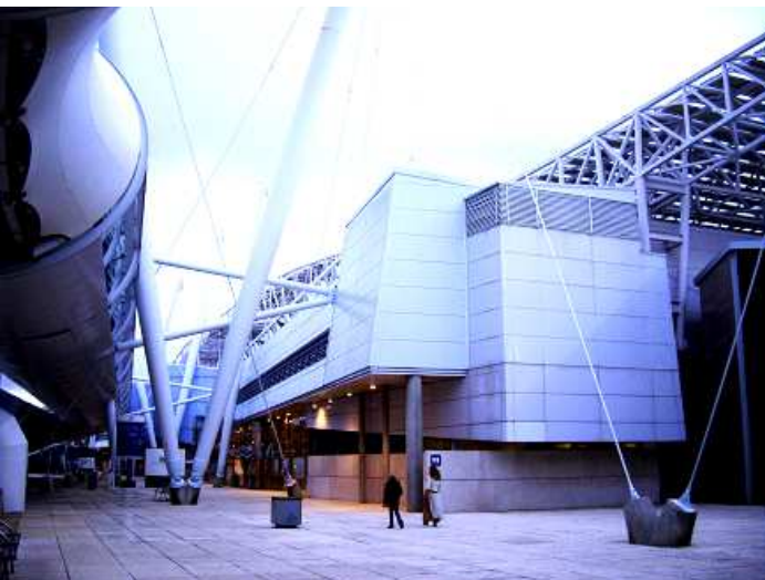
1 A la derecha los pabellones de la feria.

Nos vamos desplazando hacia el norte por la Alameda de los Océanos, con los pabellones que ahora se usan para ferias, y que paralelo a ellos está la original pasarela cubierta.