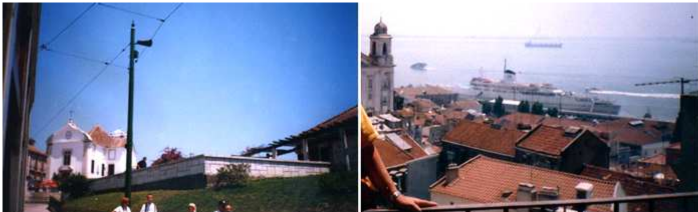
1 Mirador de Santa Lucia, es una plataforma aterrazada con un entramado de columnas con buganvillas con vistas al estuario. 2 Unos metros más arriba de la calle está el Mirador das Portas do Sol. A los pies la ladera con el barrio de Alfama.

Terminamos nuestra visita y tras comer regresamos al centro tomando el tren hasta Santa Apolinia en unos 7´y desde esta estación el metro a Terreiro do Paço con la línea azul para andar 120m hasta la plaza de Comercio y aquí tomando el tranvía 28, y bajando en Miradouro Sta. Luzia.