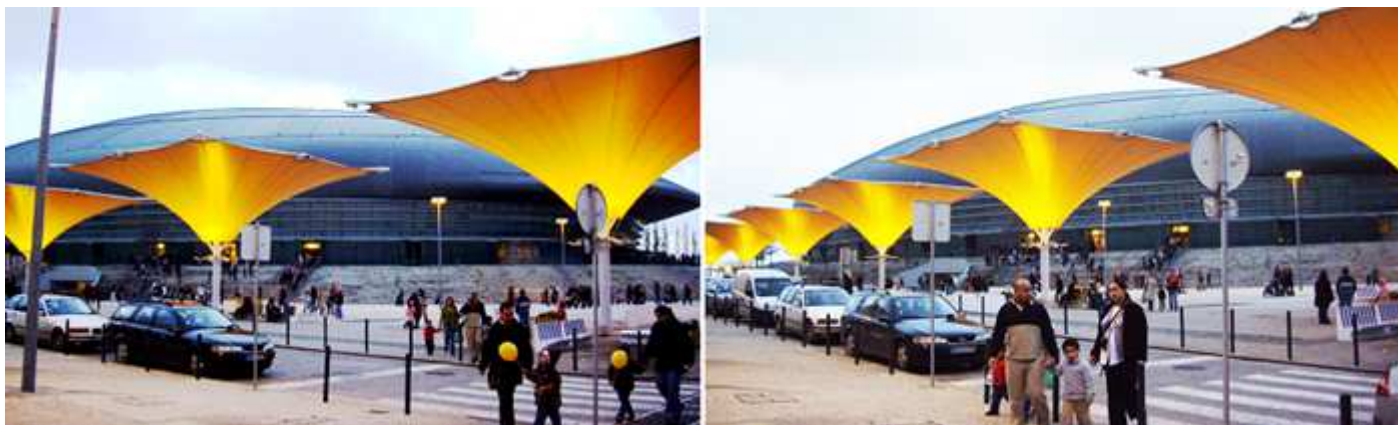
❶ Espacio ante el Altice Arena en la Rua de Bojador. ❷ Con estas originales palmeras de lona que dan sombra de día y de noche proyectan la iluminación.

Entre este edificio y el Oceanográfico hay una singular obra que es el Pabellón que uso Portugal