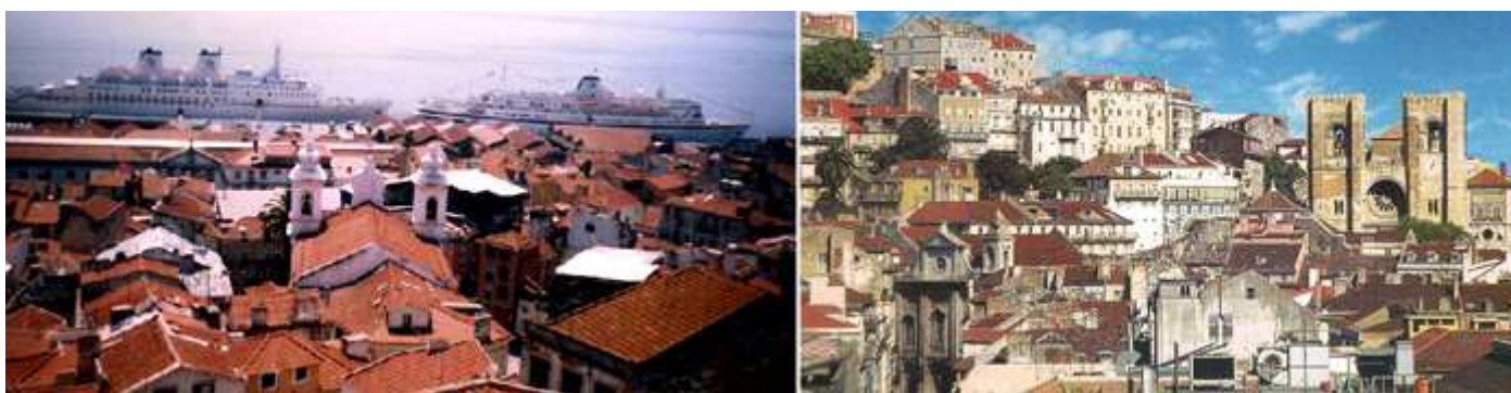
1 Otra vista desde el mirador Portas do Sol. 2 Estampa del barrio de Alfama junto a la Catedral.

Y continuar a la Rua de Santa Cruz do Castelo, s/n