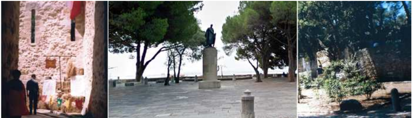
1 Un recodo dentro del mismo. 2 Explanada primera con el monumento con la estatua de Alfonso I. 3 Dentro del mismo hay varias zonas ajardinadas. Y bastante vegetación con especies autóctonas como: alcornoques, acebuches, algarrobos, madroños, pinos piñoneros...

Es castillo tenía el cometido de que en caso de ataque albergara a los habitantes de la Alcazaba. Fue conquistado a mediados del S. XII por Alfonso Henríquez, primer rey de Portugal, que duro tres meses y conto con la ayuda de los cruzados.