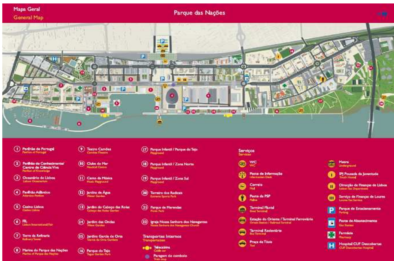
1 Mapa con lo que fue el escenario de la Expo.

En la parte sur está la Marina con el Oceanográfico y en la parte norte el Telecabina y la Torre Vasco de Gama.