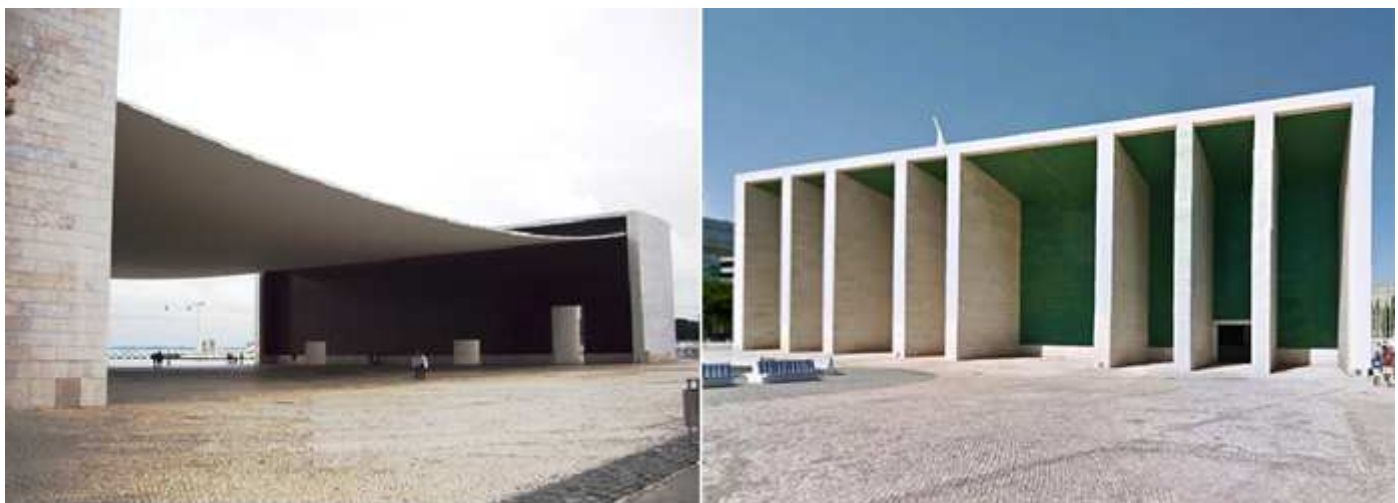
❶ Pabellón de Portugal, con una cubierta de cemento sin más pilares que los edificios de los lados. ❷ Uno de sus laterales.