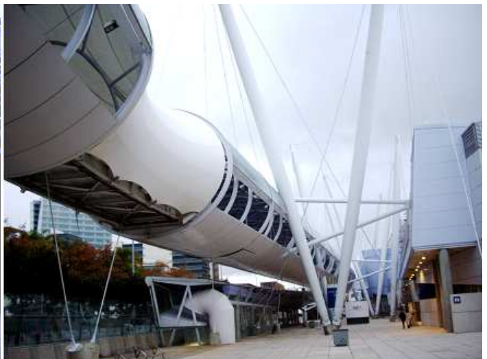
2 Y la pasarela con una estructura oval y que está cubierta.