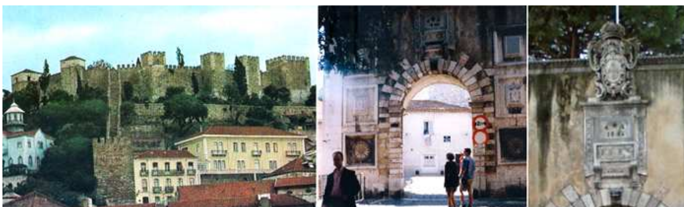
1 Panorámica desde la ciudad, quizás las estampa más bella. 2 Puerta de acceso. 3 Sobre la clave el escudo y la fecha de 1846.

Es una construcción a mediados del S. XI de la época islámica, en la zona más alta de esta colina. En el lado oeste un muro cortina descende hacia la ciudad con la torre Couraça.