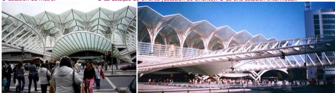
1 Fue proyectada por el arquitecto e ingeniero español Santiago Calatrava. 2 La salida de la estación a la Avenida del Pacífico.