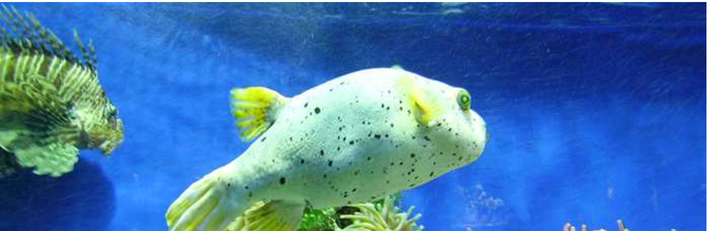
📍 Instantánea de uno de los tanques.

En sus instalaciones cuenta con un total de 16.000 ejemplares de 450 especies marinas, repartidas entre sus diferentes espacios. . 🕒 19€ Niños y +65 13€. 15%dtº con 🇪🇺 Funciona de 10 a 19/20h.