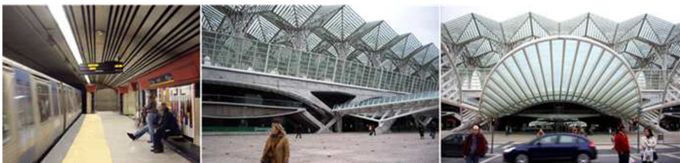
1 Estación de metro. 2 La Estação do Oriente (Estación de Oriente). 3 Es una estación Intermodal.

Además, de el interés de ver los edificios más singulares, uno de los aspecto que más valoramos, es el resultado posterior de haber sido la sede de una exposición Universal, y como han aprovechado, sus infraestructuras, para su posterior uso.