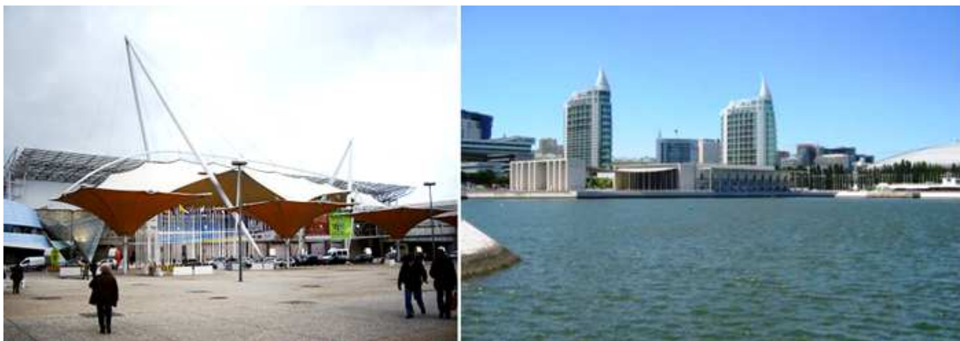
❶ Dejamos los espacios colindantes con la feria. ❷ Desde la Marina las Torres de San Gabriel y Rafael..