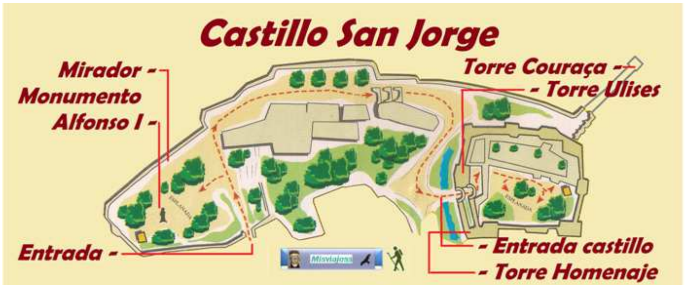
❶ Croquis del castillo de San Jorge, redibujando uno de un folleto.

El bajar del castillo se puede volver a tomar el tranvía, pero es interesante recorrer las calles de forma descendente del barrio de la Alfama, son edificaciones la mayoría antiguas, esta zona en la que los romanos construyeron su teatro (ruinas en la rua Saudade) y posteriormente habitado por los visigodos. Al llegar a la Catedral, al lado está la iglesia de San Antonio al que le tienen gran devoción los lisboetas.