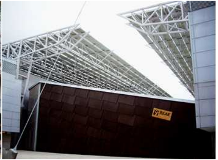
1 Original fuente que es un volcán de agua, que cada cierto tiempo... explota propiciando una cascada. 2 Instalaciones de la Feria Internacional.