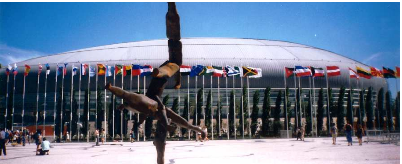
📍 Es el mayor pabellón de Portugal, con capacidad para 20.000 personas.

Dispone de de cuatro tanques más el central para albergar los hábitat de la Antártida, el Océano Índico, el Atlántico Norte y el Pacífico. Uno de los edificios que más llama la atención es El Pabellón Atlántico (Pavilhão Atlântico)