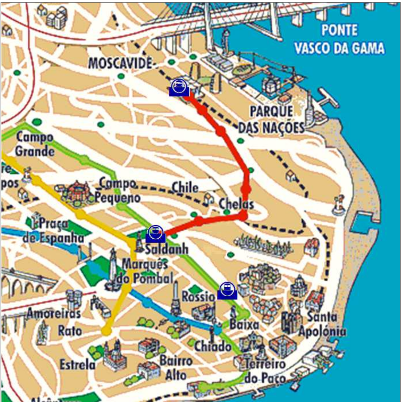
Croquis itinerario de las líneas de metro al Parque de las naciones.

Hoy el recorrido es al Parque de las Naciones donde en el año 1998 se celebró la Exposición Universal y por la tarde el Castillo de San Jorge y bajar por la Alfama uno de los barrios más tradicionales de Lisboa a la plaza del Comercio. http://misviajess.wordpress.com/