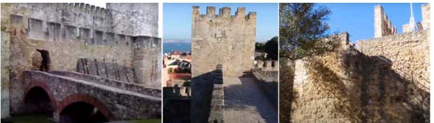
1 Entrada al castillo. 2 Una de sus torre en un ángulo. 3 Subida desde uno de los patios a recorrer el adarve.

Los lados norte y oeste de sus muros están protegidos por la pendiente que existe en la ladera. La entrada se realiza por un puente de dos arcos que atraviesan el foso.