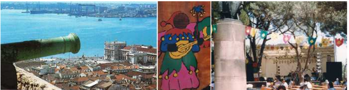
1 Uno de los miradores con un cañón. 2 Dentro del mismo se realizan algunas fiestas medievales. 3 Espacio junto al monumento de Alfonso I.

A los largo de sus lienzos se conservan 11 torres con algunos fosos y garitas. Torres de: del Homenaje, del Archivo, del Palacio, de la Cisterna y la Torre de San Lorenzo, que bordean con sus murallas almenadas la ciudadela.