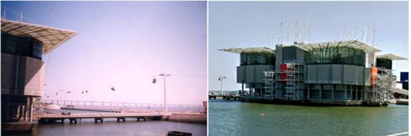
📍 Vista de la Marina junto al Oceanográfico. 📍 El Oceanario (nombre oficial) de Lisboa se tiene como el más grande de Europa.

Esta colosal obra es del arquitecto estadounidense Peter Chermayeff y es una estructura como si estuviera flotando en el puerto.