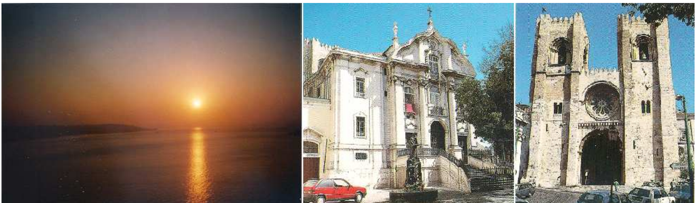
❶ Puesta de sol sobre el estuario. ❷ Iglesia de San Antonio patrón de Lisboa, en su cripta fue su lugar de nacimiento. ❸ Y la fachada de la Sé de Lisboa.

El bajar del castillo se puede volver a tomar el tranvía, pero es interesante recorrer las calles de forma descendente del barrio de la Alfama, son edificaciones la mayoría antiguas, esta zona en la que los romanos construyeron su teatro (ruinas en la rua Saudade) y posteriormente habitado por los visigodos. Al llegar a la Catedral, al lado está la iglesia de San Antonio al que le tienen gran devoción los lisboetas.