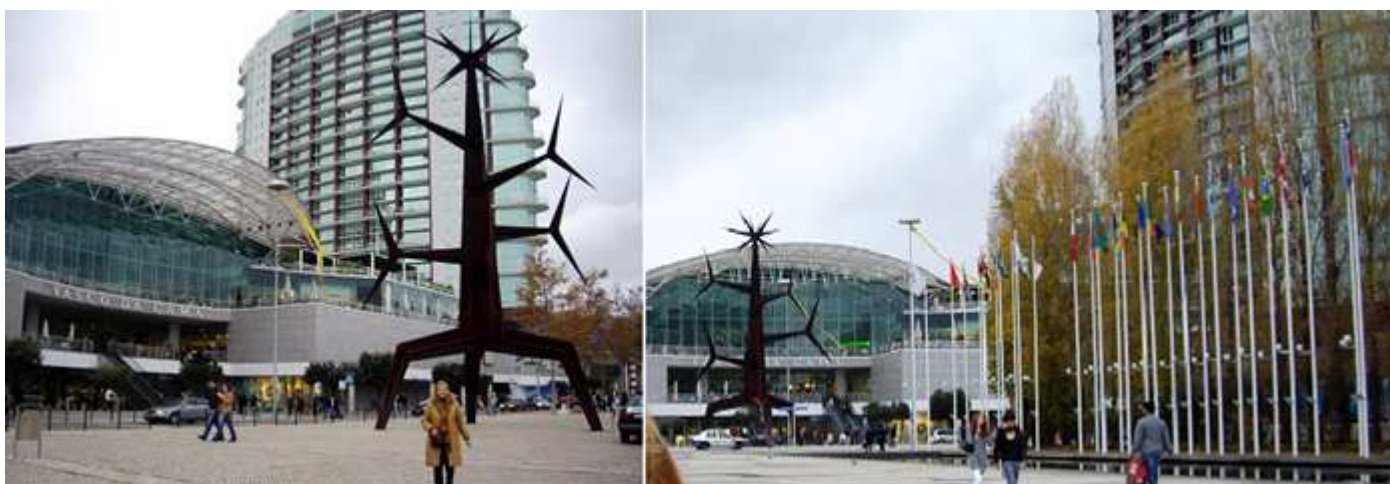
1 La parte opuesta del centro comercial.

Lo que era el recinto de la Expo 98 se ha convertido en un gran complejo de ocio, con un centro comercial, una variedad de atracciones, auditorios, bares, restaurantes y una pasarela por el río Tajo. La Torre Vasco da Gama (el edificio emblemático del recinto y el más alto de Lisboa) tiene una plataforma de observación y un restaurante. El Oceanográfico (uno de los acuarios mayores de Europa) con una gran cantidad de peces y anfibios en sus enormes estanques. El Pabellón Atlántico diseñado para albergar actuaciones es un estupendo lugar para celebrar conciertos y otros actos.