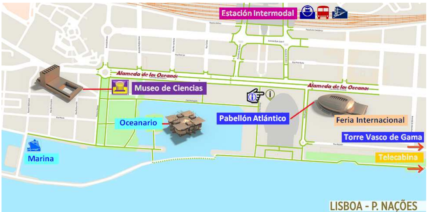
1 Situación actual, empleando un plano de la web de Turismo.

Nos vamos desplazando hacia el norte por la Alameda de los Océanos, con los pabellones que ahora se usan para ferias, y que paralelo a ellos está la original pasarela cubierta.