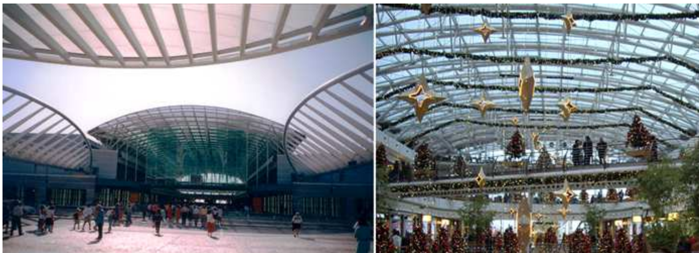
1 Justo enfrente de la estación esta un grandioso centro comercial. 2 Interior de uno de los centros comerciales.

La Estação do Oriente es una gran estación de tren, autobuses y metro situada en el distrito de Parque das Nações de Lisboa.