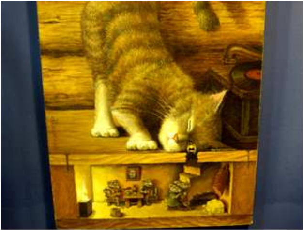
❶ La curiosidad por sus amigos los ratones.

En este pabellón además de un conjunto de 7 bañeras clásicas metálicas con un maniquí dentro de una de ellas estos originales cuadros de gatos.