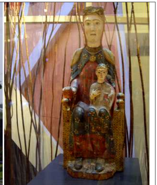
El pabellón Puente y la talla románica de la Virgen de Iguacel (Huesca) en madera policromada de principios del S. XII, pabellón de Aragón.