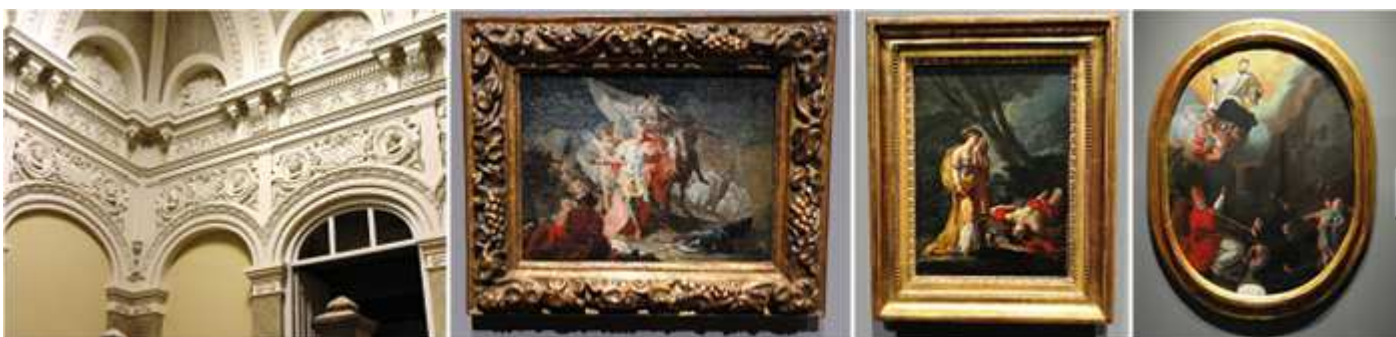
1 El recorrido cronológico de la misma nos ayudara a comprender su evolución artística. 2 Anibal 1771. 3 Venus y Adonis 1771. 4 Consagración de San Luis Gonzaga como patrono de la juventud 1763.

En las salas de primer piso, veremos la amplia muestra de Goya que ofrece este museo tanto pictórica como de las series de los grabados.