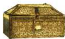
[4] Museo de Burgos