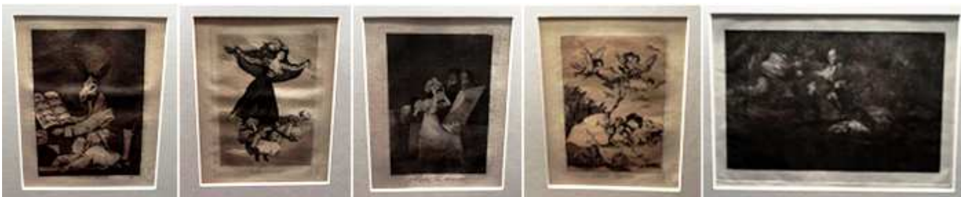
Los Caprichos: 1 Hasta el abuelo. 2 Volaverunt. 3 Hasta la muerte. 4 Todos caerán. Los Disparates: 5 Disparate fúnebre.

Otro museo es el Camón Aznar en un palacio renacentista para continuar admirando la obra de Goya... Puedes tener más información en: https://misviajess.wordpress.com/viajes-con-encanto/viaje-a-zaragoza/