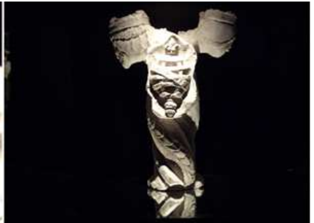
❶ La esfera armilar es un instrumento astronómico utilizado en la Antigüedad y en la Edad Media para la determinación de la posición de los cuerpos celestes, y nos remite a la época de los descubrimientos marítimos portugueses del S. XV, tan asociados a las observaciones astronómicas. ❷ A ambos lados posee una cabeza de varón y de mujer los reyes de Portugal. ❸ La pieza expuesta.

En otro pabellón hay una muestra de litografías todas relacionadas con el agua.