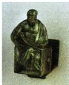
[2] Museo de Zamora Junta de Castilla y León