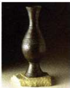
[3] Museo de León