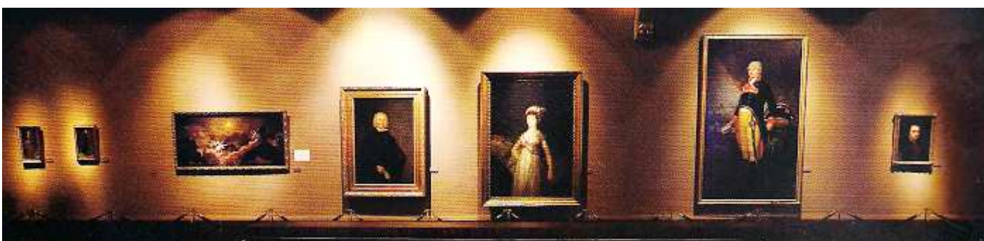
Salón Dorado con las obras de Francisco de Goya 1 La Gloria o Adoración del nombre de Dios 1771/1772, 2 Retrato de José Cistue 1788, 3 Retrato de la Reina María Luisa de Parma, 4 Retrato de Félix de Azara 1805, 5 También se encuentran otras 5 obras propiedad de la R. Sociedad Económica Aragonesa de Amigos del País, entre las que se encuentran el Esopo el fabulador 1788 y Menipo, el filósofo de 1788.

Otro museo es el Camón Aznar en un palacio renacentista para continuar admirando la obra de Goya... Puedes tener más información en: https://misviajess.wordpress.com/viajes-con-encanto/viaje-a-zaragoza/