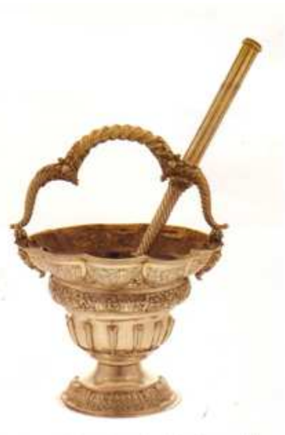
❶ El Bautismo de Cristo por el Greco. ❷ Parte central del mismo. ❸ Acetre e hisopo. Basílica de Nuestra Señora del Pilar. Zaragoza.

El Agua es un tema de vital importancia para la Iglesia, y con frecuencia aparece como símbolo tanto de la Palabra de Dios como de la propia vida eclesial.