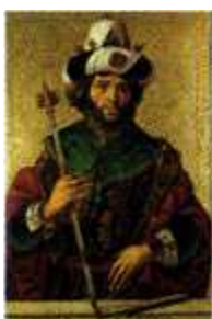
[6] Iglesia parroquial de Santa Eulalia de Paredes de Nava (Palencia)

1 Cráneo y mandíbula de Homo Heidelbergensis , de Altapuerca (Burgos) 2 Aplique de Carro con figura de Filósofo S. III-IV, del yacimiento de Cañizo de Campos (Zamora) 3 Jarro litúrgico de Arvildo, S. IX de la España visigoda. 4 Arqueta ejemplar inestimable originalmente realizado por Muhammad ibn Zayan en madera y marfil en 1026 y reformada en el Monasterio de Silos (Burgos) con esmaltes entre 1140 y 1150. 5 Pila bautismal troncocónica románica, Con-catedral de San Pedro de Soria, S. XII.