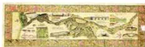
[10] Ministerio de Fomento Archivo General

1 Rey David de Pedro Berruguete, hacia 1450. Iglesia Santa Eulalia de Paredes de Nava (Palencia). 2 Cáliz 1490-1520 Iglesia de Villarejo del Valle (Ávila). 3 Virgen con el Niño del antiguo Hospital de Esgueva en Valladolid. 4 Jarra de dos asas Real Fábrica de Cristales (Segovia). 5 Plano del Proyecto de los Canales de Castilla de 1752. Imágenes del folleto.