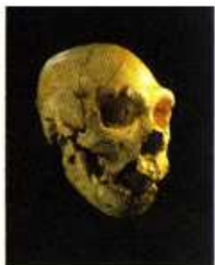
[1] Original: Junta de Castilla y León

25 piezas de arte contemporáneo procedentes del Musac se alternan con 17 piezas representativas del patrimonio histórico de Castilla y León.