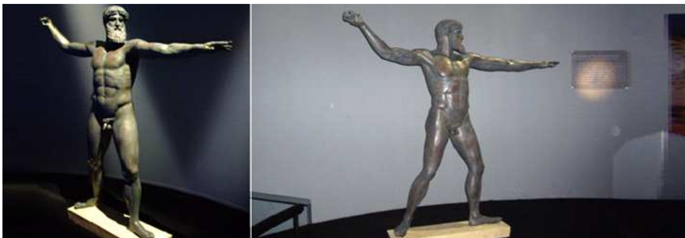
❶ Apolo, también llamado Febo Apolo. ❷ En la mitología Griega, Apolo era el hijo de Zeus (Júpiter) y Leto (Letona).

En el pabellón de Grecia, un soberbio Apolo.