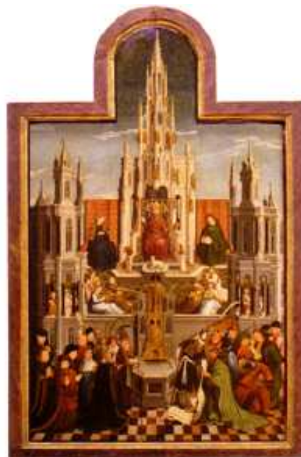
❶ Venida de la Virgen del Pilar, Goya, Colección particular. Zaragoza. ❷ Tapiz del Credo, S. XV. Museos Vaticanos. Ciudad del Vaticano. ❸ Fuente de la Gracia, copia de Van Eyck. Catedral de Segovia.