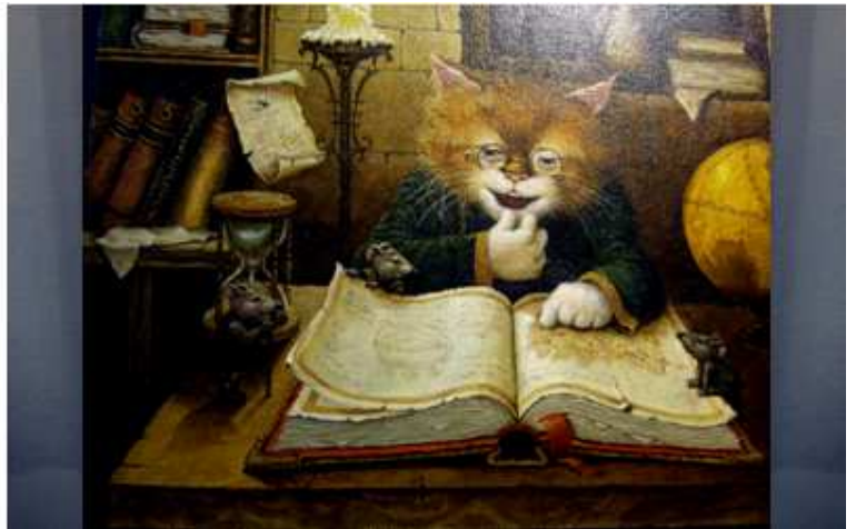
❷ O habido por la lectura. Son de gran realismo.