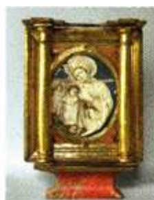
[8] Museo de Valladolid