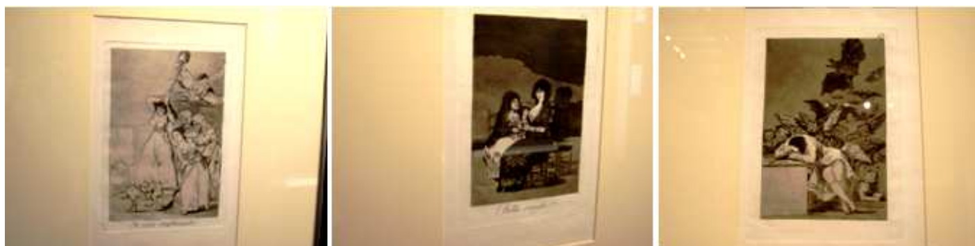
❶ Ya van desplumados.

La obra de los grabados es muy extensa Goya los realizó Copias de Velázquez (1778), Los Caprichos (1799), Desastres de la guerra (1810-1815), Tauromaquia (1816), Disparates (1816-1820) y Toros de Burdeos (1824-1825).