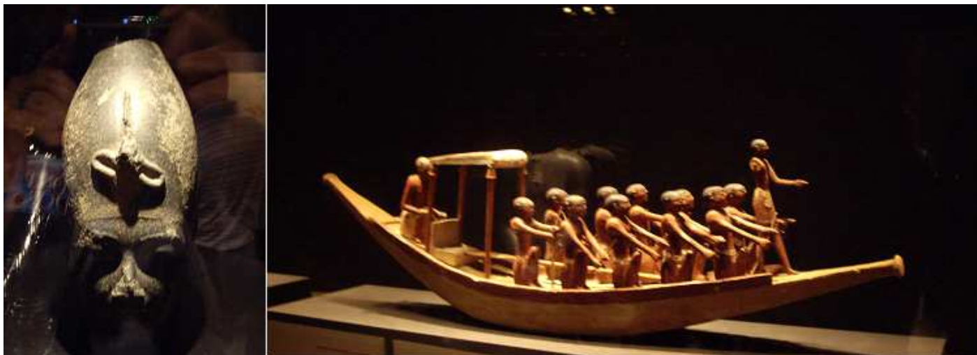
❶ Escultura en el pabellón de Egipto. ❷ Maqueta de una embarcación egipcia, para el traslado a más allá en figuras de barro. En este pabellón no dejaban hacer fotos.