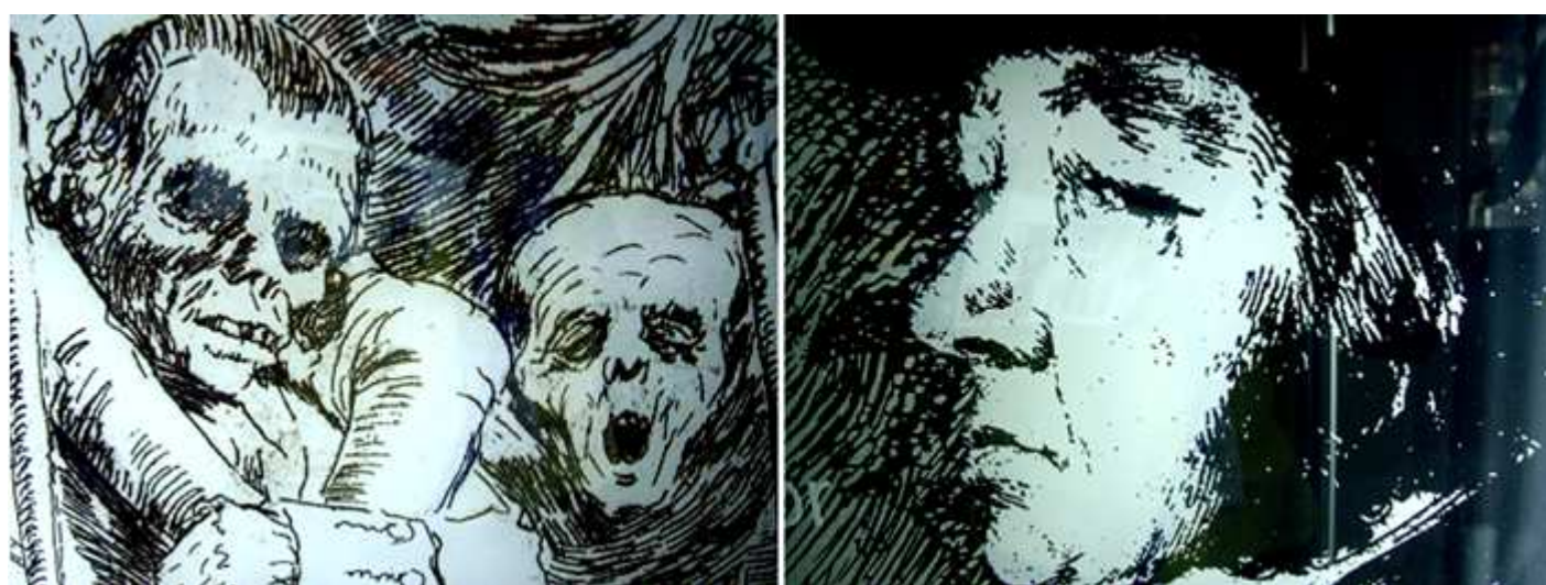
❶ Francisco de Goya como grabador, caracterizada por su gran innovación técnica, estilística y temática. En ellos expreso dejando libre sus pensamientos y sentimiento de la época que vivió. ❷ Autorretrato de Francisco de Goya y Lucientes.

La obra de los grabados es muy extensa Goya los realizó Copias de Velázquez (1778), Los Caprichos (1799), Desastres de la guerra (1810-1815), Tauromaquia (1816), Disparates (1816-1820) y Toros de Burdeos (1824-1825).