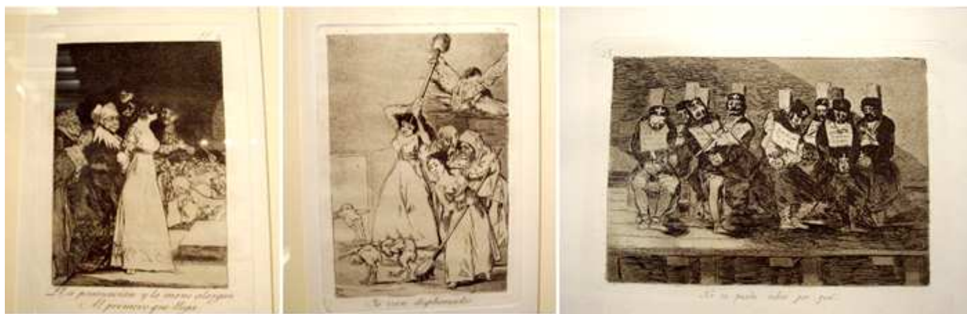
Representación de los grabados de Goya que posee el Museo de Grabado Contemporáneo Goya – Fuendetodos. ❶ El sí pronuncia y la mano alargan, Al primero que llega. ❷ Ya van desplumados. ❸ No se puede saber por qué.

En primer lugar, el universal pintor de Fuendetodos Francisco de Goya y Lucientes.