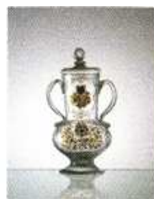
[9] Fábrica: Centro Nacional de Vidrio Real Fábrica de Cristales (Segovia)