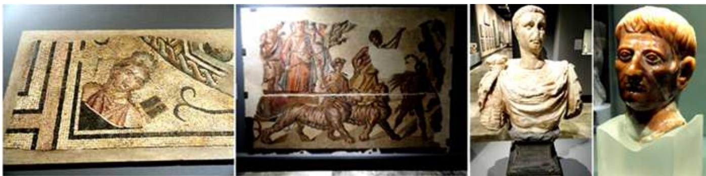
1 Mosaicos teselados: La musa de Clio de la casa de Orfeo S.II d.C. 2 Triunfo de Baco S.II d.C. 3 Claudio 50-52 d. C. 4 Augusto 90-103 d. C.

Ciudad que cuenta con numerosos museos repartidos por la misma y que por sus contenidos merecen una visita, señalemos el Museo Provincial en la plaza de los Sitios, con salas dedicadas a periodo romano y a Francisco de Goya.