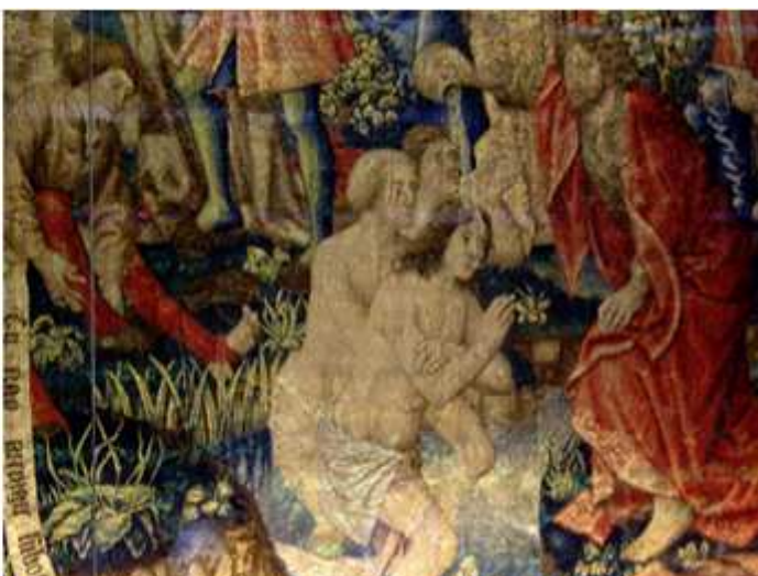
① Este tapiz es uno de la serie de San Juan Bautista: El Bautista en el Jordán, San Juan Bautista ante Herodes. Su prisión. Y en que presenciamos el Bautismo de Jesucristo. ② Escena central Bautizando a Jesús en el Jordán.