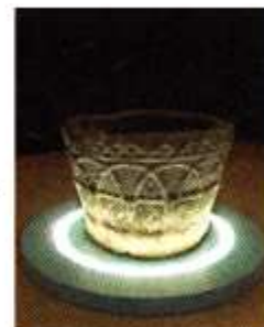
[5] Concatedral de San Pedro (Soria)

1 Cráneo y mandíbula de Homo Heidelbergensis , de Altapuerca (Burgos) 2 Aplique de Carro con figura de Filósofo S. III-IV, del yacimiento de Cañizo de Campos (Zamora) 3 Jarro litúrgico de Arvildo, S. IX de la España visigoda. 4 Arqueta ejemplar inestimable originalmente realizado por Muhammad ibn Zayan en madera y marfil en 1026 y reformada en el Monasterio de Silos (Burgos) con esmaltes entre 1140 y 1150. 5 Pila bautismal troncocónica románica, Con-catedral de San Pedro de Soria, S. XII.