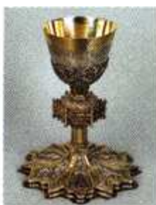
[7] Iglesia parroquial de Villarejo del Valle (Ávila)