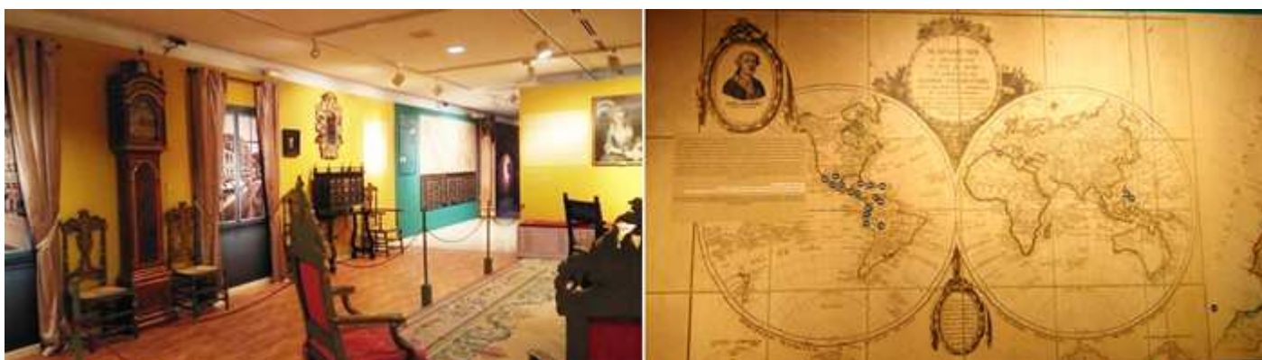
❶ Detalle de la sala del comedor con los muebles del pasillo. ❷ Mapamundi, con la figura del Conde Aranda. Y una señalización sobre el mismo de los aragoneses dispersos por el mundo.

Los ilustrados aragoneses dispersos por el mundo. A lo largo del S. XVIII estos contribuyeron al desarrollo de las ciencias y las artes en distintas partes de los continentes.