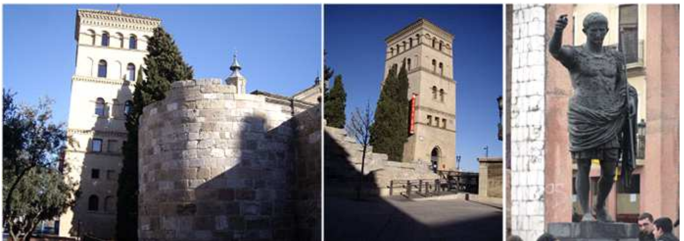
❶ - ❷ Detalle de unos de los cubos con el Torreón de la Zuda al fondo. ❸ Estatua del emperador Augusto, con traje militar de gala, túnica, coraza y paludamentum, con su capa recogida en el brazo, situada bajo cuatro arcos que significan las cuatro culturas de esta ciudad: Cristiana, Ibérica, Islámica y Romana, y sus nombres: Salduie, Caesar Augusta, Saraqusta, y Zaragoza.

En algunas partes la anchura de las murallas llegó a ser de 7 m. y tenía un perímetro de 3 km. estaba abierta por cuatro puertas. En la edad media fue aprovechada por visigodos y musulmanes, y se utilizó durante la guerra de los dos Pedros entre los años 1356 y 1369. Y a partir de esta época por la propia expansión de la ciudad se hizo innecesaria.