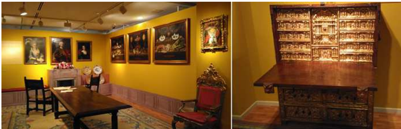
❶ Distintos cuadros del comedor. ❷ Escritorio "de Salamanca" sobre taquillón S. XVII, 2ª mitad en madera nogal tallada con aplicaciones.

Los ilustrados aragoneses dispersos por el mundo. A lo largo del S. XVIII estos contribuyeron al desarrollo de las ciencias y las artes en distintas partes de los continentes.