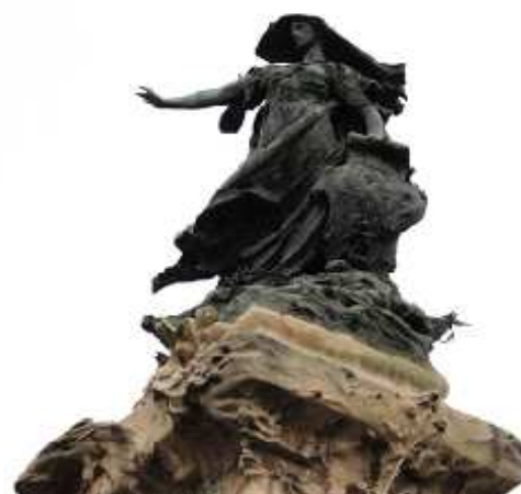
❶ Los defensores de la ciudad en bronce y la escena en piedra sosteniendo una de las puertas. ❷ Primer plano de la figura superior.

Por la calle de Costa llegamos a unos de los templos más antiguo y representativo. Con la interesante fachada está constituida como un gran retablo tallada en alabastro, donde de forma destacada se encuentran los padres de la iglesia y los Reyes Católicos como promotores de la misma.