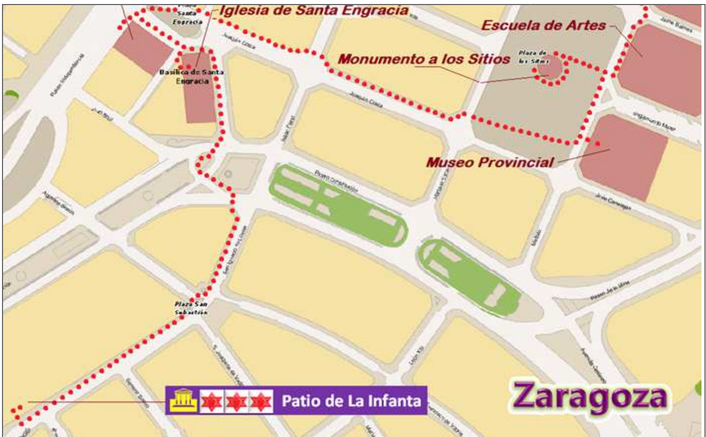
Croquis itinerario visitas, plano empleado de la Web del Ayuntamiento de Zaragoza