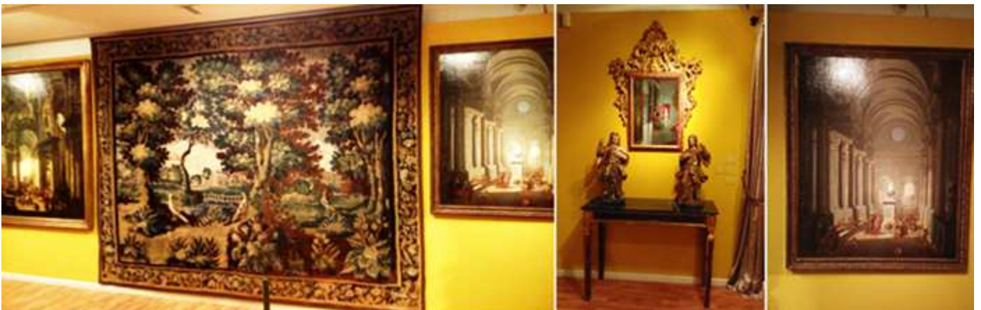
❶ La decoración con cuadros y tapices. ❷ Ángeles S. XVII en nogal tallado y policromado, y una consola 2ª mitad del S. XVIII, en madera tallada, dorada y jaspeada. ❸ Cuadro de uno de los templos zaragozanos.

Del palacio condal de Fuentes (título otorgado por Fernando el Católico en 1508) se recorren tres estancias del mismo, el patio, el salón y la capilla.