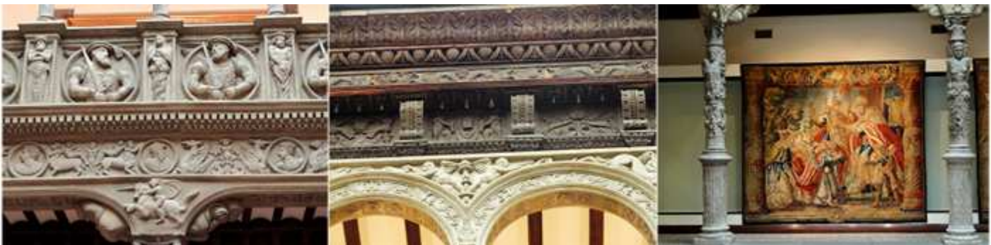
❶ Detalles de la decoración del mismo en piedra y estuco. ❷ Otra imagen de su artesanado plateresco del alero, tallado en madera. ❸ Agradeciendo a Ibercaja el permiso para efectuar estas fotos en la primera visita que efectué.

Es habitual que el patio se realiza distintas actividades y/o exposiciones donde se exponen algunas obras de la Goya propiedad de la institución o de la Real Sociedad Económica Aragonesa de Amigos del País.