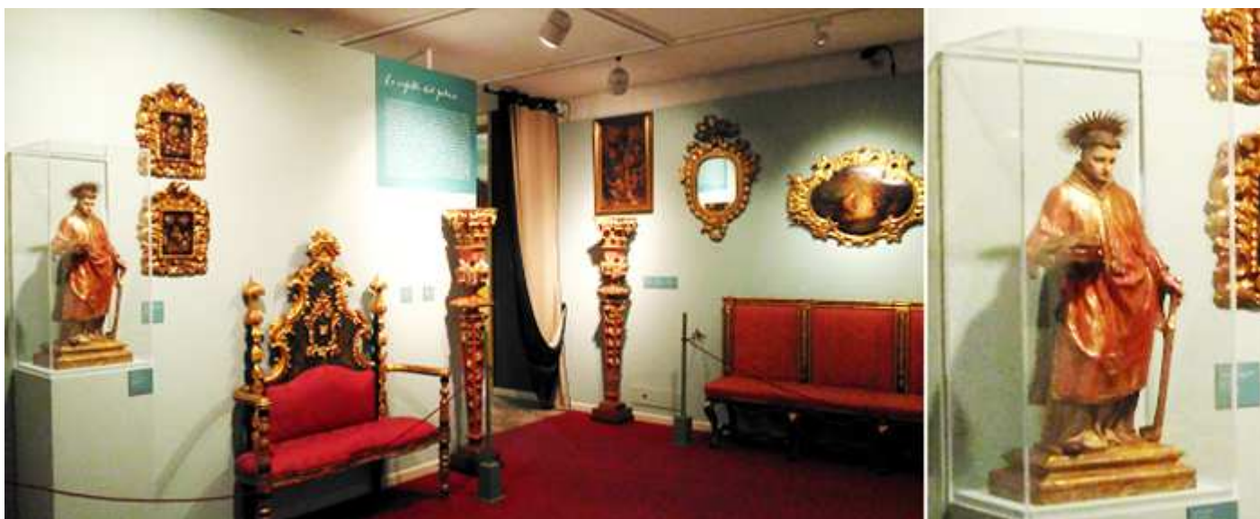
❶ Otra sala que nos muestra cómo eran las decoraciones de las casa de los notables de Zaragoza. ❷ Vitrina con la imagen de un santo.