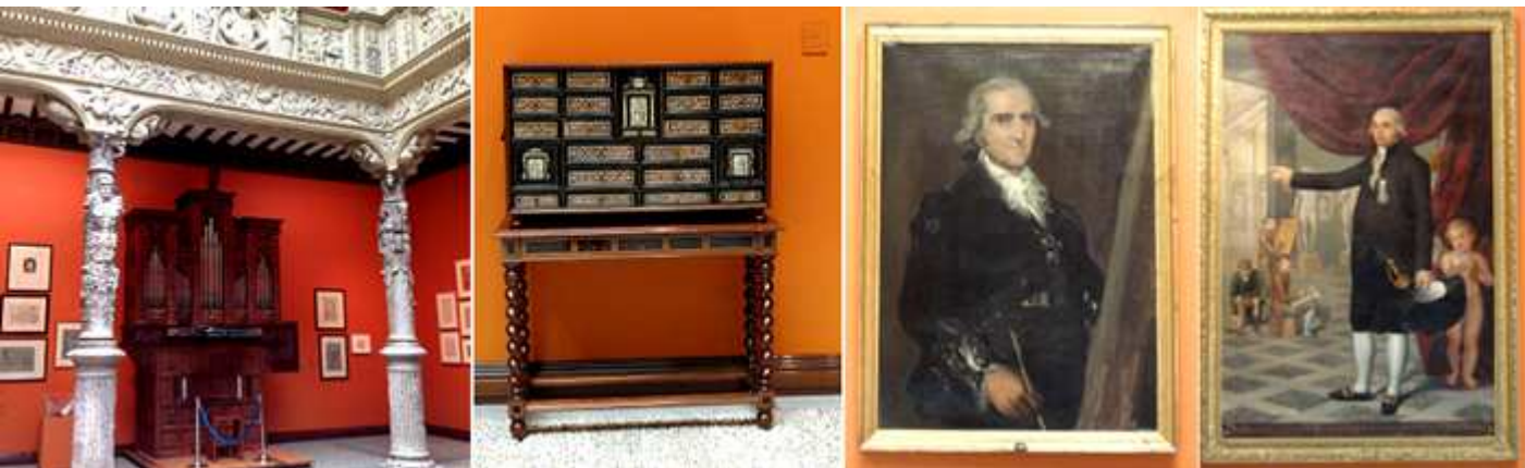
❶ Detalle de una de las alas del patio con un pequeño órgano. ❷ Bargeño con incrustaciones. ❸ - ❹ Diversos cuadros exhibidos en sus laterales.

Es habitual que el patio se realiza distintas actividades y/o exposiciones donde se exponen algunas obras de la Goya propiedad de la institución o de la Real Sociedad Económica Aragonesa de Amigos del País.