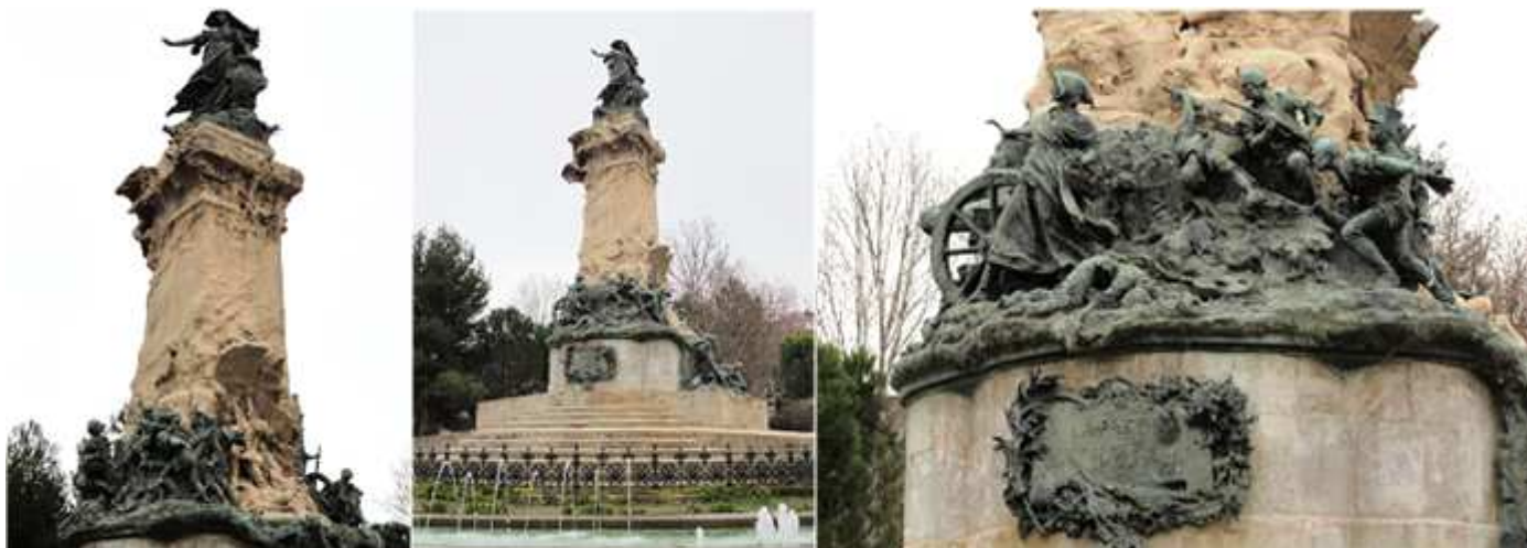
❶ La figura superior femenina se apoya en un escudo de la ciudad. ❷ Está rodeado el monumento con una fuente. ❸ Representación de Agustina de Aragón ante el cañón y arropada por gentes de la ciudad prestas a la defensa