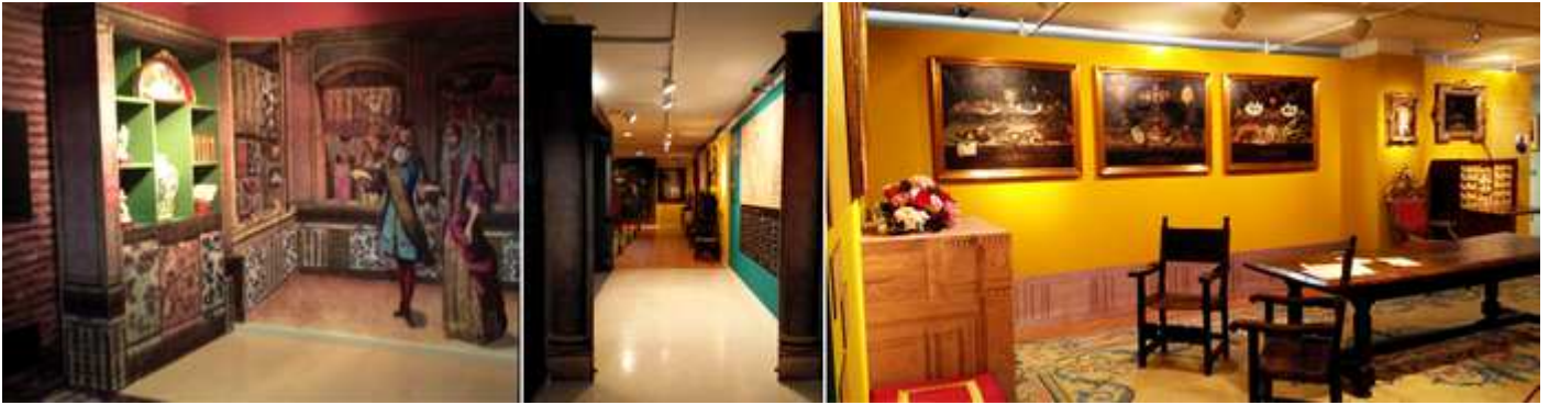
❶ Mural con la recreación de una estancia. ❷ Pasillo para recorrer las estancias del Palacio de Fuentes. ❸ Comedor con la pared del fondo con tres bodegones.

En la calle recordamos el motín del pan acaecido en 1766. Sala III Espacio de libertad. En la sala IV Tiempo de encuentros.