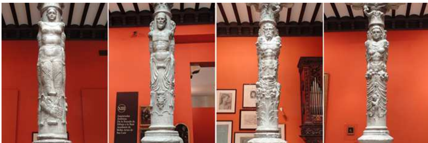
❶ La planta baja dispone de estas columnas. ❷ Con cariátides o estipes. ❸ Columnas anilladas. ❹ Tradicionales aragonesas.

En el pasillo de acceso un gran mural descriptivo de los periodos de este Patio.