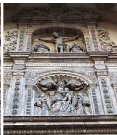
❶ En la fachada renacentista en ella trabajaron los Gil Morlanes padre e hijo en 154-1515. La virgen de las Santas Masas con el niño y sobre ella un Calvario con la Fe y la Esperanza. Abajo diferentes imágenes de esta portada retablo y detalles de la misma.