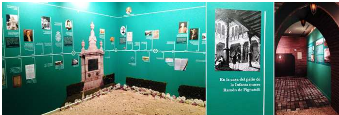
❶ Distintos acontecimientos descritos de forma cronológica. En este mural podemos ver la fuente de los Incrédulos. ❷ En la casa del Patio de la Infanta murió Ramón de Pignatelli. ❸ Umbral de un arco representado las calles de la ciudad.