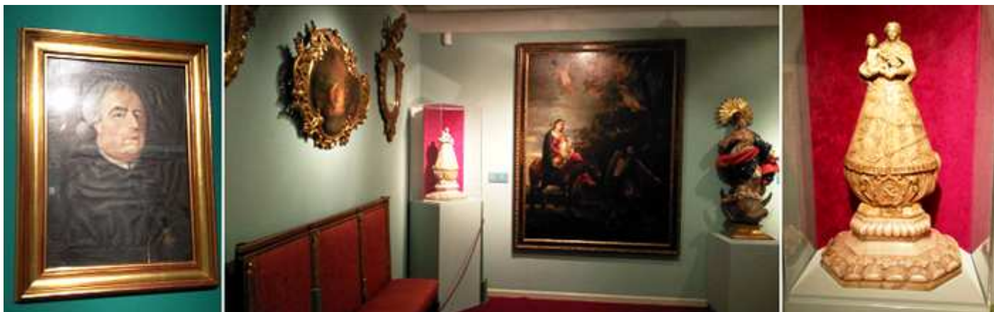
❶ Francisco de Goya. Retrato de D. Ramón de Pignatelli, 1792, óleo sobre papel. ❷ Detalle de esta sala. ❸ Nuestra Señora de Cogullada, Escuela aragonesa, 2ª tercio S. XVIII, Labrada en alabastro.

Esta distribuida en diferentes salas, Sala I La Zaragoza del S. XVIII. Recuperando los escenarios Ilustrados.