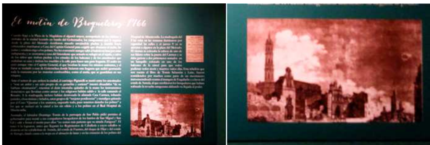
❶ El motín de Broqueleros en 1766. Se produjo en la plaza de la Magdalena cuando el aguacil leía el bando del Gobernador. ❷ Estampa de la Iglesia de la Magdalena y otros edificios junto a la plaza.