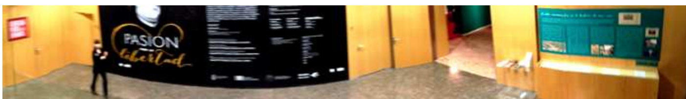
❶ Descendiendo a la planta baja.

Tras haber observado con detenimiento el Patio, bajamos a la planta baja donde están las salas con la exposición.