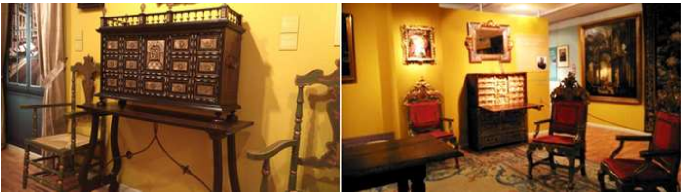
❶ Bargueño decorado.

Vemos los lujos y objetos que complementaban sus palacios o casonas de la burguesía local.