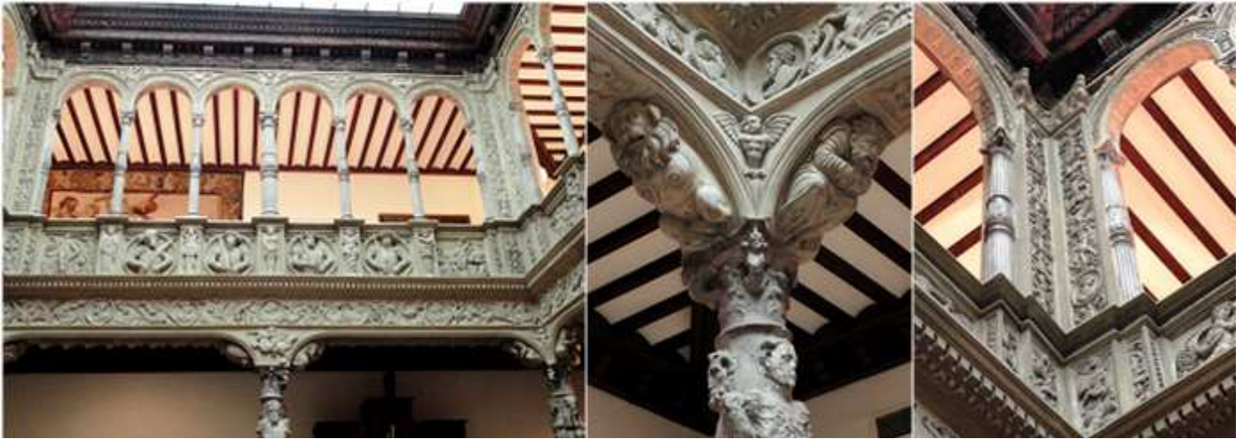
❶ - ❷ - ❸ La segunda planta presenta una galería de arcos de medio punto peraltados. En sus medallones se representan figuras como Carlomagno, Carlos III, Fernando el Católico o Felipe II, además de las escenas mitológicas en diferentes partes del mismo