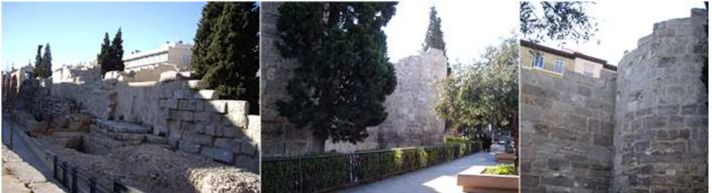
❶ - Los pocos restos de las murallas. ❷ Se encuentran en este sitio y otro tramo en el Coso bajo. ❸ Esta parte de las murallas se construyó en el S.III con sillería de alabastro de varios tipos de piedra entre los que interviene el alabastro. Estamos ante el tramo noroeste de las murallas.

Construida entre el siglo I y el siglo III de nuestra Era, la muralla romana de Zaragoza llegó a tener una longitud de unos 3.000 metros y 120 torreones. Se han conservado dos tramos: el más largo, de unos 80 metros de longitud, en el extremo noroeste de lo que era la ciudad romana de Caesaraugusta, al lado del Torreón de La Zuda, y otro en el lado nordeste, que actualmente forma parte del Convento del Santo Sepulcro.