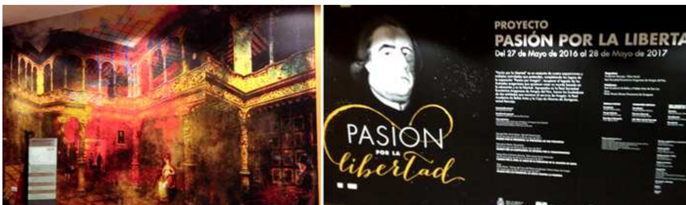
❶ Recreación en un mural del patio en la época de su uso. ❷ Mural de la exposición