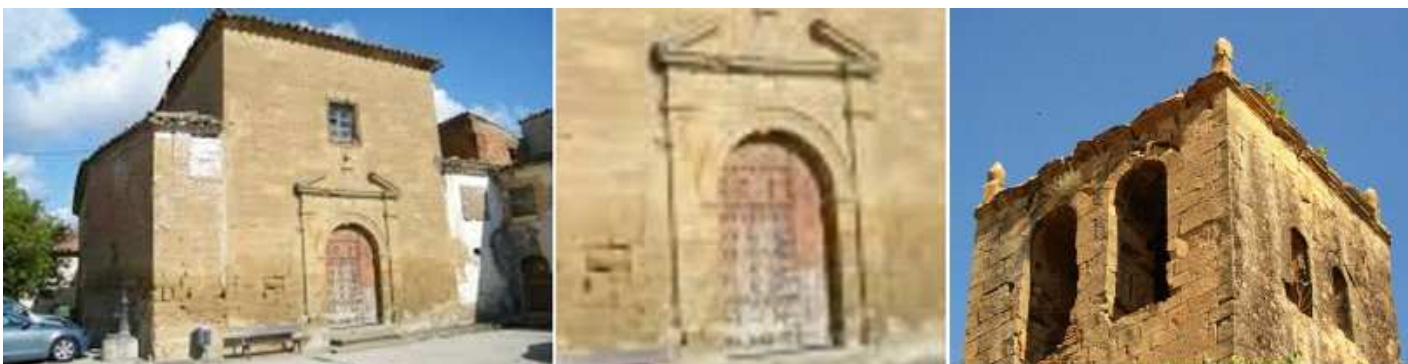
❶ Fachada de la iglesia parroquial de San Andrés entre las calles Barrio nuevo y San Miguel. ❷ Con su puerta de medio puntos con pilastras a los lados y sobre el entablamento un frontis abierto. ❸ Su torre de planta cuadra, y el cuerpo del campanario abiertos con dobles ventanas de medio con su cubierta con un chapitel piramidal con pináculos en sus ángulos.

Este lugar perteneció al señorío de Montearagón, a su entrada posee un crucero del S. XVIII y en la plaza Mayor se encuentra su iglesia parroquial de San Andrés en estilo gótico del año 1562 con una sola nave con bóveda estrellada con una portada de medio punto.