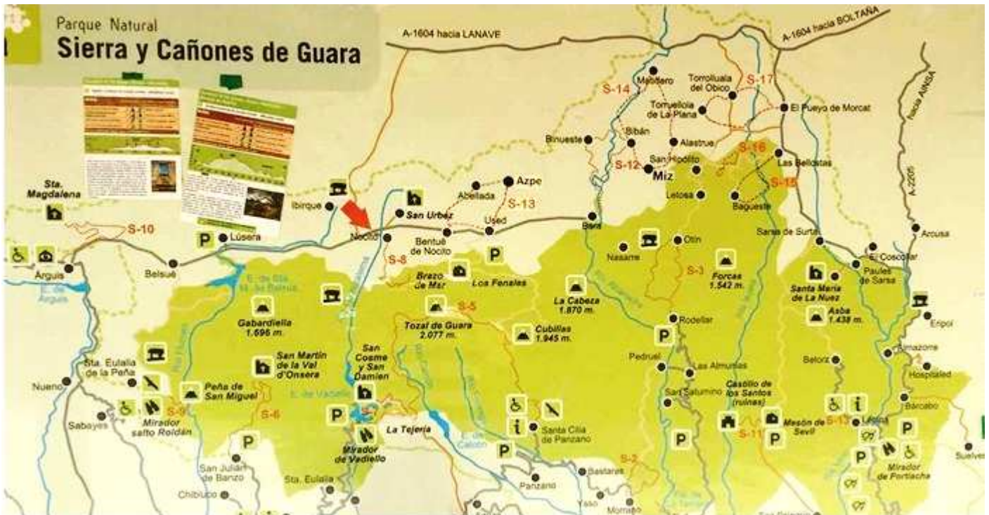
① Plano de esta zona de la Sierra y Cañones de Guara, de uno de los postes informativos en Nocito.