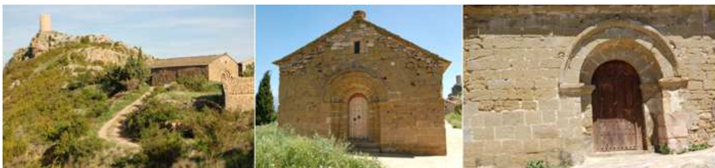
❶ Emplazamiento en esta loma de la iglesia y al fondo la torre. ❷ Puerta oeste a los pies del templo con tres arquivoltas baquetonadas salvo la interior y cubiertas con un guardapolvo con puntas de diamante que descansa en las impostas y las jambas rectas sobre la puerta una pequeña ventana adintelada. ❸ Puerta sur con dos sencillas arquivoltas de arista viva con unas impostas corridas y un guardapolvo baquetonado.

Templo románico del S. XIII con edificación en sillería en esta parte alta del pueblo, es de una sola nave con bóveda apuntada, tiene dos puertas cegadas una a los pies, y se entra por la tercera del lado epistolar de medio punto con dos arquivoltas y enmarcada en nacela sobre imposta, y su testero recto.