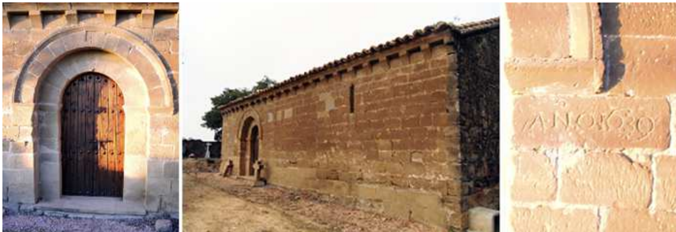
❶ Puerta con dos arquivoltas de arista recta cubierta con un guarda lluvias ❷ Fachada de la Epístola con su puerta y su alero con canecillos lisos. ❸ Inscripción en el lateral derecho de la puerta con la fecha de 1639.

En el interior su cubierta tiene un bello artesonado del S. XIV. Y en su cabecera se encuentran las pinturas del gótico lineal de finales del S. XIII - S. XIV con escenas del monograma de Cristo, el Pantocrátor y a la derecha San Miguel otras a los lados con el juicio final y de la resurrección de los Muertos. En el arco triunfal se encuentra dedicado a San Miguel.