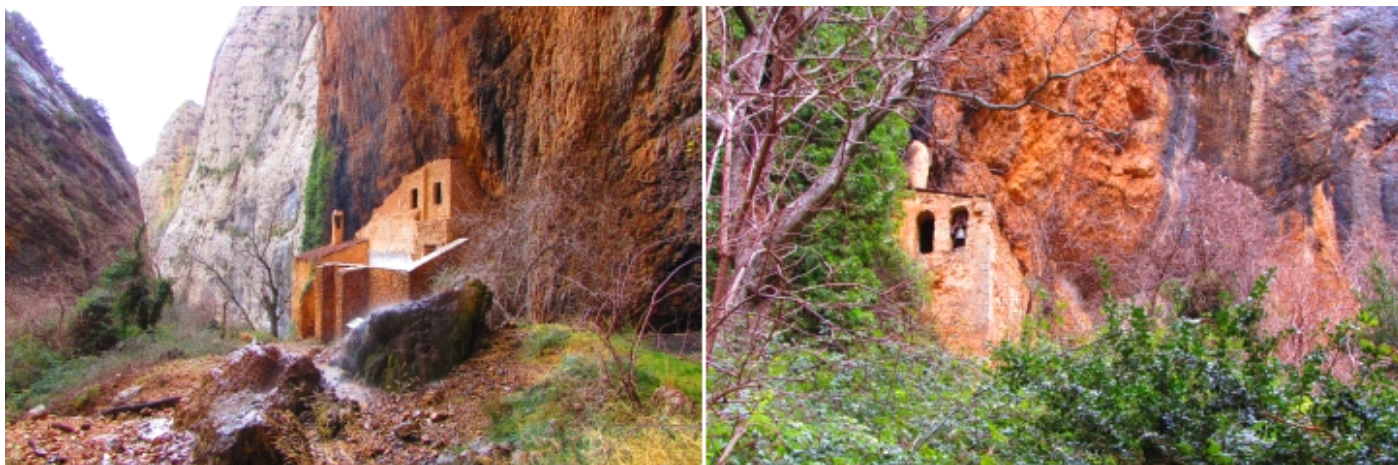
❶ Ubicada en la zona meridional de la Sierra de Guara. ❷ es una ermita, probablemente de origen visigótico cuya actual construcción responde a una reedificación del S.XVII, con añadidos o reformas de los S. XVIII y XIX.