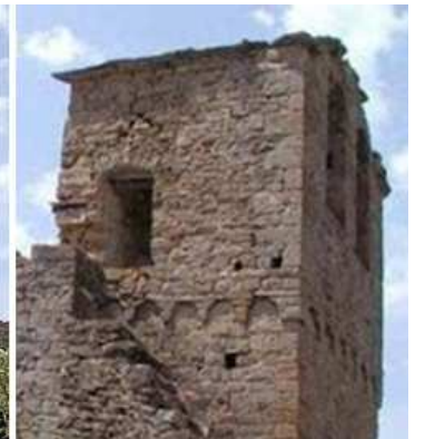
❷ Con su fachada al mediodía. ❸ El lado epistolar abierto con una puerta de medio punto con un guardapolvo, y la torre sobre su cabecera. ❹ A la que se accede por este lado por unas escaleras, en la base del segundo cuerpo dispone en sus tres lados de la franja de arquillos lombardos, esta con una cubierta a dos aguas y en el testero abierta con amplias ventanas.