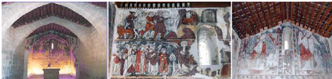
❶ Imagen interior del templo con sus arcos fajones. ❷ Escena en la parte superior del toro descarriado que se ha ido a refugiar en la cueva y el arquero que le dispara una flecha se le vuelve a él, y abajo la comitiva con el obispo de Siponto, que se dirigen a la cueva y se les aparece San Miguel. En el lateral del presbiterio epistolar. ❸ Pinturas de la cabecera con Cristo en majestad y al otro lado San Miguel.

La armadura de su artesonado con multitud de detalles policromados.