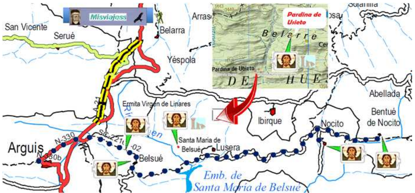
📍 Croquis con los emplazamientos próximos a Belsué.