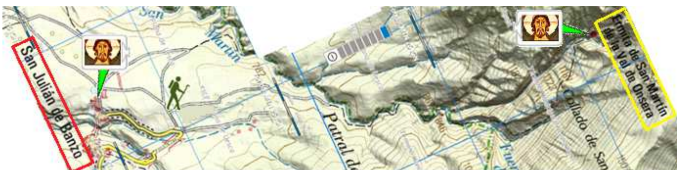
❶ Ubicación de la ermita, usando un plano del Gobierno de Aragón.

Volvemos hacia Barluenga por la HU-V-3302 y continuamos hasta Sasa de Abadiado, y tomando la HU-330 continuamos dirección a Santa Eulalia la Mayor, con el núcleo urbano al borde de las gargantas del río Guatizalema. En la calle Barrio Alto, 8