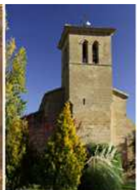
① Fachada al mediodía. ② Con su portada adelantada. ③ La torre se agranda a partir de las impostas voladas.