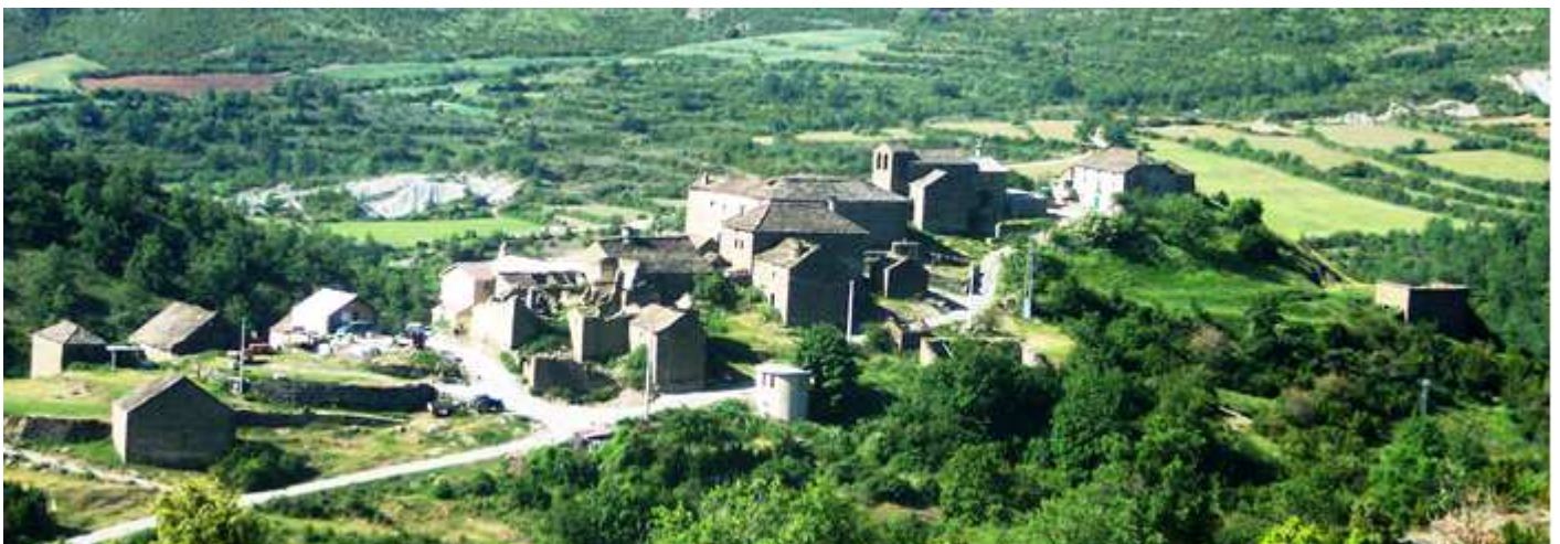
📍 Panorámica de Belsué encaramada en una loma.

A la entrada del Valle de Nocito se encuentra esta localidad.