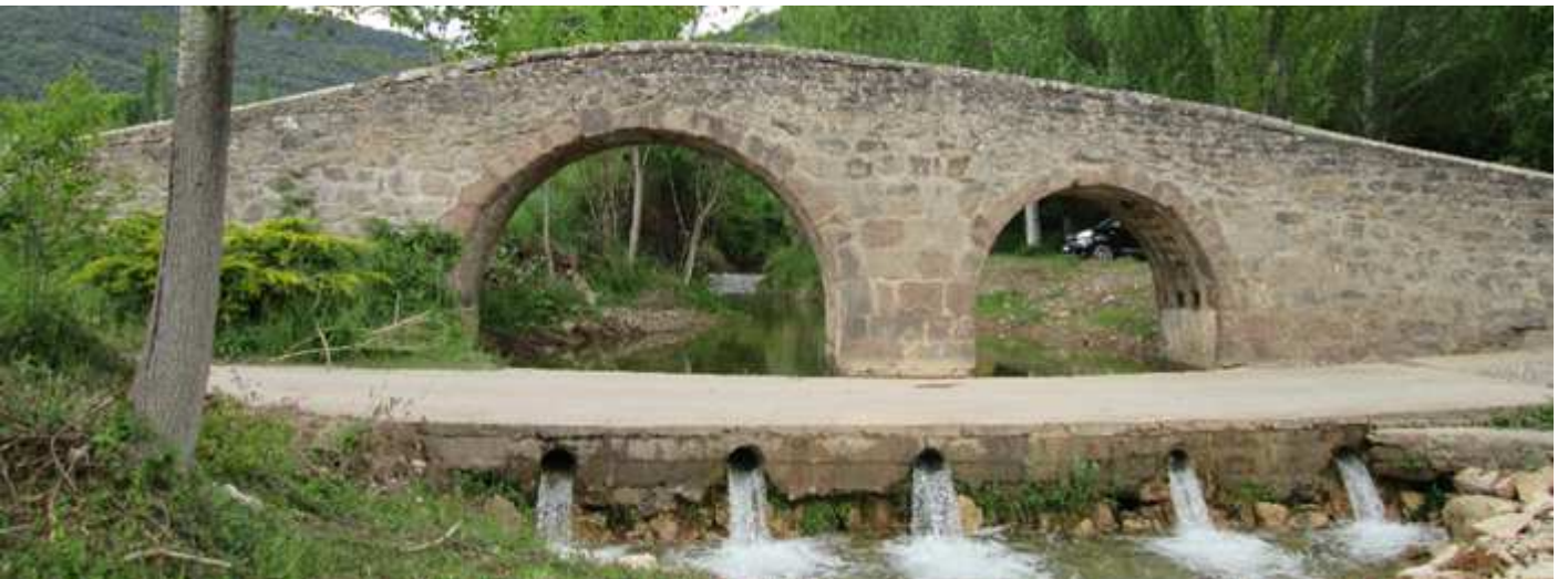
❺ Puente medieval con dos ojos y lomo de asno, que cruza el río Guatizalema que nace en las proximidades.

Localidad ubicada en el valle del mismo nombre, a la que se llega desde Belsué por la pista con su puente medieval de dos ojos que separa las dos barriadas existentes (San Juan y San Pedro) en la localidad. En el primero esta su abadía y la parroquia de San Juan. Con buenos ejemplos de la arquitectura popular y casas de familias infanzonas, como los Cipreses o los Villacampa.