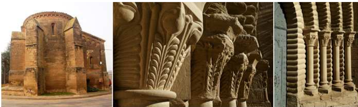
❶ Su cabecera orientada al este con los gruesos contrafuertes puntiagudos y abierta con dos ventanas. ❷ Detalle de los capiteles del lado izquierdo con hojas vegetales con volutas (el 1º reconstruido). ❸ Y los laterales del lado derecho.

Su torre de planta cuadrada adosada a los pies de la iglesia con tres cuerpos separados por impostas corridas, y el último cuerpo abierto con estrechas ventanas dobles de arco apuntado y cubiertas de guardapolvo con cubierta a cuatro aguas.