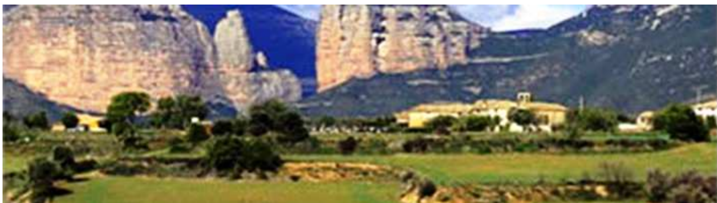
📍 Panorámica de Chibluco.