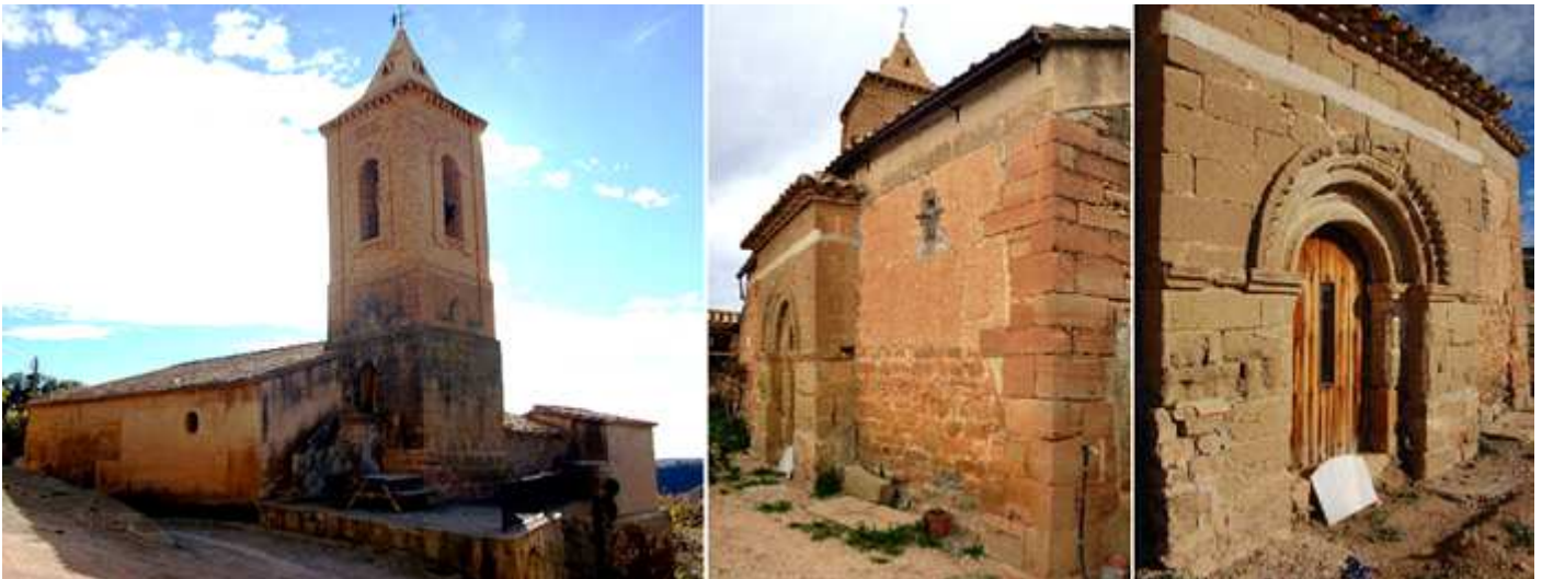
1 Imagen del templo con su cabecera con la torre de planta cuadrada con el primer cuerpo en sillares de piedra y el segundo rehecho en ladrillo en 1886 con un chapitel piramidal. 2 Lateral del Evangelio con la primitiva puerta adelantada. 3 Dispone de dos arquivoltas baquetonadas que descansan en una imposta corrida a lo ancho de su portada, y se cubren con una guardapolvo grueso con puntas de diamante.

Sobre la roca aterrazada se alza este pequeño templo de origen románico de los S. XII-XIII y que fue reformado y ampliado en el S. XVIII, su construcción en piedra sillar, tiene planta rectangular de una sola nave y su testero es plano, con su puerta original en el lado del Evangelio y adelantada con un arco de medio punto con dos arquivoltas y un grueso guarda lluvia con puntas de diamante.