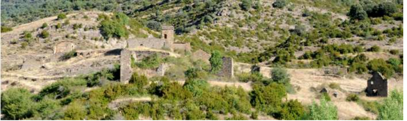
❶ Panorámica del despoblado con la iglesia y las casas.