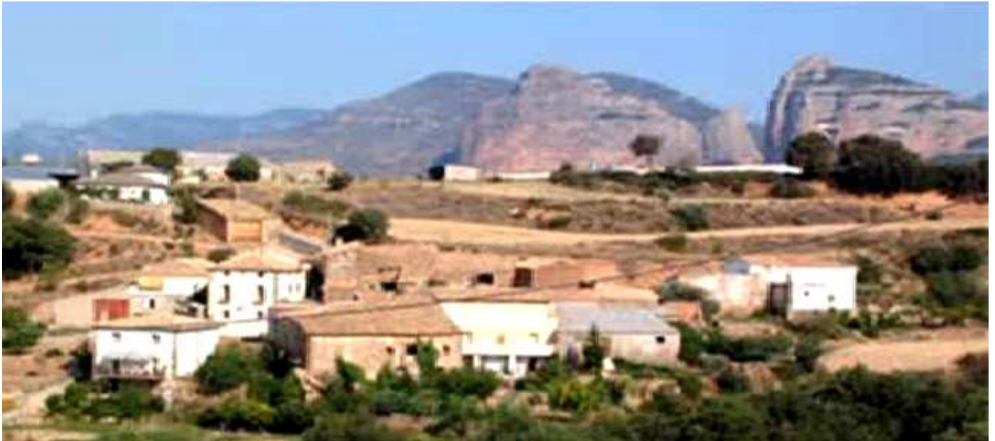
1 Panorama del Caserío de San Julián de Banzo.