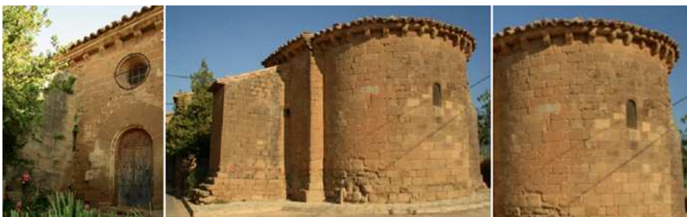
1 Portada donde aparecen en sus dovelas animales y signos granados que la hacen como el mayor mensaje gliptográfico de Europa. Con un óculo sobre la misma. Esta se encuentra entre dos gruesos contrafuertes uno de ellos aloja una pequeña capilla. 2 Su cabecera semicircular. 3 Abierta con una ventana sencilla de medio punto.

Construida en la segunda mitad del S. XIII con planta rectangular con bóveda de cañón apuntado sobre arcos fajones que descansan en una imposta corrida y a su vez en las pilastras, con cabecera semicircular con bóveda de horno, en su arco triunfal capiteles historiados y dos capillas en sus laterales. Tuvo reformas posteriores. Su entrada que rehecha en el S. XVII y en ella presenta una colección de dovelas esculpidas.