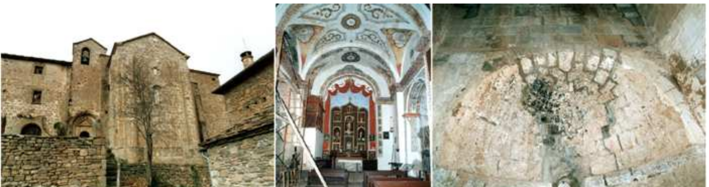
❶ Exterior del lado sur ❷ Decoración con yeserías y pinturas de la nave con el retablo Mayor al fondo. ❸ Absidiola románico en un lateral.

El templo sufrió importantes reformas en el S. XVI cambiándose la orientación, ampliando la nave con dos tramos más al este, y realizando una nueva cabecera de testero recto. A los lados dispone de dos capillas. Posteriormente en el S. XVIII se cambiaron las cubiertas por bóvedas cañón. Se compone de nave única.