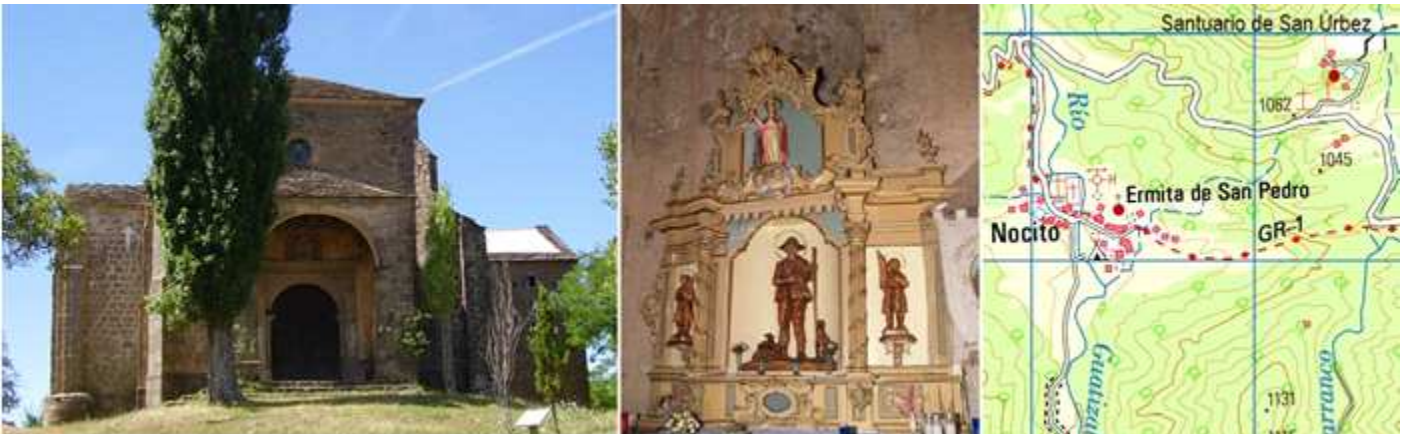
❶ Entrada por este pórtico abierto en sus tres frentes y puerta renacentista en la parte oriental del templo. ❷ Retablo de tres calles en una de sus capillas. ❸ Mapa procedente del I.G.N.

Templo de los S. XVI-XVII que conserva algunos tramos románicos del S. XII del anterior templo cercano a la cueva – eremitorio donde paso sus últimos años en los S. VIII-IX. Y el culto al santo ya estaba desde el S. X con los monjes que existían en el monasterio. El santo murió en el año 802.