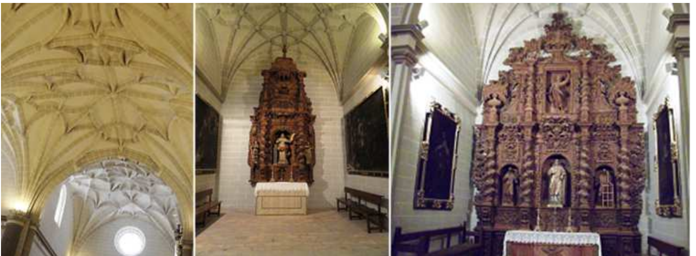
❶ Bóvedas de crucería de la nave. ❷ Capilla de Santa Bárbara con un retablo de madera S. XVII-XVIII. ❸ Capilla de San Vicente S. XVII-XVIII.