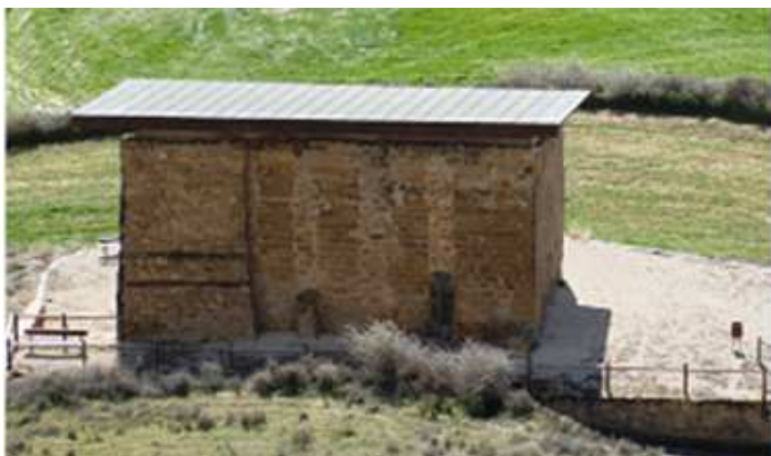
1 Vista de la ermita desde la colegiata.

Ermita de Mueras muestra actualmente planta de una sola nave, dividida en dos tramos por un arco tajón de medio punto. Actualmente está sin este y su techumbre. La portada abocinada con dos arquivoltas baquetonada la exterior y de arista viva la interior cubierta con un guardapolvo, ubicada en su lado epistolar.