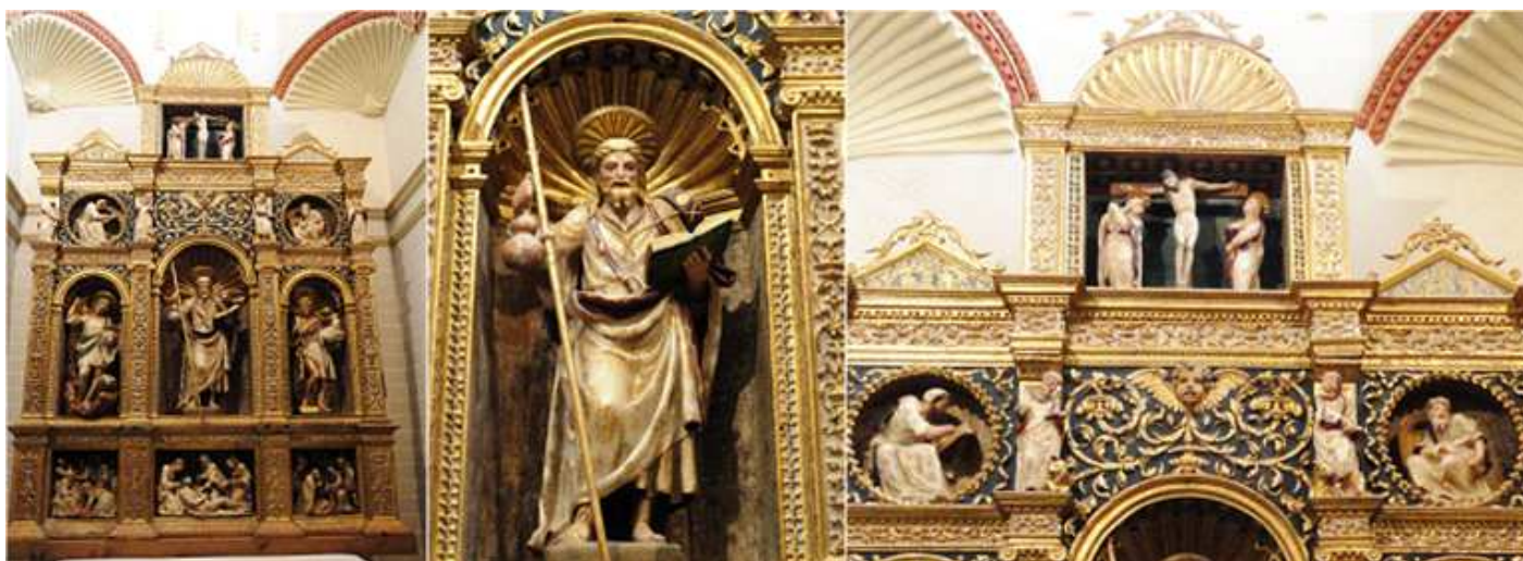
1 Retablo de Santiago en el que aparecen además de la figura de Santiago en alabastro policromado, San Juan Bautista, y San Miguel en la predela la Epifanía, Descendimiento y el Nacimiento, y en el ático un precioso Calvario en la separación de las calles los cuatro evangelistas, y en los medallones el profeta Isaías y el rey David. 2 El apóstol en la hornacina central. 3 Parte superior con el Calvario en el ático.

En el lado de la epístola se encuentra la capilla de Santiago, históricamente se le ha atribuido este retablo al taller de Damián Forment 1532.