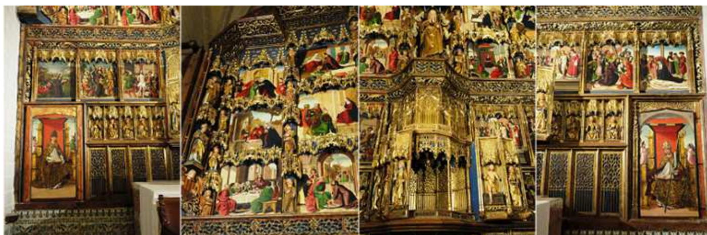
❹ Lateral izquierdo del retablo. ❺ Sobre doseletes las esculturas entre las calles. ❻ El habitáculo del Sagrario abierto. ❼ La parte derecha.