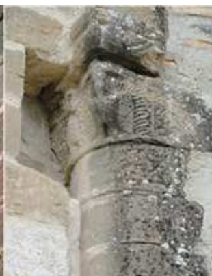
2 En este capitel nos muestra dos piñas.