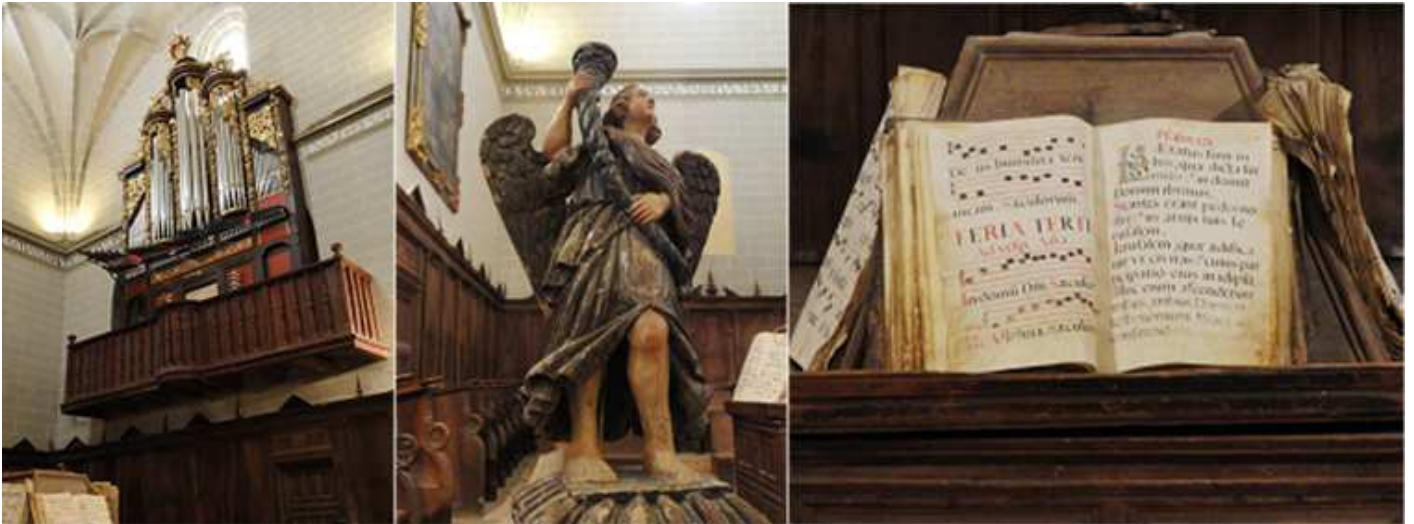
❶ Órgano del primer cuarto de S. XVIII, con 1031 tubos. ❷ Porta candelabro. ❸ Facistol con libros e salmos en pergamino, manuscritos en el S. XVIII.

XVII y XVIII. Dispone de un sobrio coro de nogal y roble, con un facistol giratorio para cantorales.