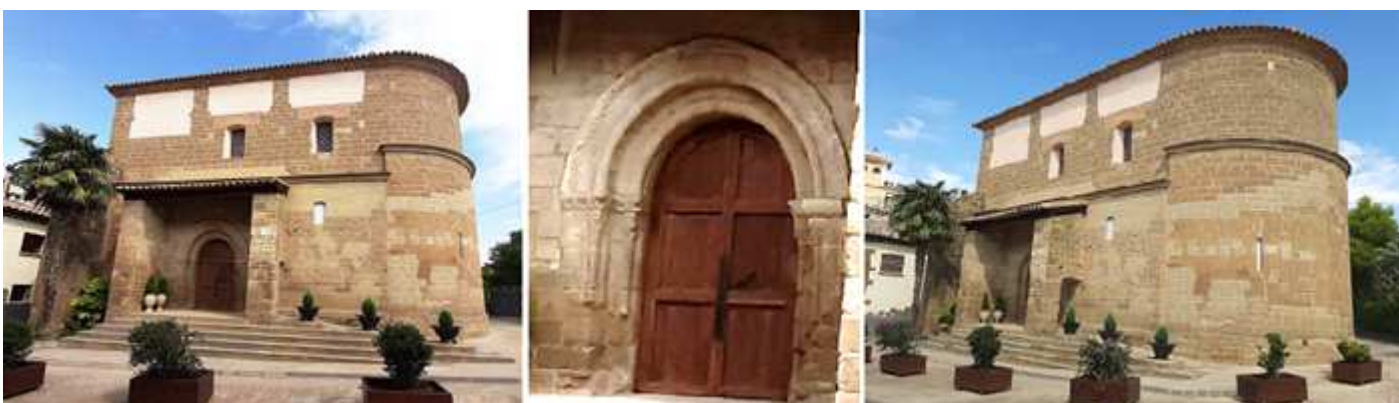
❶ Fachada de la iglesia de San Martín. ❷ Con su portada dentro de un pórtico abierto entre los dos contrafuertes. ❸ Su ábside semicircular liso con una moldura en su alero y abierto con dos finas ventanas de aspillera, se aprecia el notable recrecimiento.

Esta iglesia se construyó en el S. XII, y el S. XVIII tuvo importantes transformaciones, entre ellas el notable recrecimiento de la nave y cabecera y recientemente restaurada, consta de una nave con ábside semicircular, conservando sus muros originales a los que se recreció notablemente, su portada en el lado epistolar de dos arquivoltas acanaladas y un guardapolvo taqueado que descansan sobre impostas y capiteles decorados con motivos vegetales y estos sobre columnas.