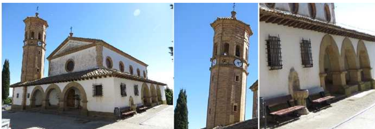
1 Fachada del templo con un porche a los pies del templo y prolongado en el lateral epistolar. 2 Torre construida en ladrillo de planta octagonal de estilo mudéjar aragonés. 3 Porche lateral con arcos de pedio punto realizados en ladrillo.

Templo de los años 50 del siglo pasado, dado que su anterior templo fue destruido cuando la guerra civil