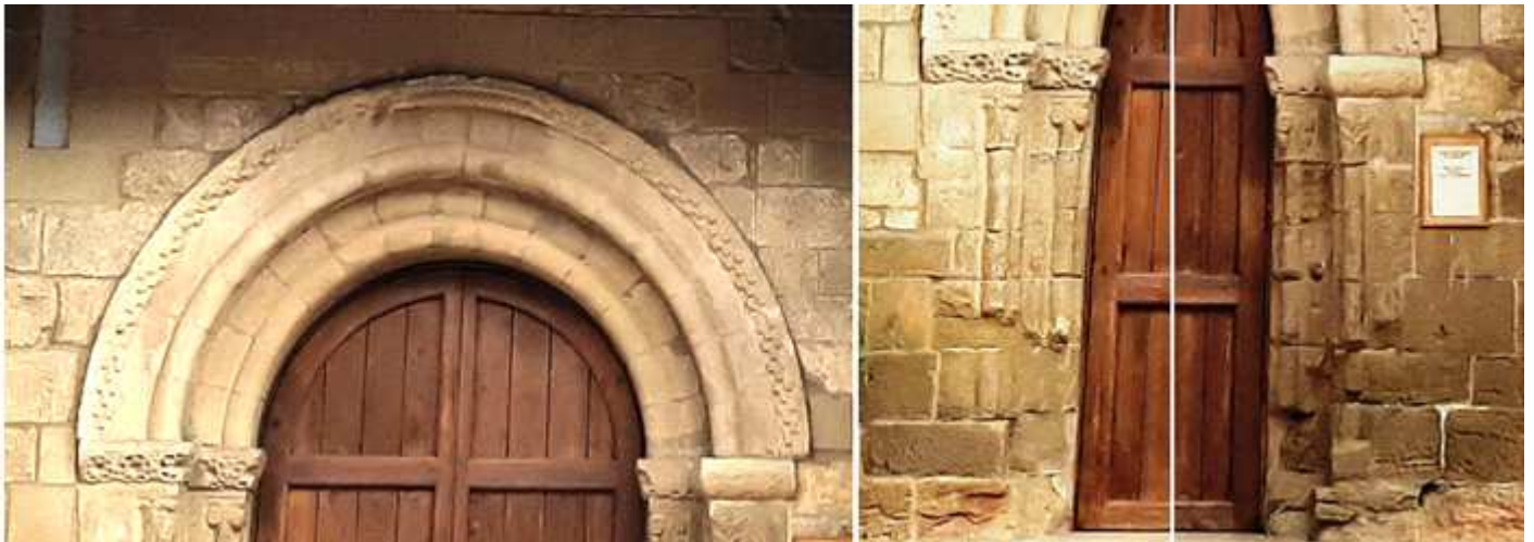
❶ Su portada entre contrafuertes es de medio punto. Su puerta de dos arquivoltas baquetonadas y la exterior con un guardapolvo taqueado ❷ En el lado izquierdo su imposta decorada con flores y sus capiteles con motivos vegetales y volutas. ❸ En ambos lados sus columnillas se encuentran fragmentadas.