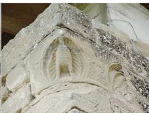
2 - 3 Detalle del capitel que en el extremo del ábside podemos ver en el exterior.