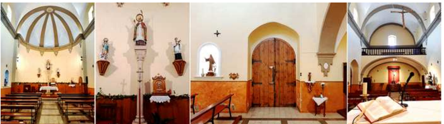
❶ Su ábside encalado posee una bóveda de cuarto de esfera con cinco gajos a su clave central. ❷ En su cabecera sobre un moderno conjunto de columna y capitel la talla de San Martín obispo con báculo, con la Inmaculada Concepción y San ¿? ❸ Lateral de la Epístola con su puerta. ❹ A los pies del templo su coro elevado sobre dos arcos rebajados sobre ménsulas, con los accesos al coro y a la torre.