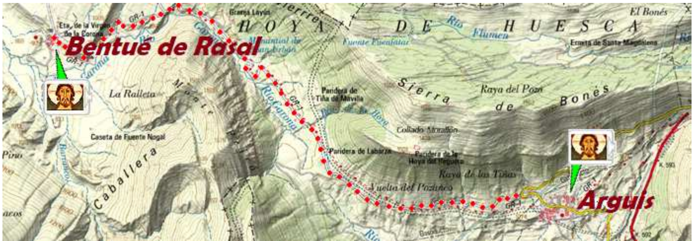
📍 Croquis desplazamiento Bentué de Rasal por la estrecha carretera que lleva pareja el GR-1. Mapa Leaflet CC BY 4.0