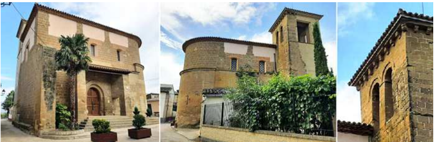
❶ El hastial del templo se encuentra una ventana de arco rebajado. ❷ Lateral exterior del lado del Evangelio Su torre de planta cuadrada se encuentra adosada a los pies del muro norte y parte de la misma esta reconstruida. ❸ En esta cara podemos apreciar dos ventanas de medio punto con guardapolvo y bajo su alero diversos canecillos con motivos geométricos.