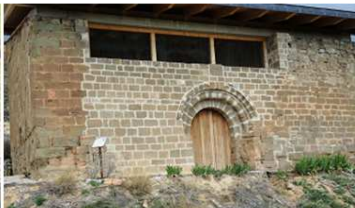
2 Portada de la ermita de Mueras orientada al sur, sin decoración.

El ábside original que ha desaparecido era circular, que cerraría una bóveda de cuarto de esfera.