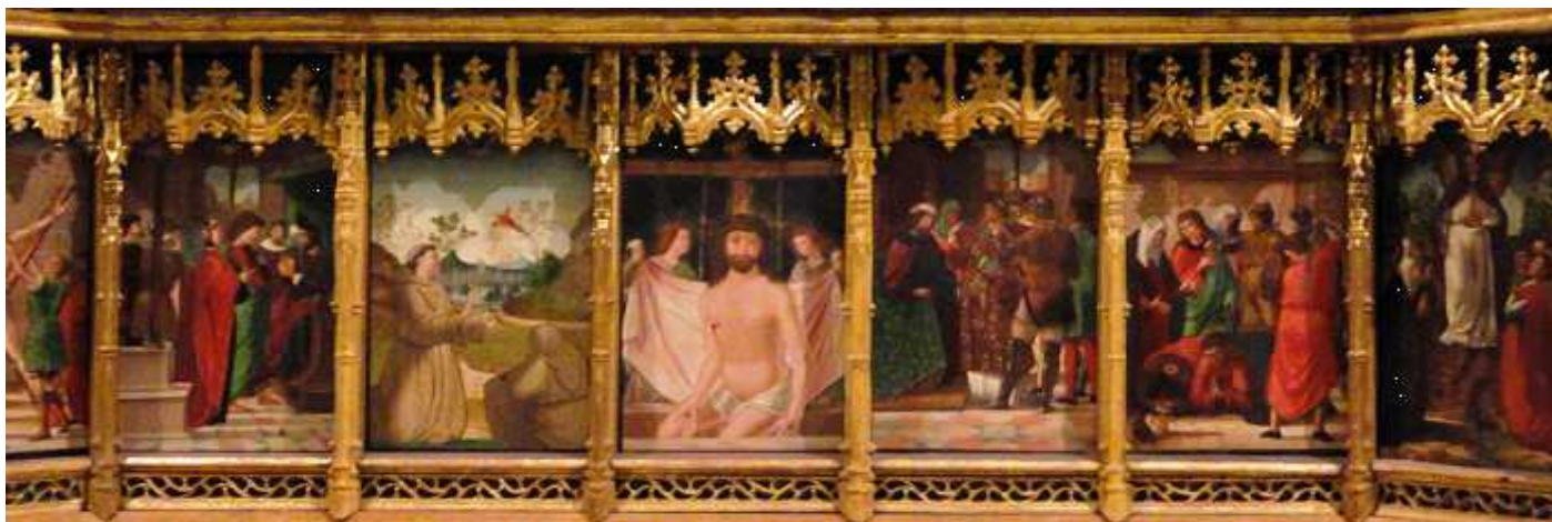
❶ Las siete tablas que contiene la predela, fueron realizadas por Pedro de Aponte y Pedro de Dezpiota, a los cuales se les solicitó que fueran ejecutadas tomando como ejemplo de las pinturas del retablo Mayor.

Al llegar al crucero nos encontramos con el retablo de San Sebastián, donde se encuentran representados S. Roque, S. Nicasio de Reims, San Sebastián, San Blas, y San Pedro de Verona, de traza gótico-flamenca.