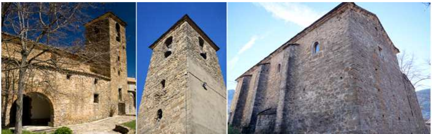
❶ Exterior del lateral de la Epístola con su puerta de medio punto cobijada con este pórtico y adosada a la cabecera su torre. ❷ Torre de planta cuadrada de un cuerpo con cubierta a cuatro aguas y abierta con ventanas su campanario y dos más pequeñas en su escaleras y su puerta elevada. ❸ Exterior del lado del Evangelio al noroeste con tres contrafuertes y abierta con ventanas. Sobres sus muros también se aprecian otra ventanas cegadas.

Esta iglesia de orígenes románicos fue muy trasformada en los S. XVII y XX, su exterior dispone de contrafuertes, de nave única con una portada de arco de medio punto, en el lado epistolar se encuentra protegida por un pórtico y junto a la cabecera su torre de un cuerpo que acoge las campanas.