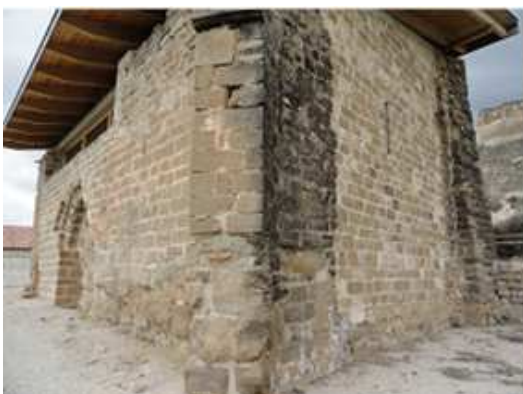
1 Perspectiva desde el ábside.

El ábside original que ha desaparecido era circular, que cerraría una bóveda de cuarto de esfera.