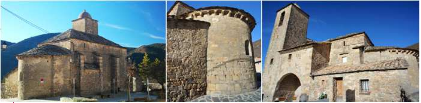
❶ Ábside con el presbiterio y el exterior del lateral del Evangelio. ❷ En el lado epistolar tiene una construcción adosada al ábside y al pórtico de entrada. ❸ Panorámica con el lado de la Epístola y el pórtico con un gran arco.

Desde Arguis por la SC-220337-02 se llega a Bentué de Rasal localidad prepirenaica enclavada en medio del valle que rodean las sierras de Presin, Peiró, Fabosa y Caballera. El rey Pedro II de Aragón cedió al obispo de Huesca en 1198 el derecho de patronato de la iglesia de esta localidad. En la década de los años 60 del siglo pasado se incorporó a Arguis.