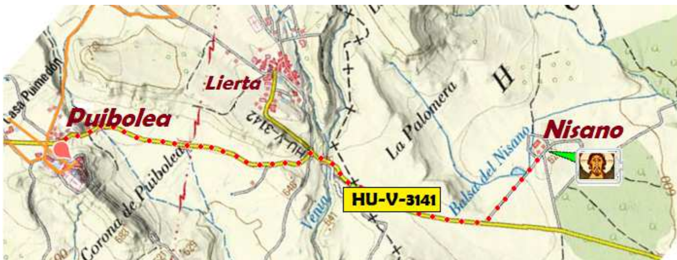
1 Croquis desplazamiento Casillo de Nisano.

De la localidad no queda nada salvo las ruinas de su iglesia o de algún muro de alguna casa, el templo tenía nave única rectangular con cabecera semicircular y se construyó en el S. XII. Y sus restos que se mantienen a penas dan testimonio de la misma.