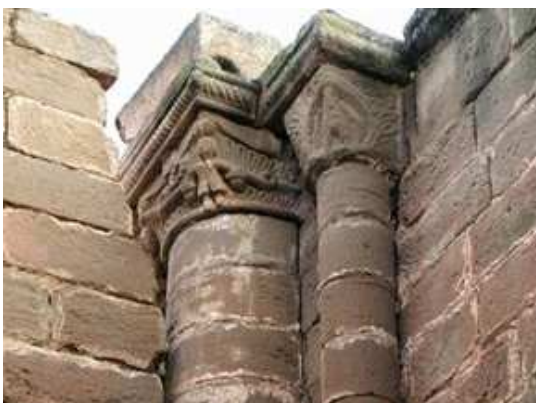
1 Capiteles en uno de sus ángulos.

Construida con sillarejo de piedra caliza, donde se aprecia por su color las diferentes intervenciones que con el paso de los tiempos ha tenido el templo.