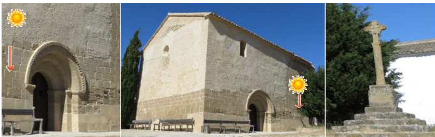
1 Portada con dos arquivoltas y un guarda polvo con puntas de diamante. Y la situación de los relojes. 2 Lateral del hastial abierto con un óculo, y el de la Epístola con una ventana adintelada, situación de los relojes en el presbiterio. 3 Crucero a la derecha de la fachada y tras el edificio del cementerio sobre un estrado de cinco escalones y sobre un pódium.