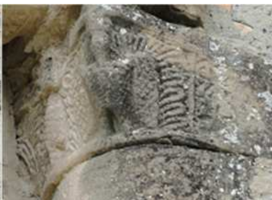
3 Detalle del mismo.

En su interior el parámetro norte es el original, con un vano sin decoración en el lado oeste y presenta sobre sus columnas diferentes capiteles esculpidos con figuras y personajes.