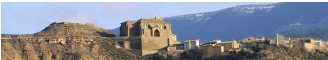
1 Panorámica de Bolea y su Colegiata.

Para ir al despoblado de las Casas de Gratal, desde el Puibolea una pista sale hacia las granjas, y alcanzadas estas se encuentra a 1 km completamente rodeada de la vegetación.