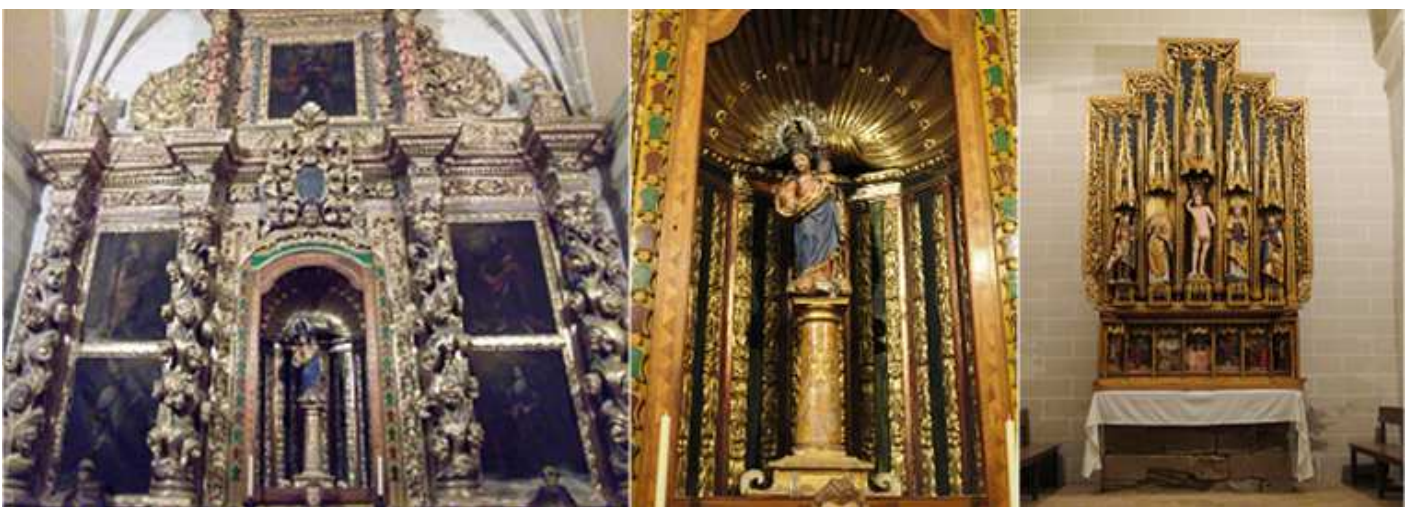
❶ Capilla de la Virgen del Pilar, igualmente barroca del S. XVII-XVIII. ❷ Columna y la Virgen con el Niño en la hornacina central. ❸ Retablo de San Sebastián efectuado en 1503. El retablo de cinco calles con los santos y San Sebastián en la parte central del mismo. Y la predela con siete tablas pintadas, con diferentes episodios bíblicos.