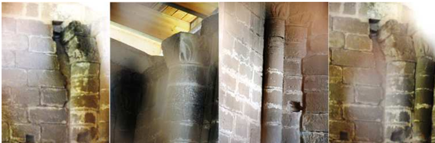
1 - 2 - 3 - 4 Diferentes detalles de las columnas acodilladas que hay en la cabecera del templo.