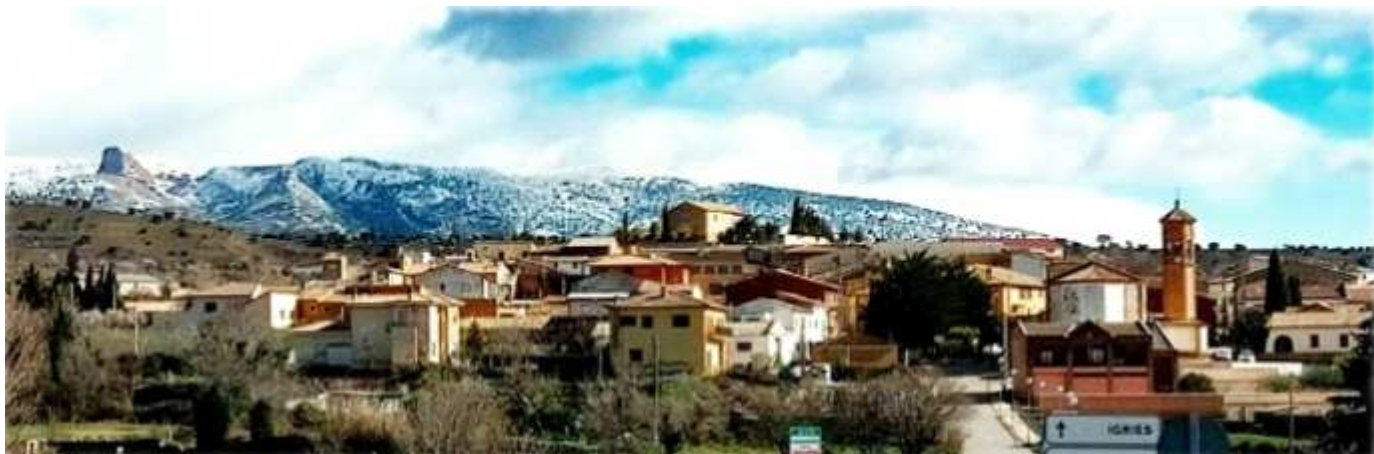
1 Panorámica de la localidad.