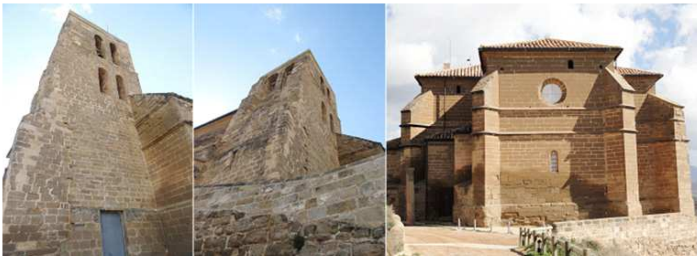
❶ Torre románica de la colegiata, de tres cuerpos con los dos superiores con vanos para las campanas. ❷ De planta cuadrada. ❸ Su testero recto con potentes refuerzos de sus contrafuertes.

La Colegiata fue construida entre 1541 y 1559, sobre la cimentación de un templo románico del XII del que se conserva la torre-campanario y una cripta bajo el presbiterio.