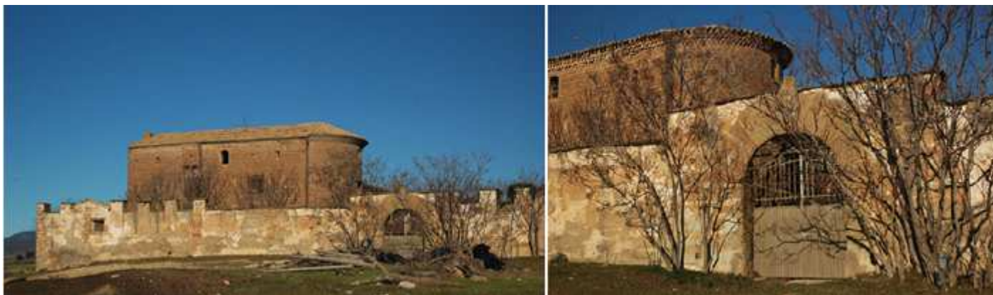
❶ Esta propiedad particular conserva la cerca que en algunos tramos se encuentra almenada con un portón de medio punto con grandes dovelas. ❷ Portalón con un escudo gótico.

Es un templo reutilizado hacia el S. XVI en una casa torreada en el lado epistolar se le añadió un matacán con pequeñas aperturas, en este lado posee su puerta con un arco de medio punto, todo el alero está formado por tres bandas de teja formado arquillos finos. Posee dos plantas, la inferior usada como almacén y la superior de vivienda. El hastial posee dos dobles ventanas adinteladas una sobre un grueso y potente contrafuerte. En sus muros se abrieron diferentes ventanas adinteladas a parte de las originales durante los S. XVII – XVIII.