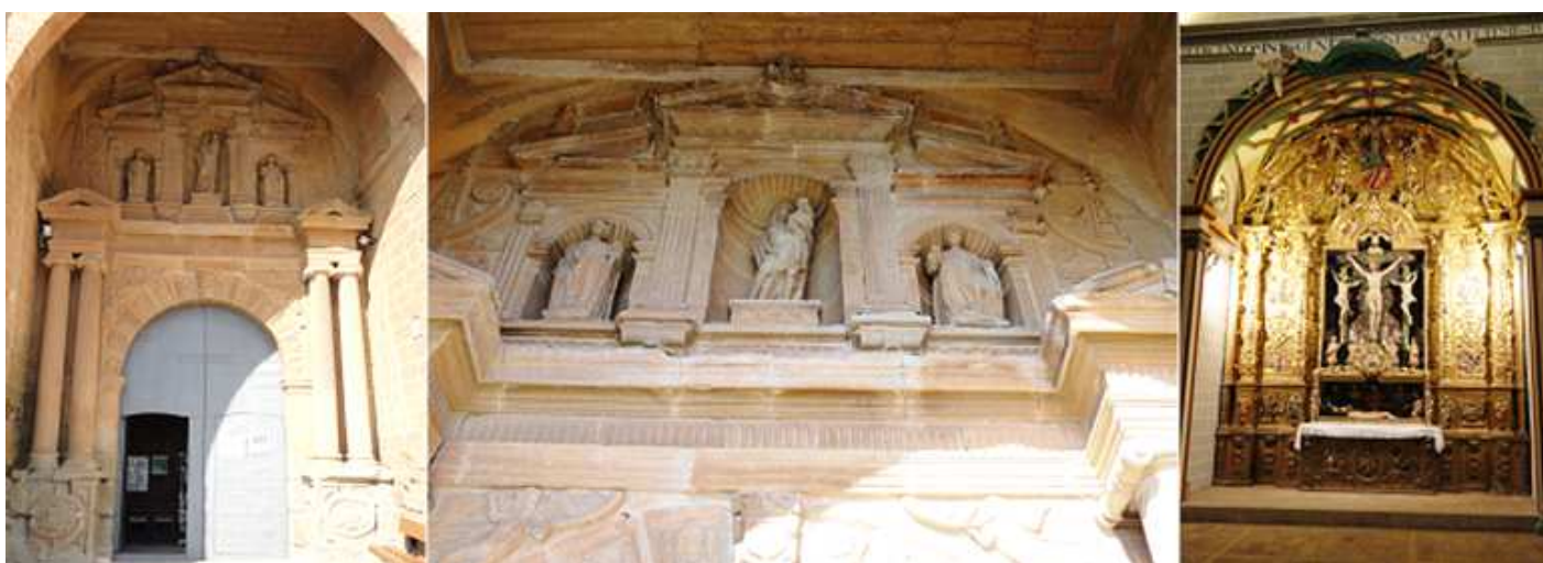
❶ Portada manierista obra de Juan Miguel de Oliens y su oficial Juan de Escoz de 1611. ❷ Parte superior con tres hornacinas, alojando en la central a la Virgen con el Niño. ❸ Capilla barroca de la Crucifixión S. XVII-XVIII.

El templo es mostrado por la Asociación de Amigos de la Colegiata.