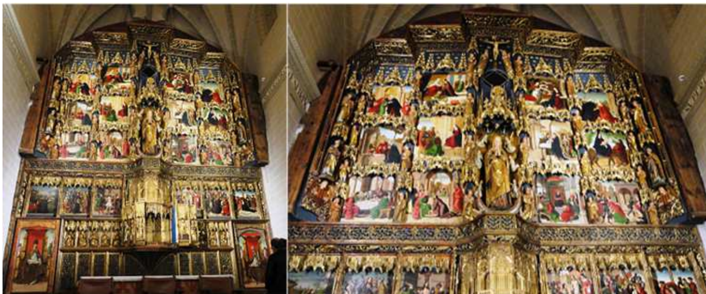
❷ Retablo Mayor. ❸ Podemos observar la oración en el huerto, el prendimiento, la última cena, el descendimiento....todo con un impresionante colorido. (1490-1503).

Nos situamos en el altar Mayor, con su maravilloso retablo, realizado entre 1490 y 1503 y que perteneció al anterior templo. En el mismo podemos observar gran cantidad de tallas de madera policromada y varias tablas pintadas “al temple”.